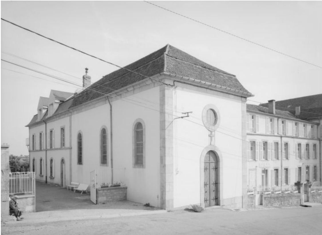
Vue sur la chapelle.