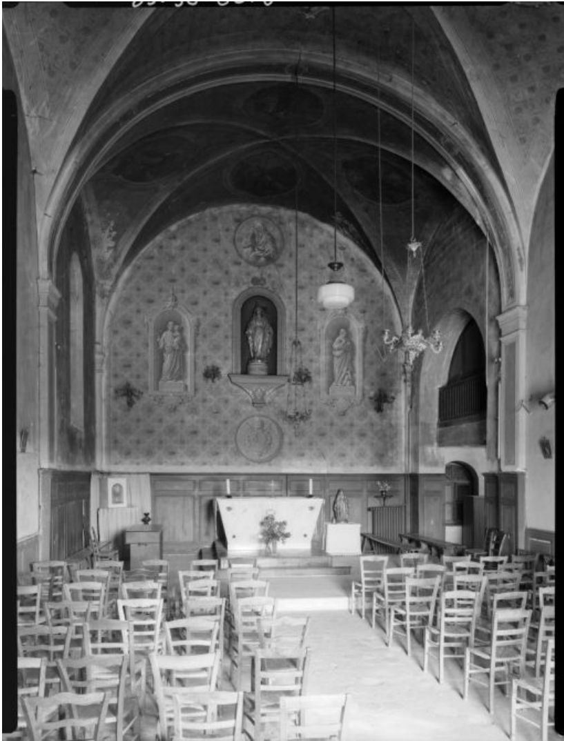
Vue intérieure de la chapelle.