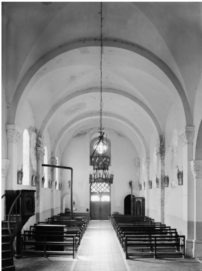
Nef. 58, Mont-et-Marré