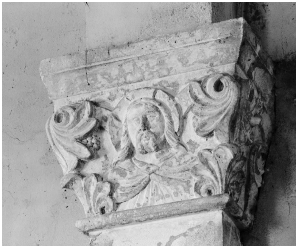
Choeur, chapiteau postérieur droit.