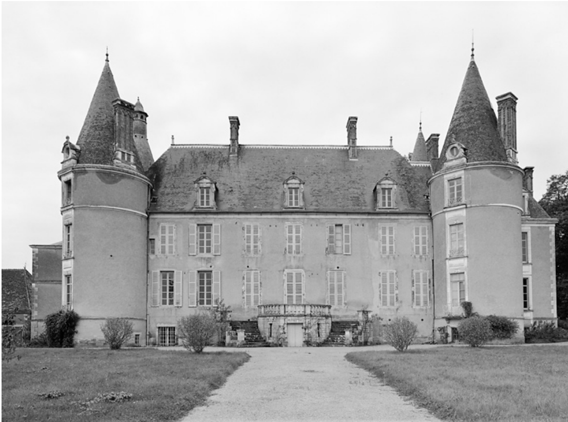
Façade postérieure du logis.