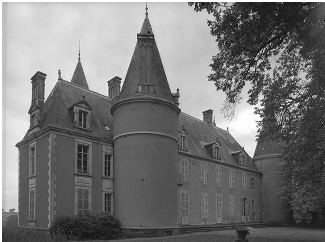
Façade antérieure du logis.