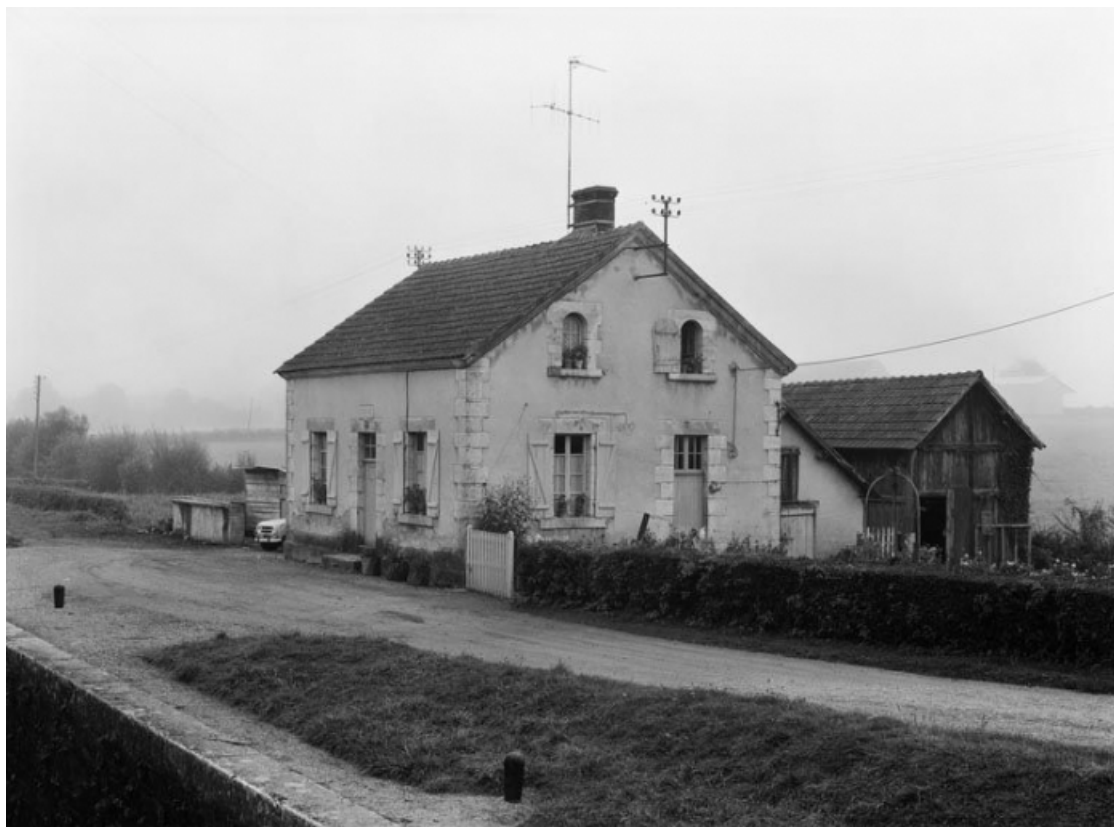
Vue d'ensemble de la maison éclusière en 1975.

58, Brinay bief 22 du versant Loire, lieudit : bief 22 du versant Loire