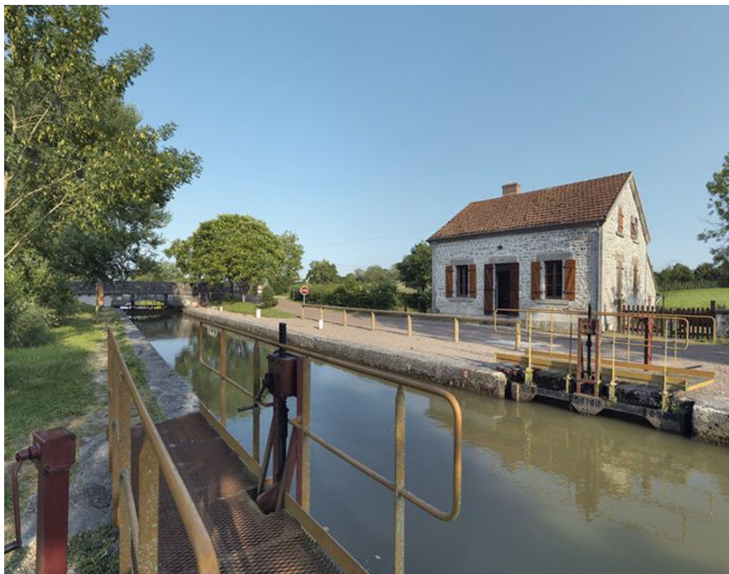
Le site d'écluse avec la maison éclusière, rive droite.

58, Brinay bief 22 du versant Loire, lieudit : bief 22 du versant Loire