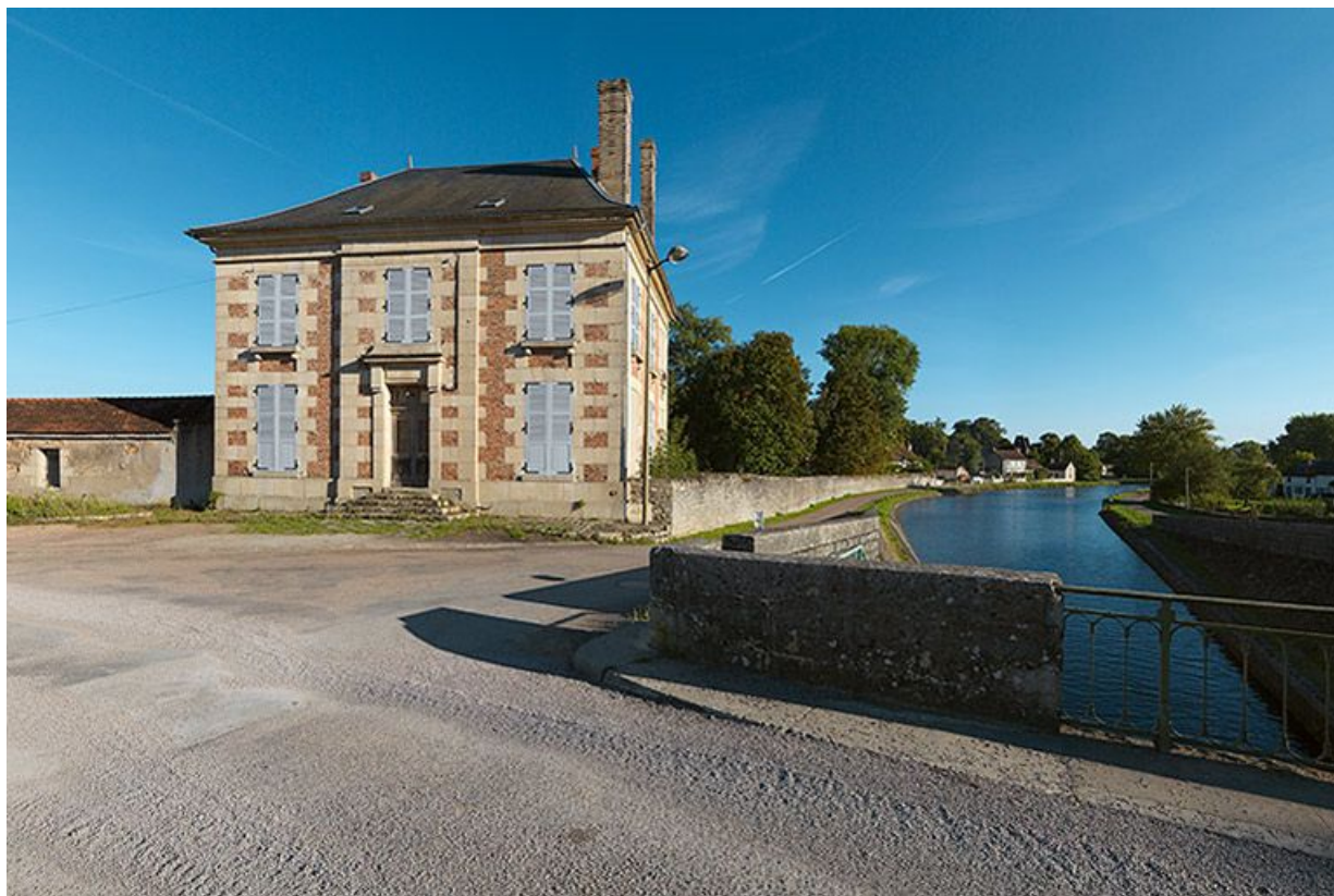
Vue de face. A droite le canal.

58, Bazolles chemin de halage du canal du Nivernais, lieudit : Baye