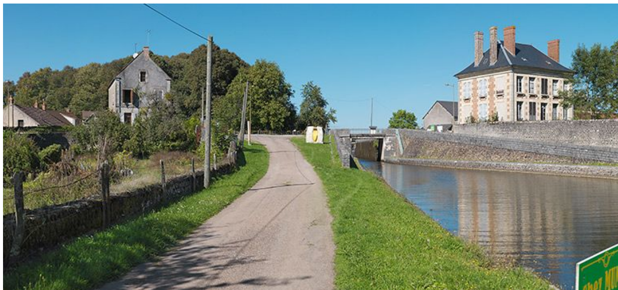
Vue d'ensemble : à gauche la maison éclésièrre (01L) et à droite la maison des ingénieurs. 58, Bazolles chemin de halage du canal du Nivernais, lieudit : Baye