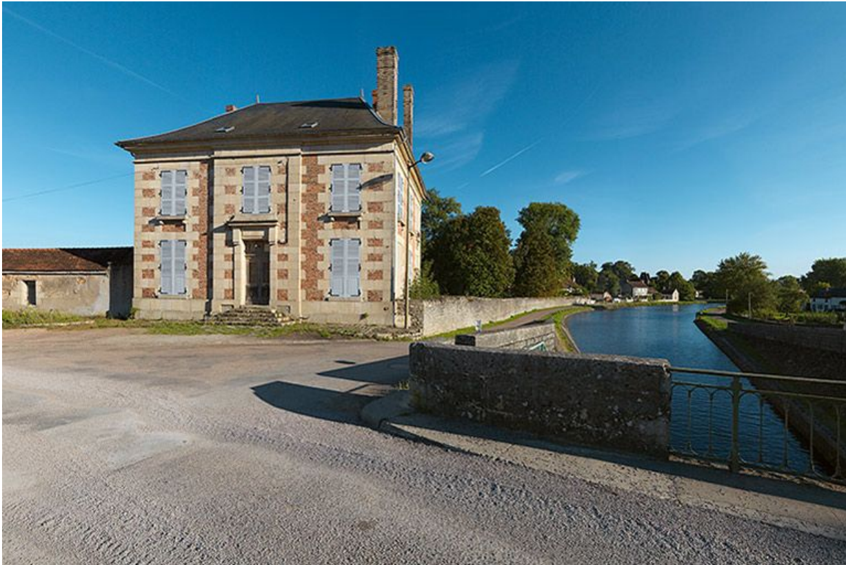
Vue de face. A droite le canal.

58, Bazolles chemin de halage du canal du Nivernais, lieudit : Baye