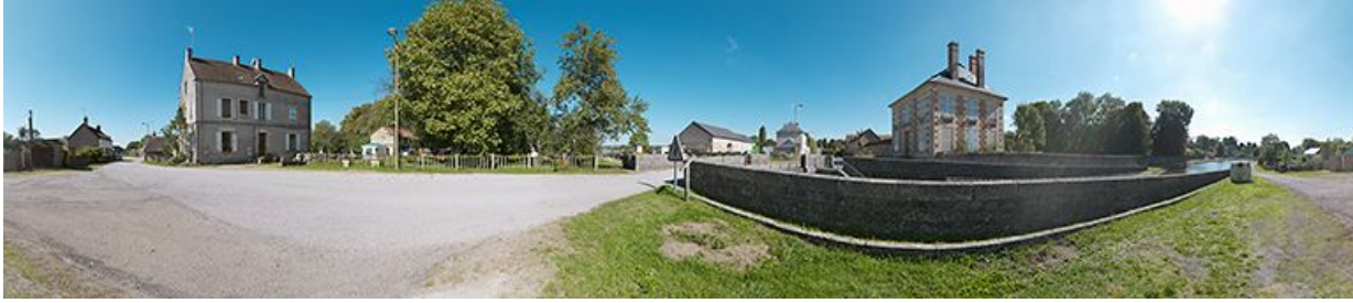
Panoramique avec de gauche à droite : la maison éclusière, le site d'écluse, le pont sur écluse et la maison des ingénieurs. 58, Bazolles, lieudit : bief 01 du versant Loire

N° de l'illustration : 20135800025NUC4AQ