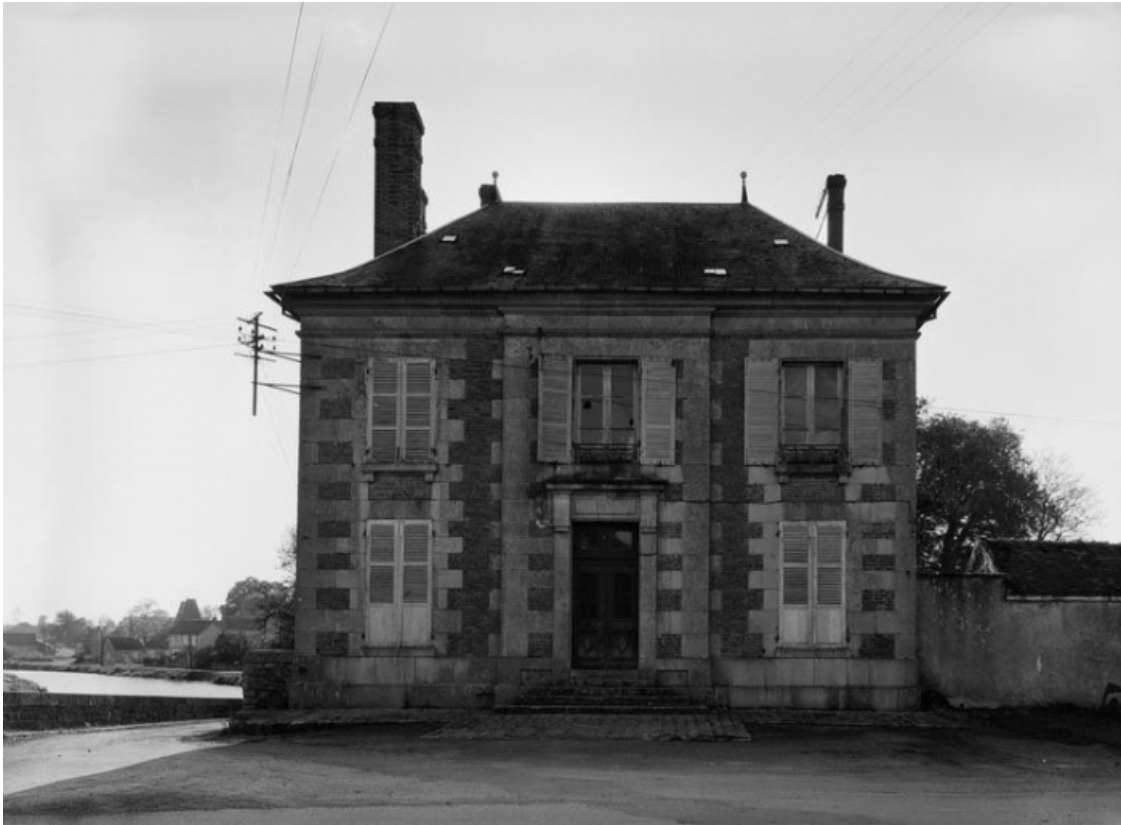
Vue de la façade principale.

58, Bazolles chemin de halage du canal du Nivernais, lieudit : Baye