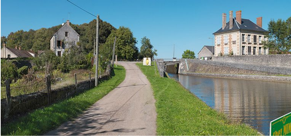
Vue d'ensemble : à gauche la maison éclésièr (01L) et à droite la maison des ingénieurs.

58, Bazolles chemin de halage du canal du Nivernais, lieudit : Baye