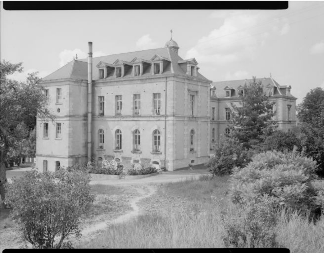
Elévation antérieure prise de trois-quarts.

58, Jean-Marie Thévenin Ville Château-Chinon