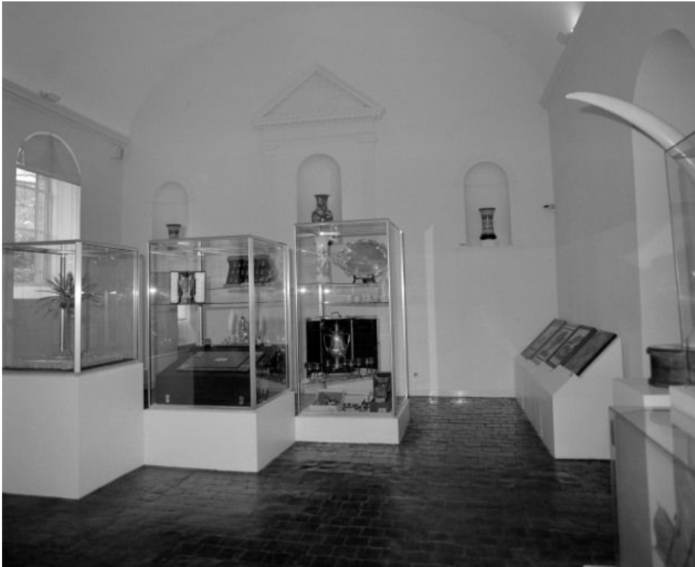
Vue d'ensemble de la salle au rez de chaussée.

58, Ville Château-Chinon, 6 rue du Château