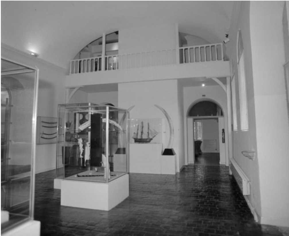
Vue d'ensemble de la salle au rez de chaussée.

58, Ville Château-Chinon, 6 rue du Château