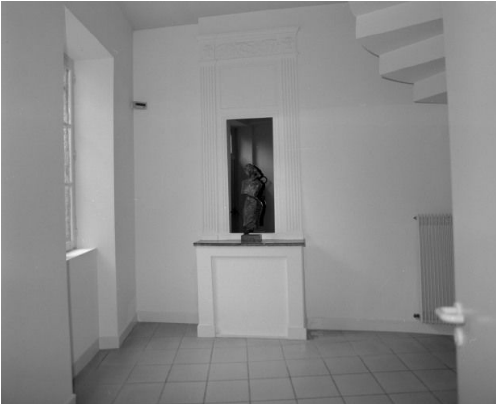
Vue d'ensemble d'une cheminée au rez de chaussée.

58, Ville Château-Chinon, 6 rue du Château