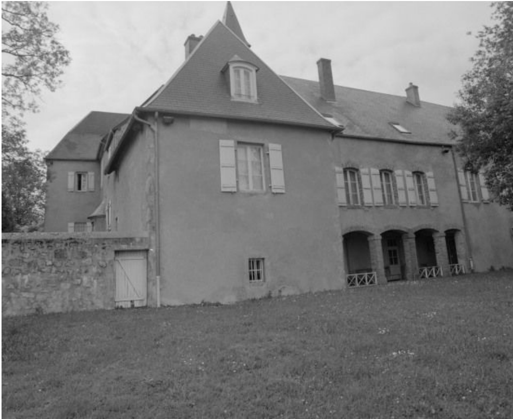
Vue d'ensemble de la façade postérieure.

58, Ville Château-Chinon, 6 rue du Château