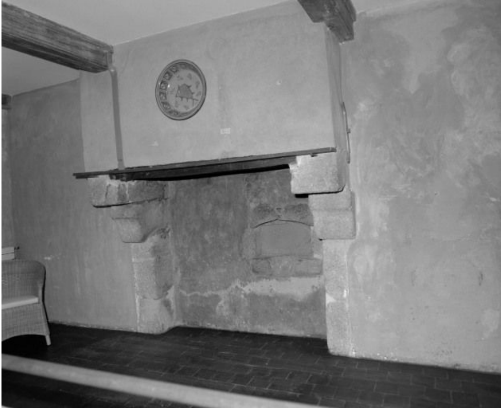
Vue d'ensemble d'une cheminée.

58, Ville Château-Chinon, 6 rue du Château