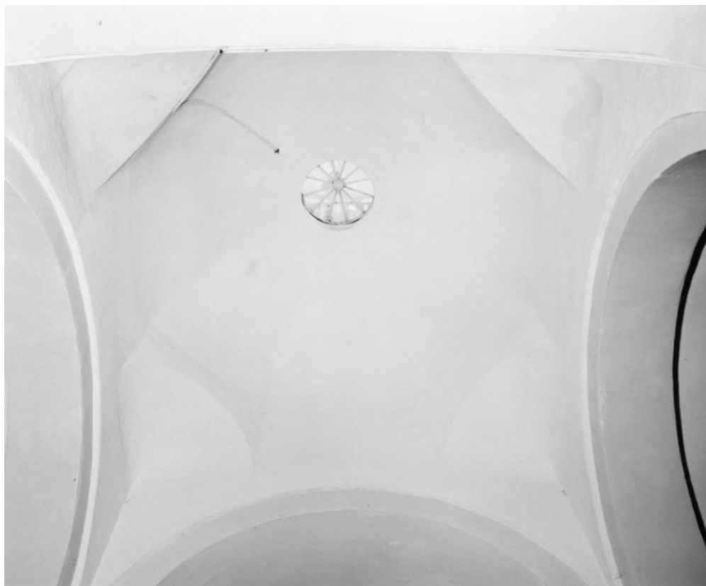
Détail de la voûte de la croisée du transept.