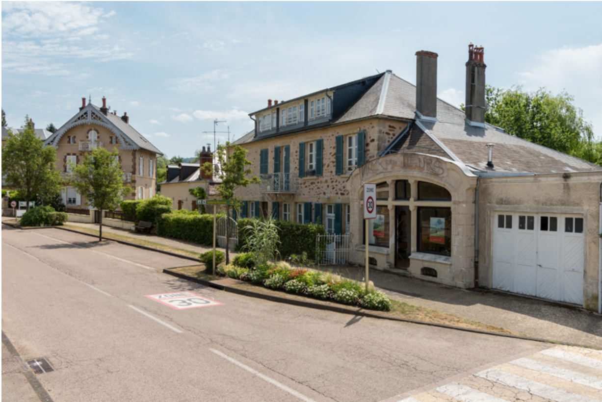
Façade actuelle sur la rue, vue de trois-quarts.

58, Saint-Honoré-les-Bains, 15-17 avenue Eugène Collin