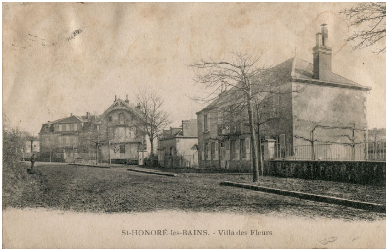
St-HONORÉ-les-BAINS. - Villa des Fleurs

Élévation depuis la rue avant la construction de la pharmacie.