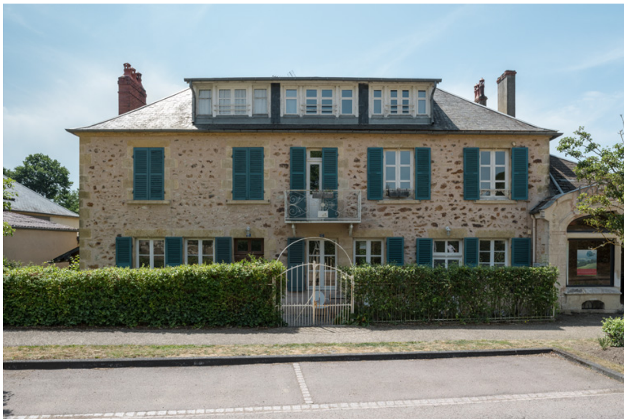
Façade actuelle sur l'avenue, vue de face.

58, Saint-Honoré-les-Bains, 15-17 avenue Eugène Collin