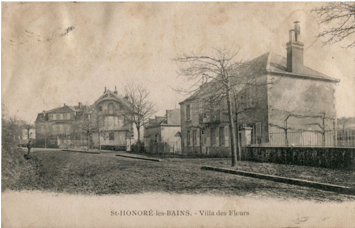
Élévation depuis la rue avant la construction de la pharmacie.

58, Saint-Honoré-les-Bains, 15-17 avenue Eugène Collin