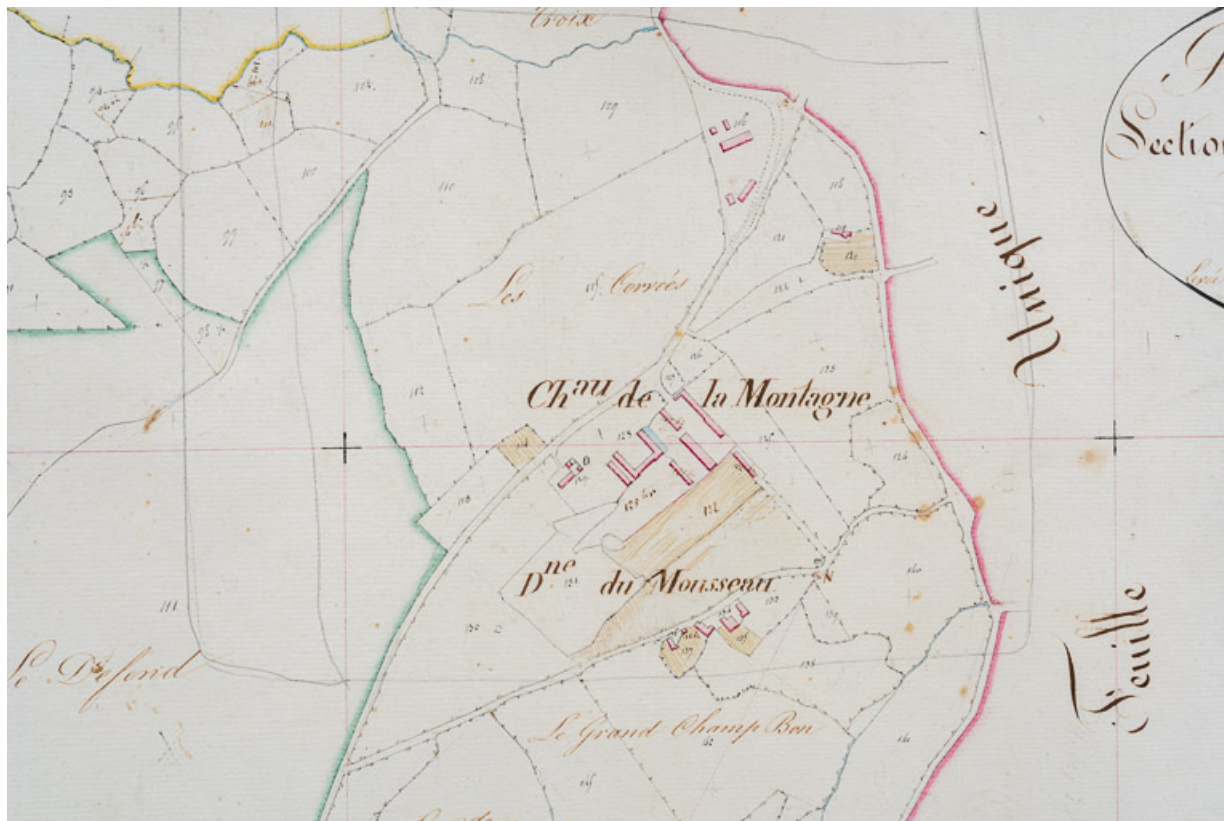
Situation du château et de ses dépendances dans le plan du cadastre ancien dit napoléonien (1832).

58, Saint-Honoré-les-Bains, lieudit : écart de La Montagne