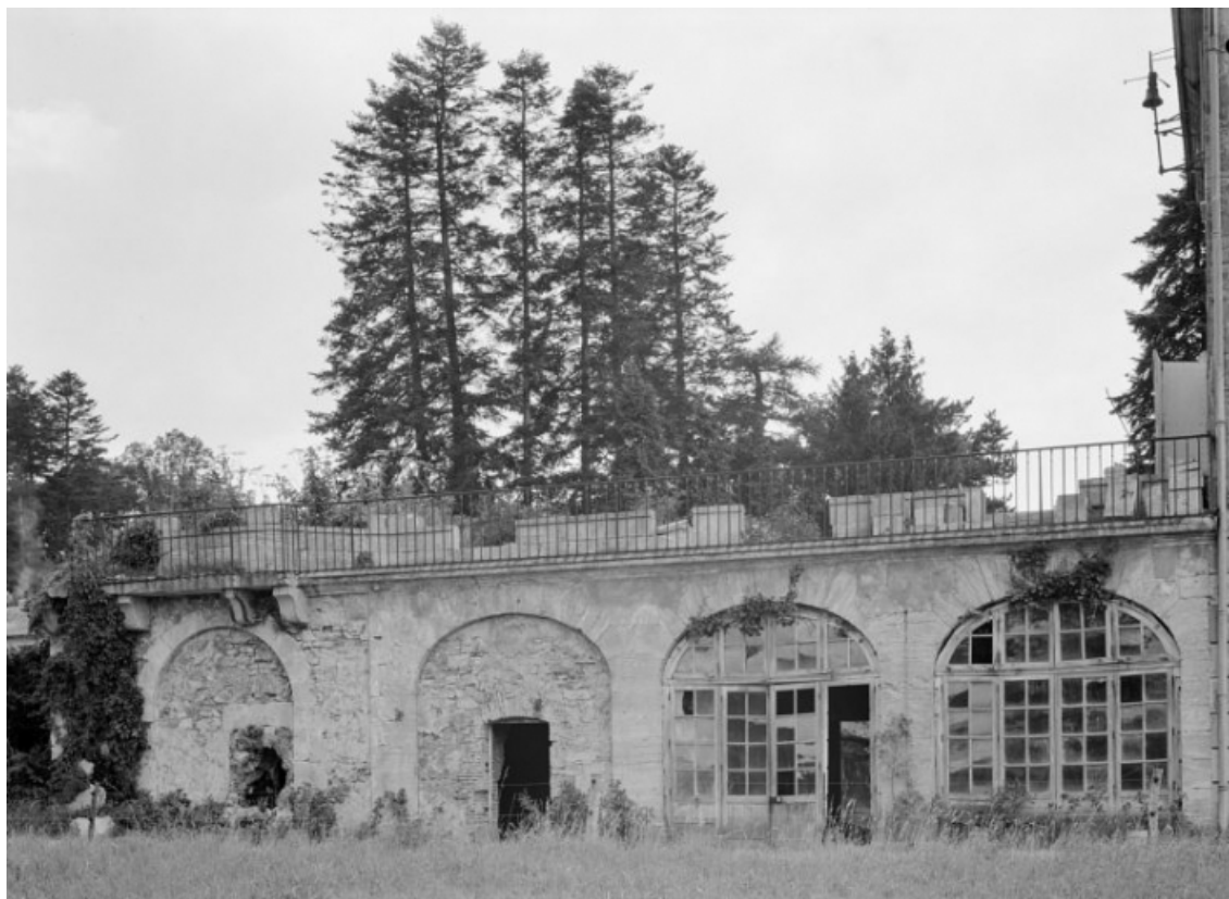
Façade sur le jardin de l'étage de soubassement de l'ancien jardin d'hiver (détruit), vue prise en 1977. 58, Saint-Honoré-les-Bains, lieudit : écart de La Montagne