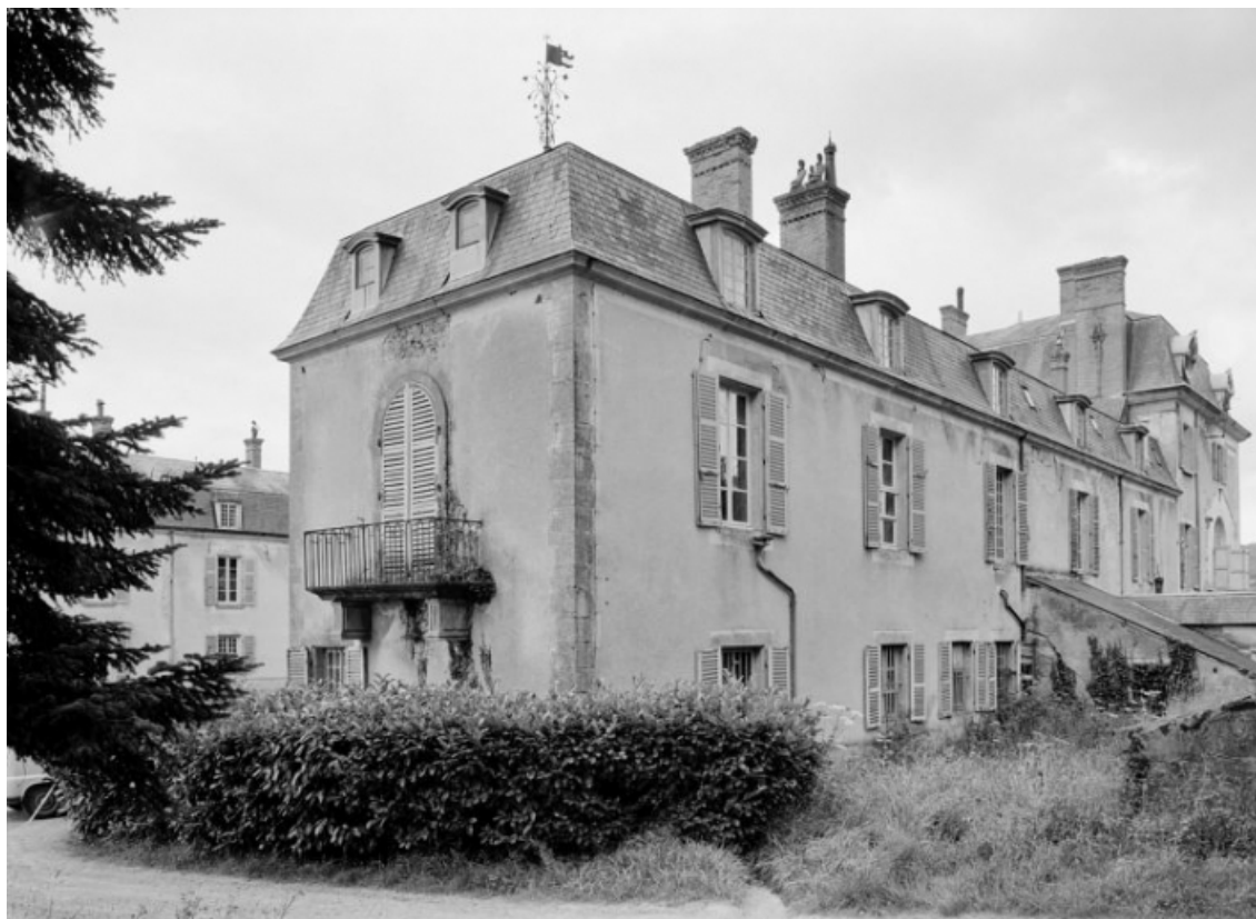
Façades nord et ouest de l'aile droite, vue de trois-quarts prise en 1977. 58, Saint-Honoré-les-Bains, lieu-dit : écart de La Montagne