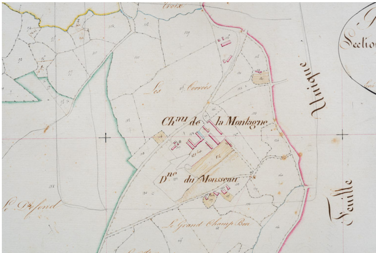
Situation du château et de ses dépendances dans le plan du cadastre ancien dit napoléonien (1832).

58, Saint-Honoré-les-Bains, lieudit : écart de La Montagne