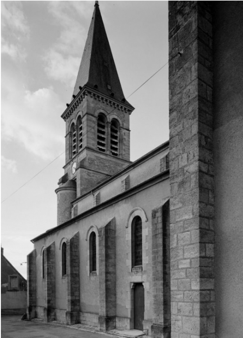
Élévation latérale droite.

58, Saint-Honoré-les-Bains rue de l' Église