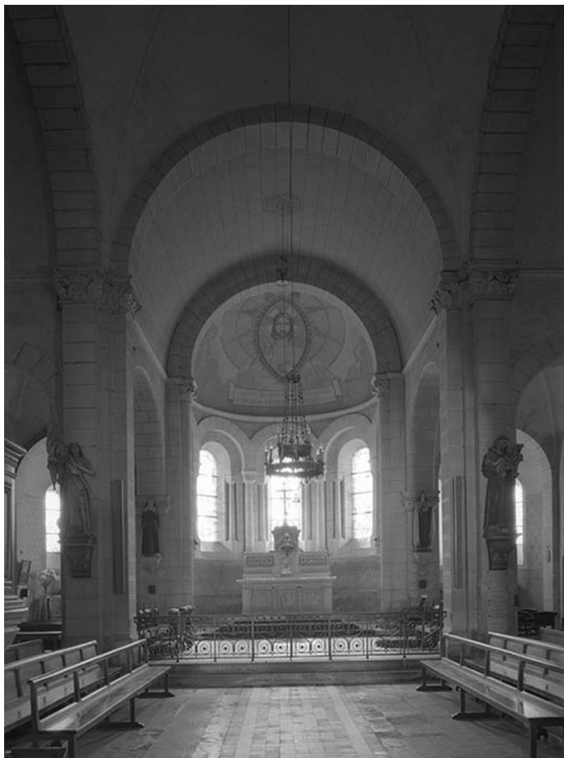
Chœur : vue d'ensemble depuis le transept.

58, Saint-Honoré-les-Bains rue de l' Église