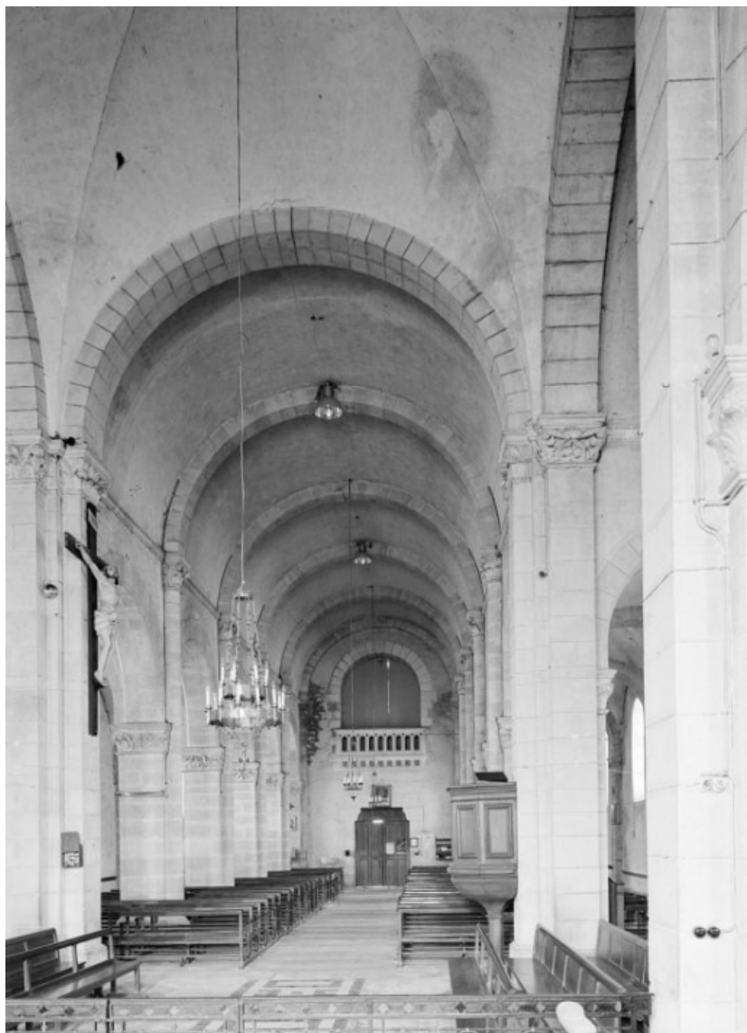
Vaisseau central de la nef : vue d'ensemble depuis le chœur.

58, Saint-Honoré-les-Bains rue de l'Église