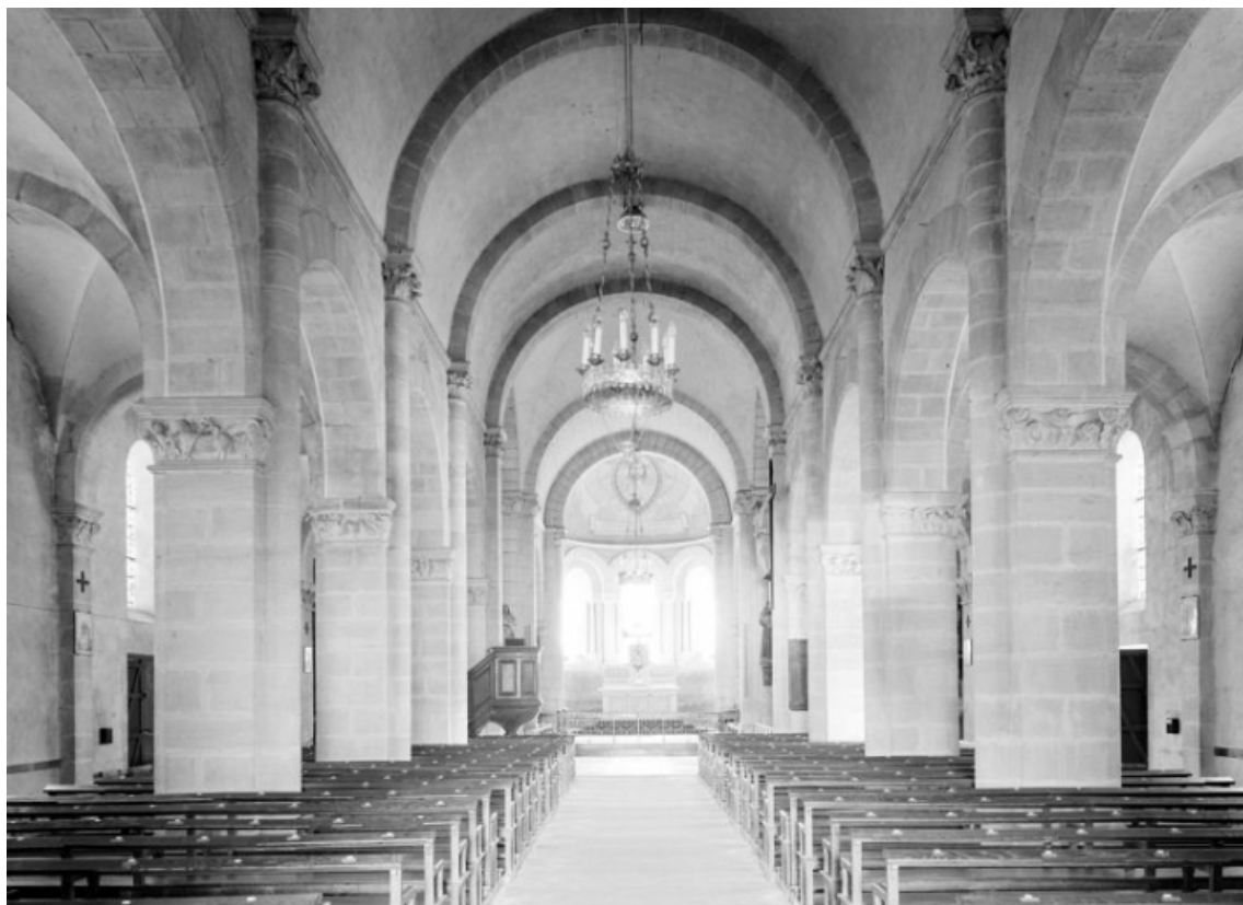
Nef et chœur : vue d'ensemble depuis l'entrée.

58, Saint-Honoré-les-Bains rue de l'Église