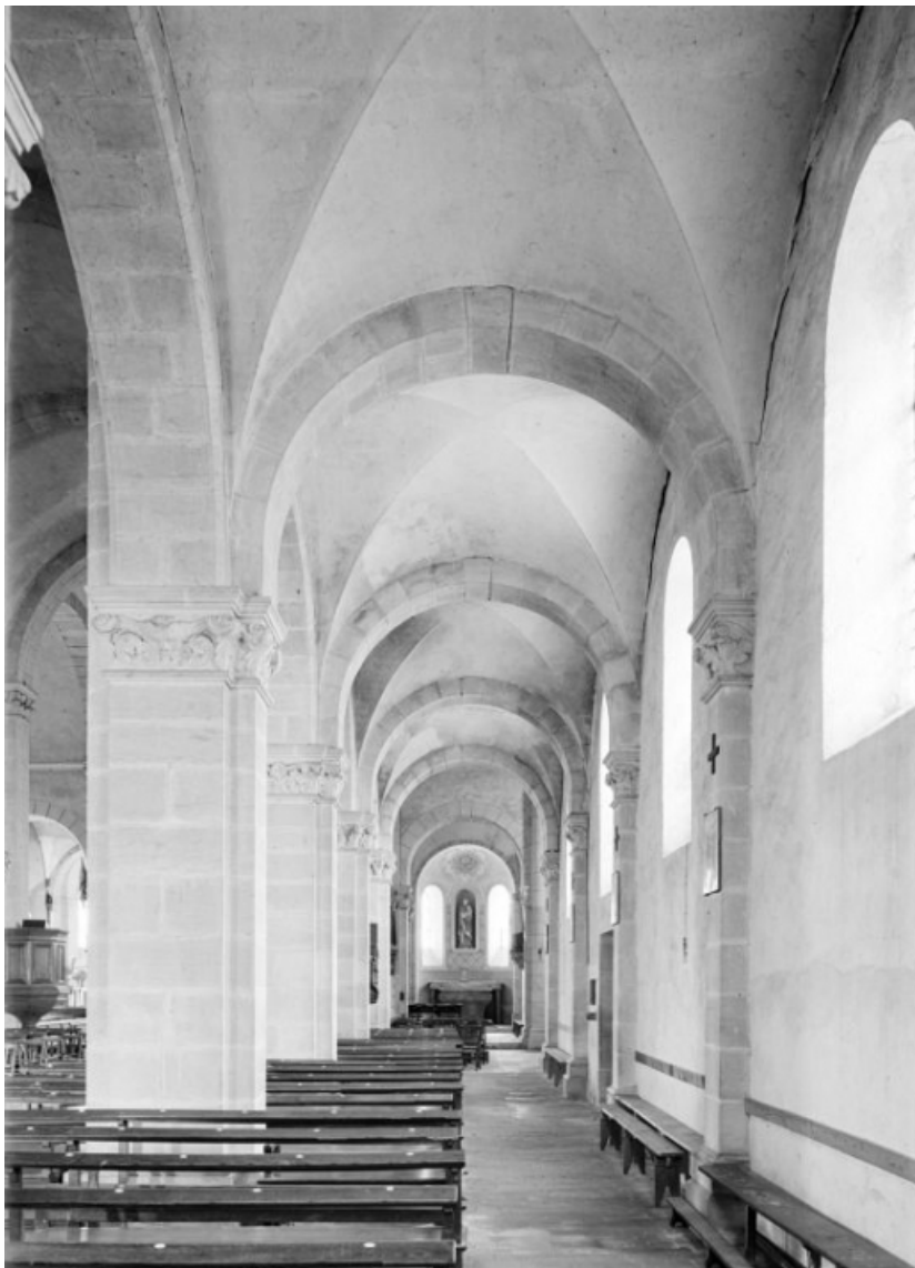
Bas-côté droit : vue d'ensemble depuis les fonts baptismaux.

58, Saint-Honoré-les-Bains rue de l'Église