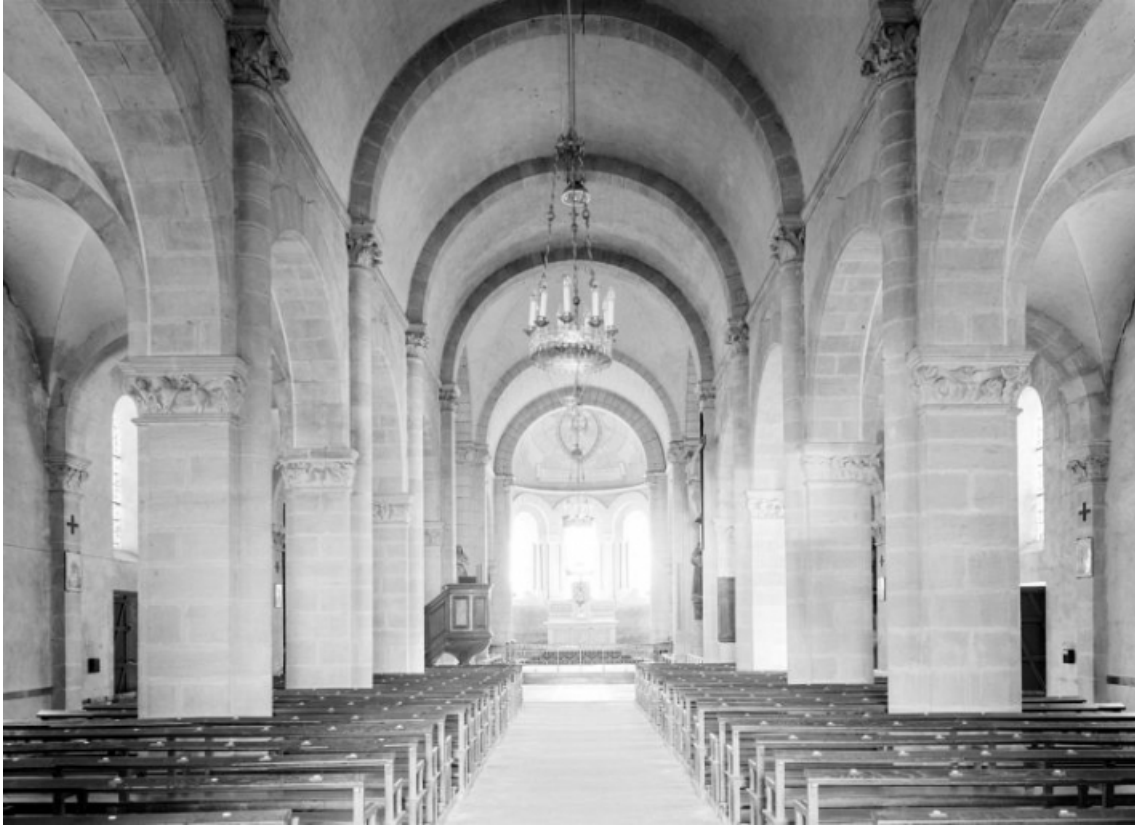
Nef et chœur : vue d'ensemble depuis l'entrée.

58, Saint-Honoré-les-Bains rue de l' Église