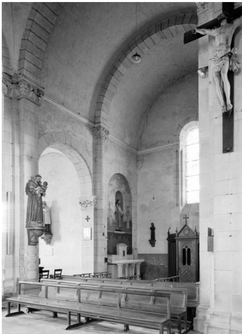
Transept, bras droit : vue prise de trois-quarts droit. 58, Saint-Honoré-les-Bains rue de l'Église