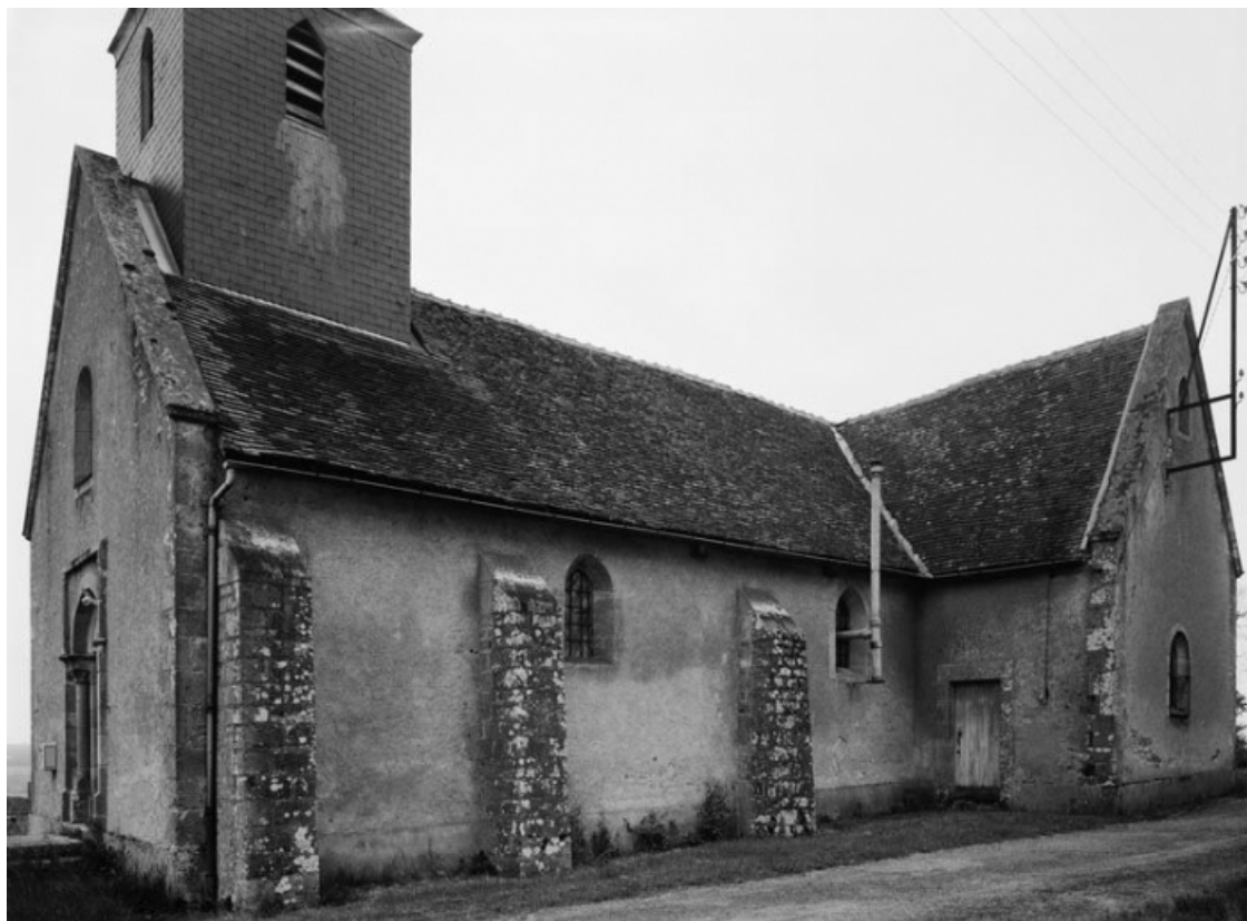
Élévation latérale gauche.