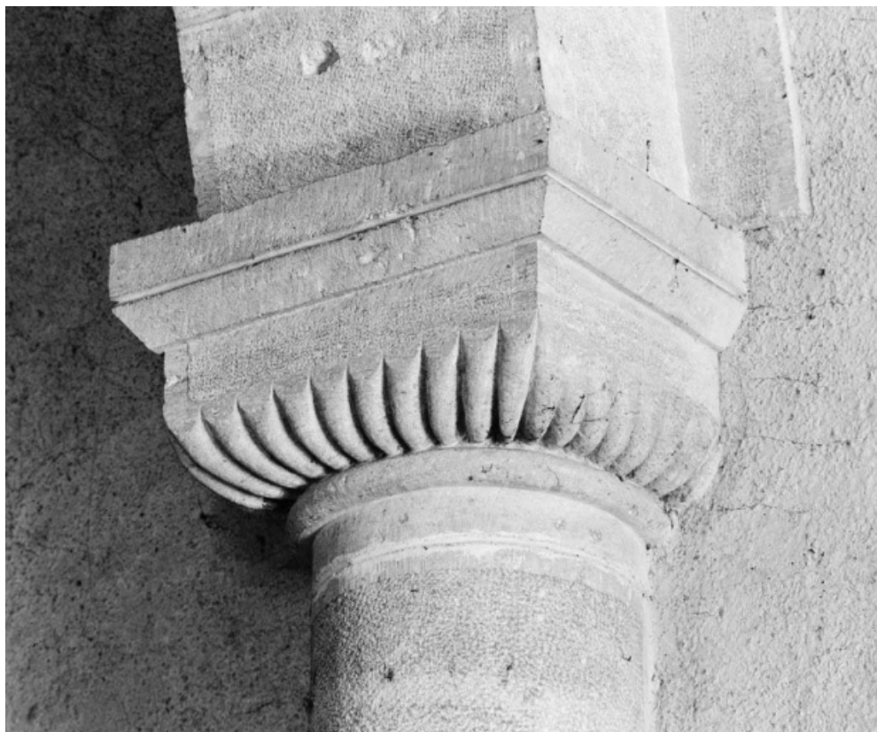
Détail du chapiteau de la deuxième colonne de droite de la nef. 58, Isenay