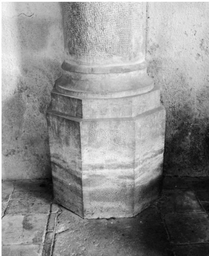
Base de la colonne antérieure droite de la nef.