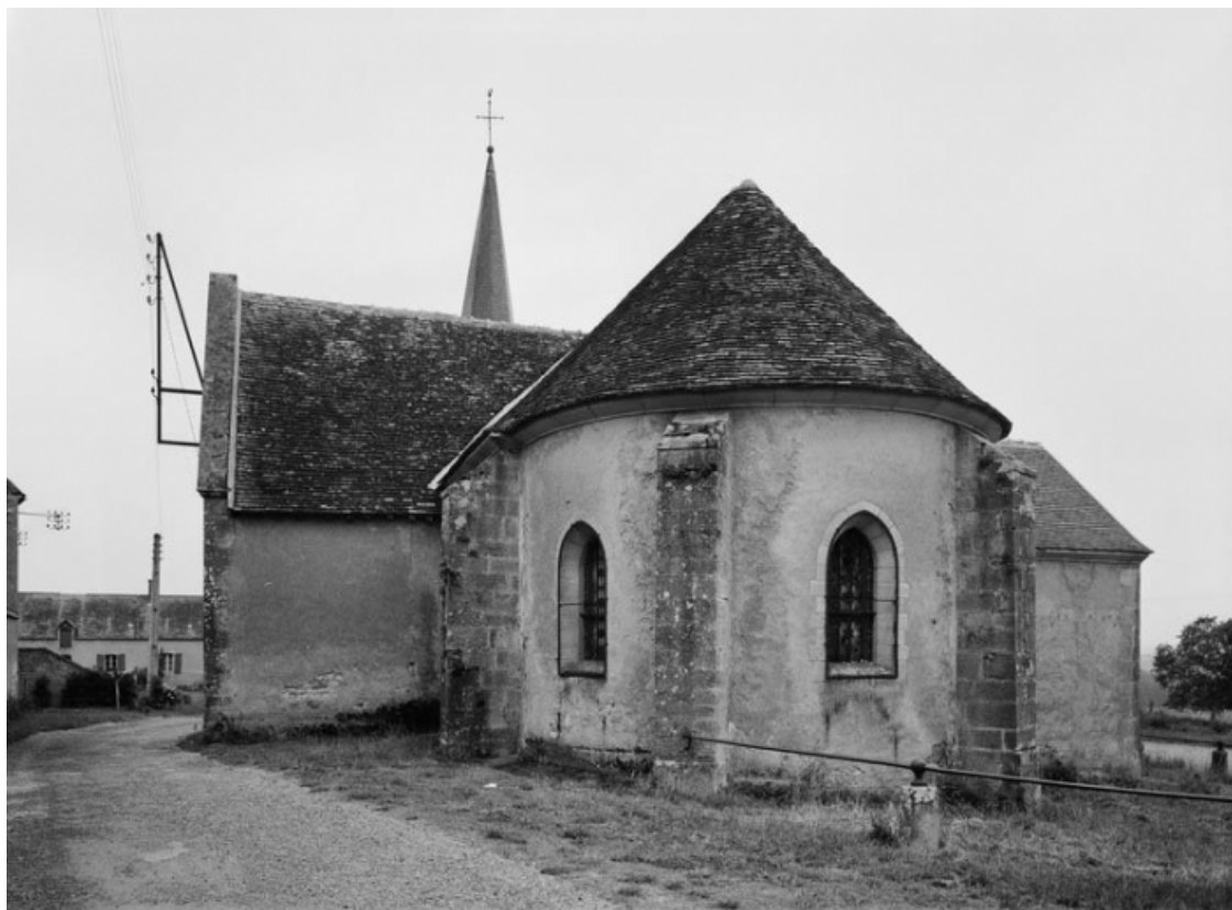
Chevet. 58, Isenay