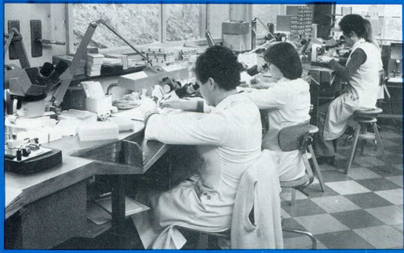
▲ contrôle optique