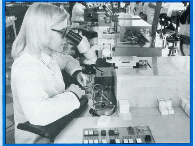
▲ soudage laser