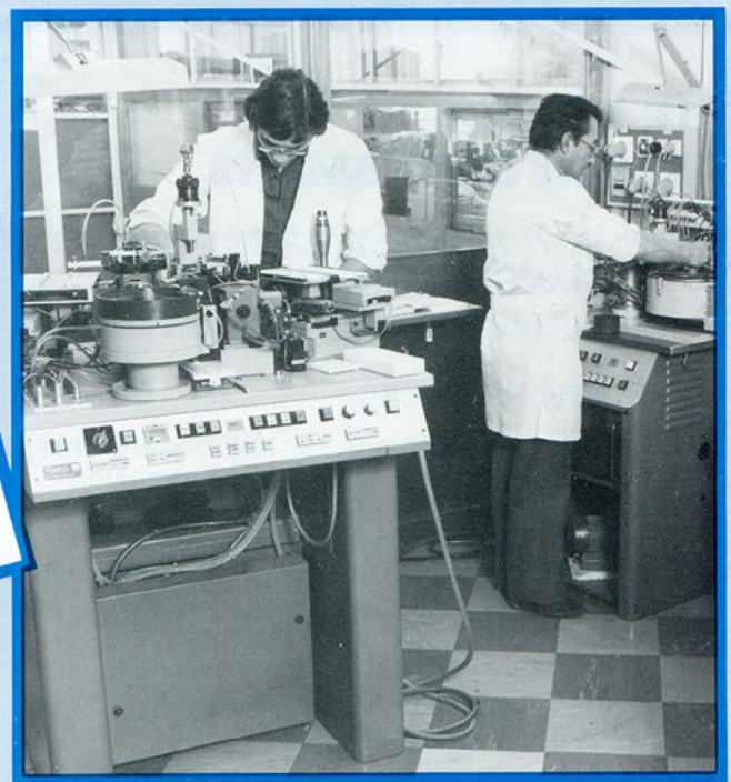
▲ micro-assemblage par automate