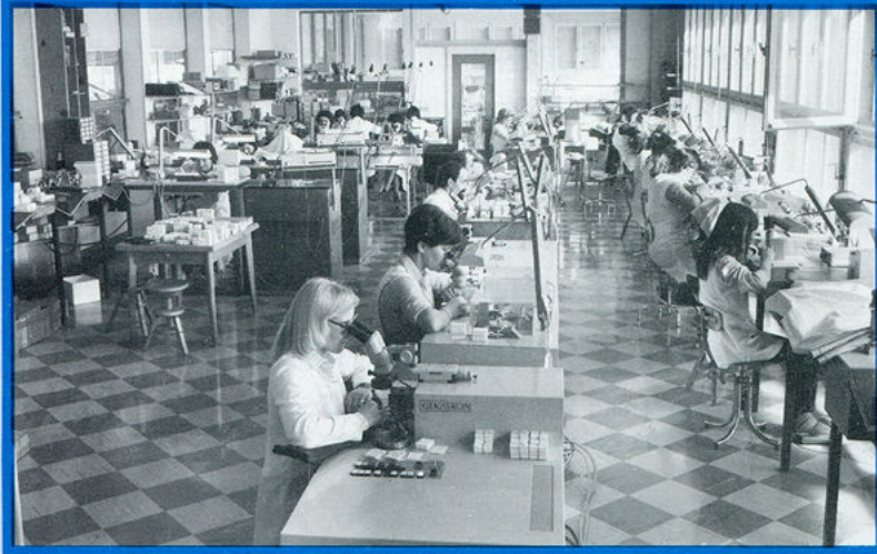
▲ vue partielle de l'atelier de micro-assemblage