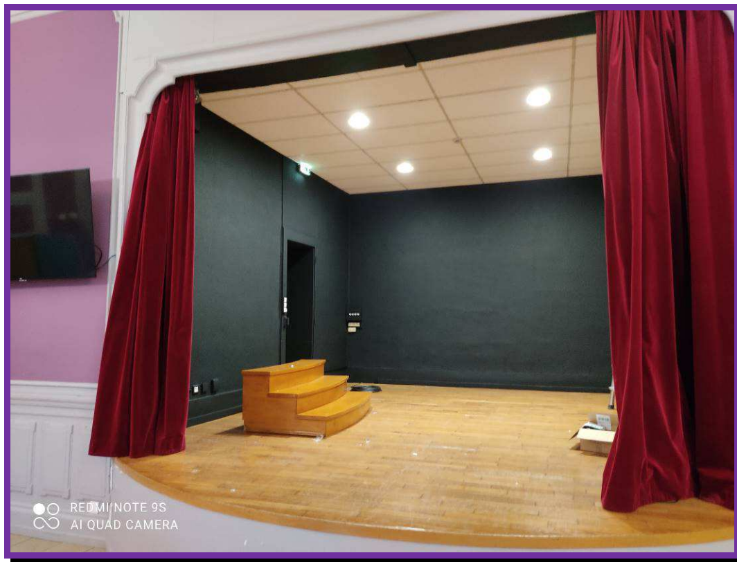
La scène, environ 22m 2

Profondeur : 5.77 jusqu'à l'arrondi. Longueur : 4.84 Largeur : 4.33 Hauteur : 0.70m scène