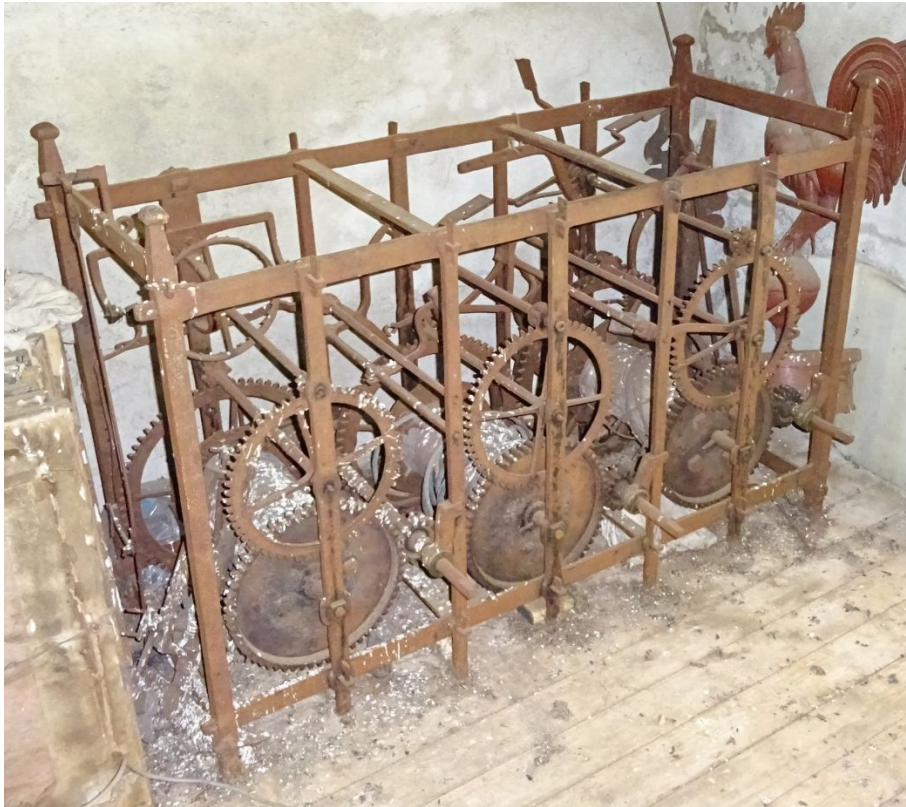
Septmoncel : avec trois tambours sur lesquels s'enroulent les câbles des poids.