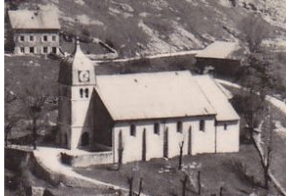
L'église de Septmoncel vers 1960. Cadran unique, coté village.