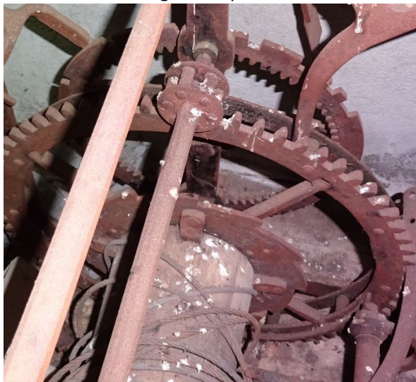
Horloge de Septmoncel