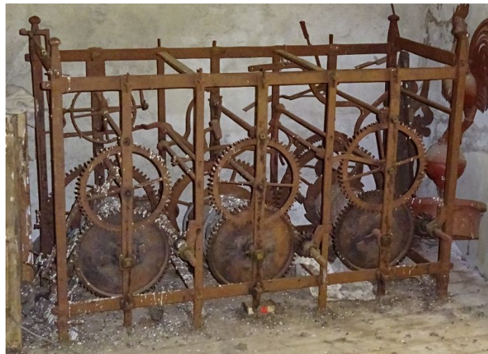
Horloge « 1718 »

Curieusement, ces mécanismes sont situés à l'étage le plus élevé du clocher, au-dessus du niveau qui abrite les cloches.