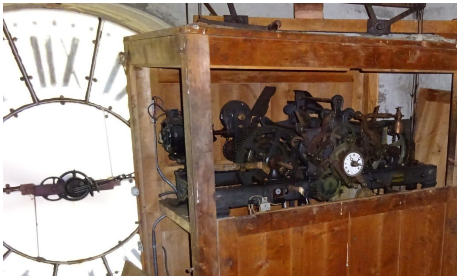
Horloge Terrailon dans son meuble en bois.

Cette horloge est située à proximité du cadran extérieur et comporte une plaque de l'entreprise Terrailon.