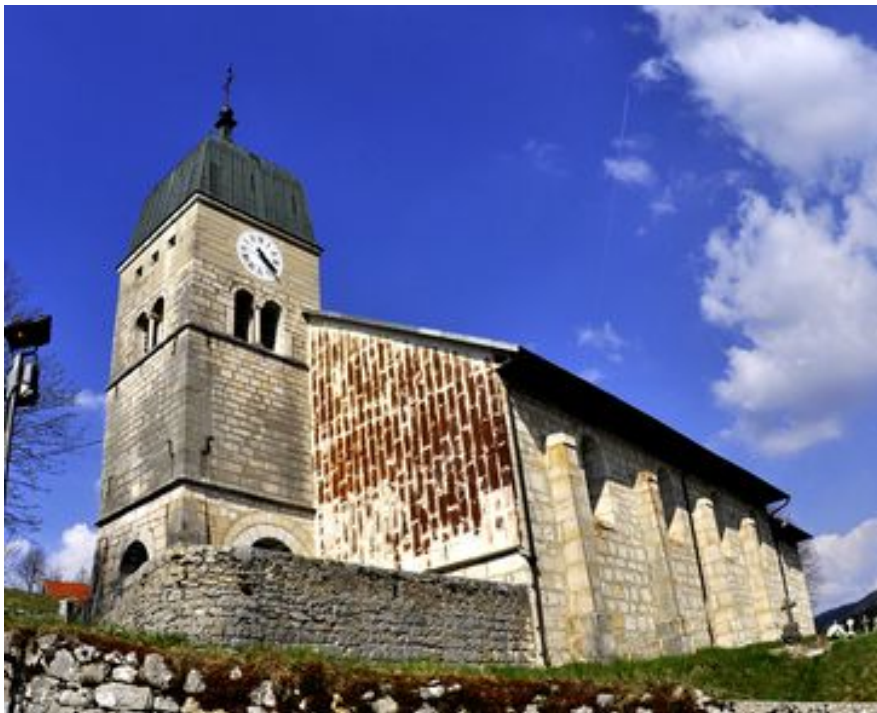
L'église de Septmoncel actuellement. La surélévation de 1970 est bien visible.