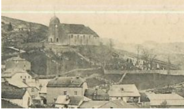
L'église de Septmoncel vers 1900.

Il est possible que le changement de l'horloge en 1936 et la transformation du clocher en 1970 aient fait disparaître des inscriptions correspondant à 1718.