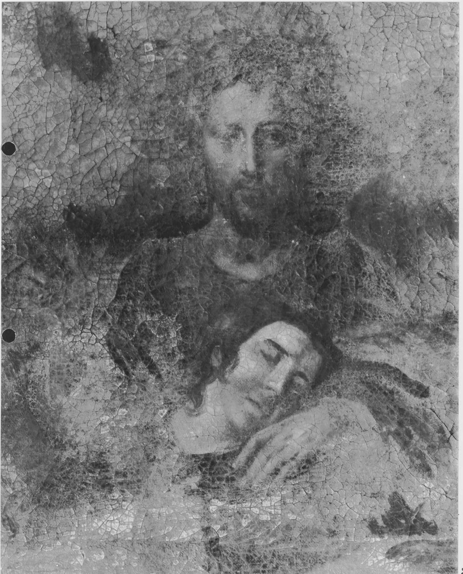
TABLEAU : la Cène Détail des visages du Christ et de Saint Jean