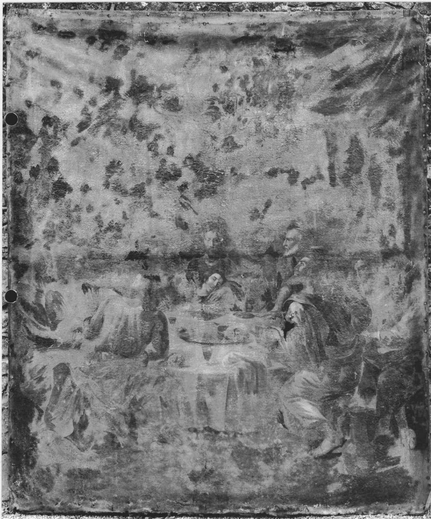
TABLEAU : la Cène