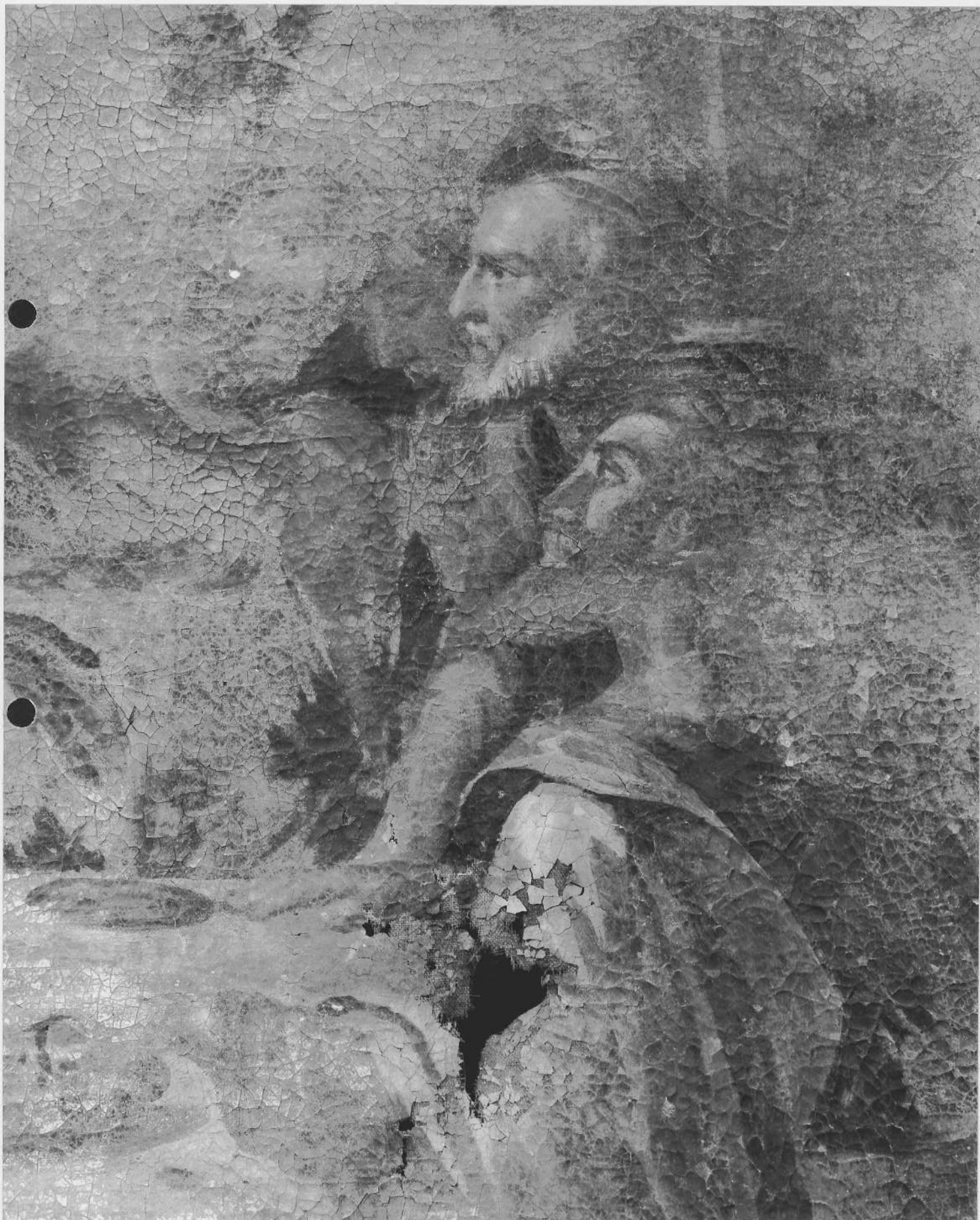
TABLEAU : la Cène détail des visages des apôtres à la gauche du Christ