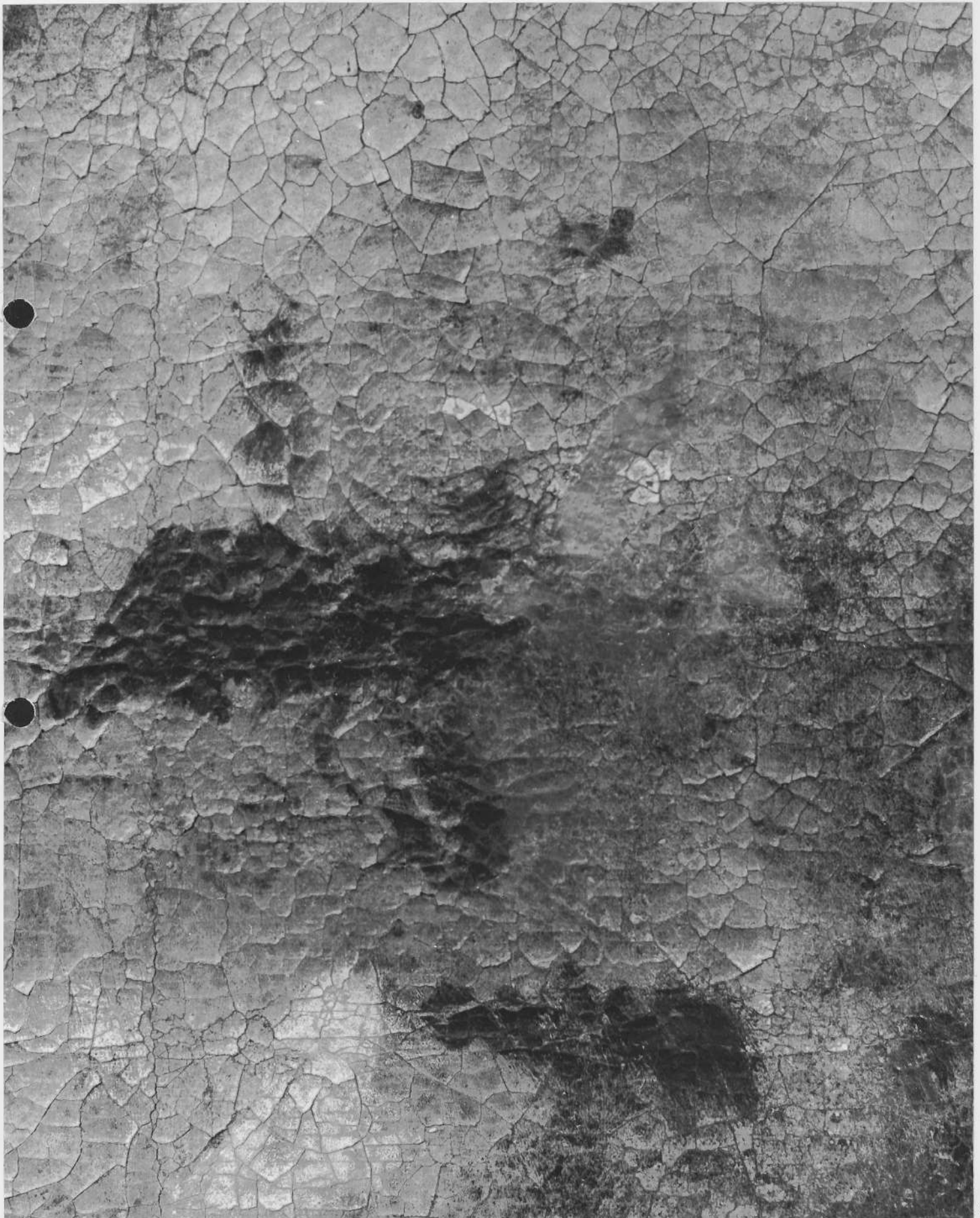
TABLEAU : la Cène Détail du visage d'un apôtre à la droite du Christ