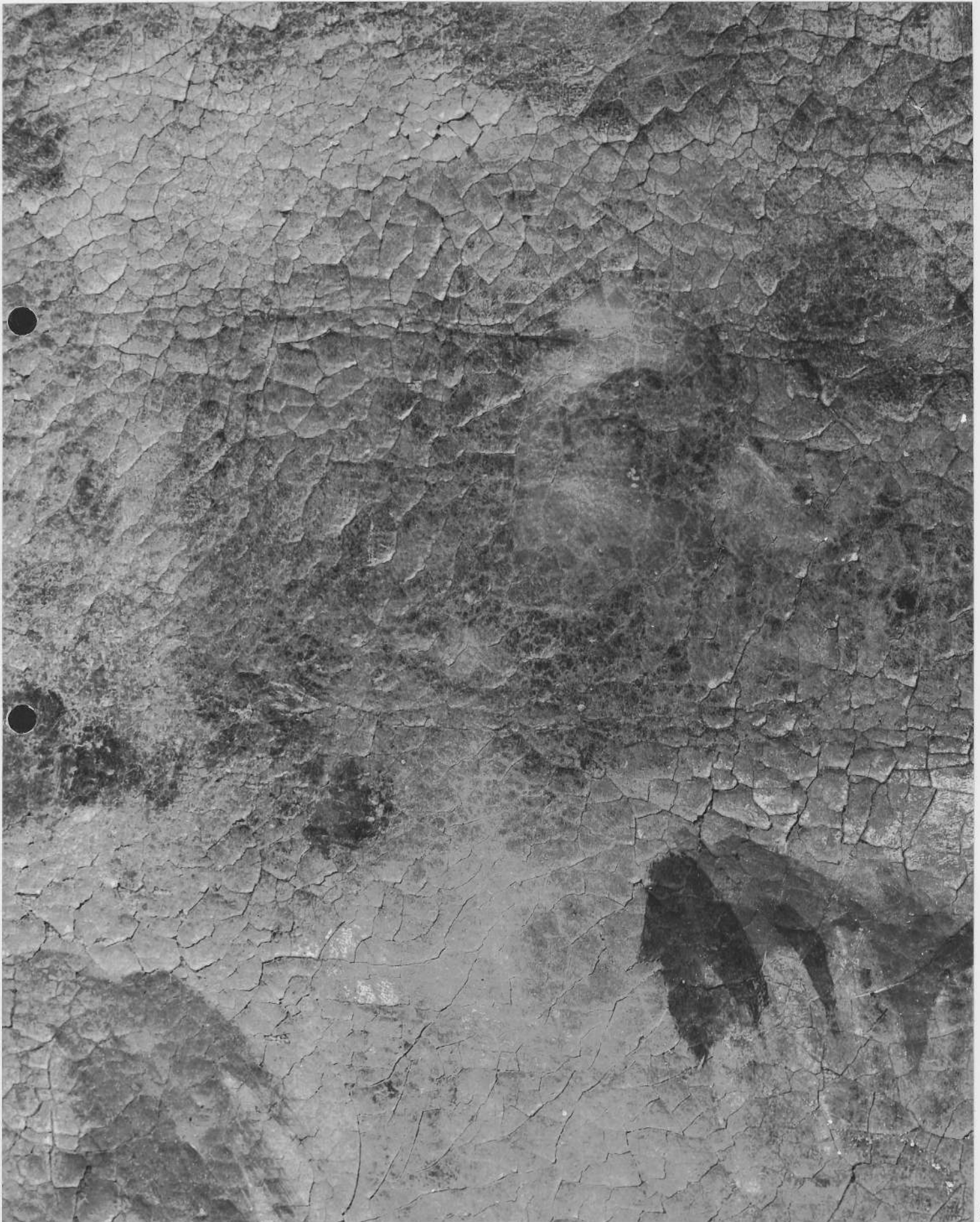
TABLEAU : la Cène (détails) détail du visage d'un apôtre à gauche du tableau