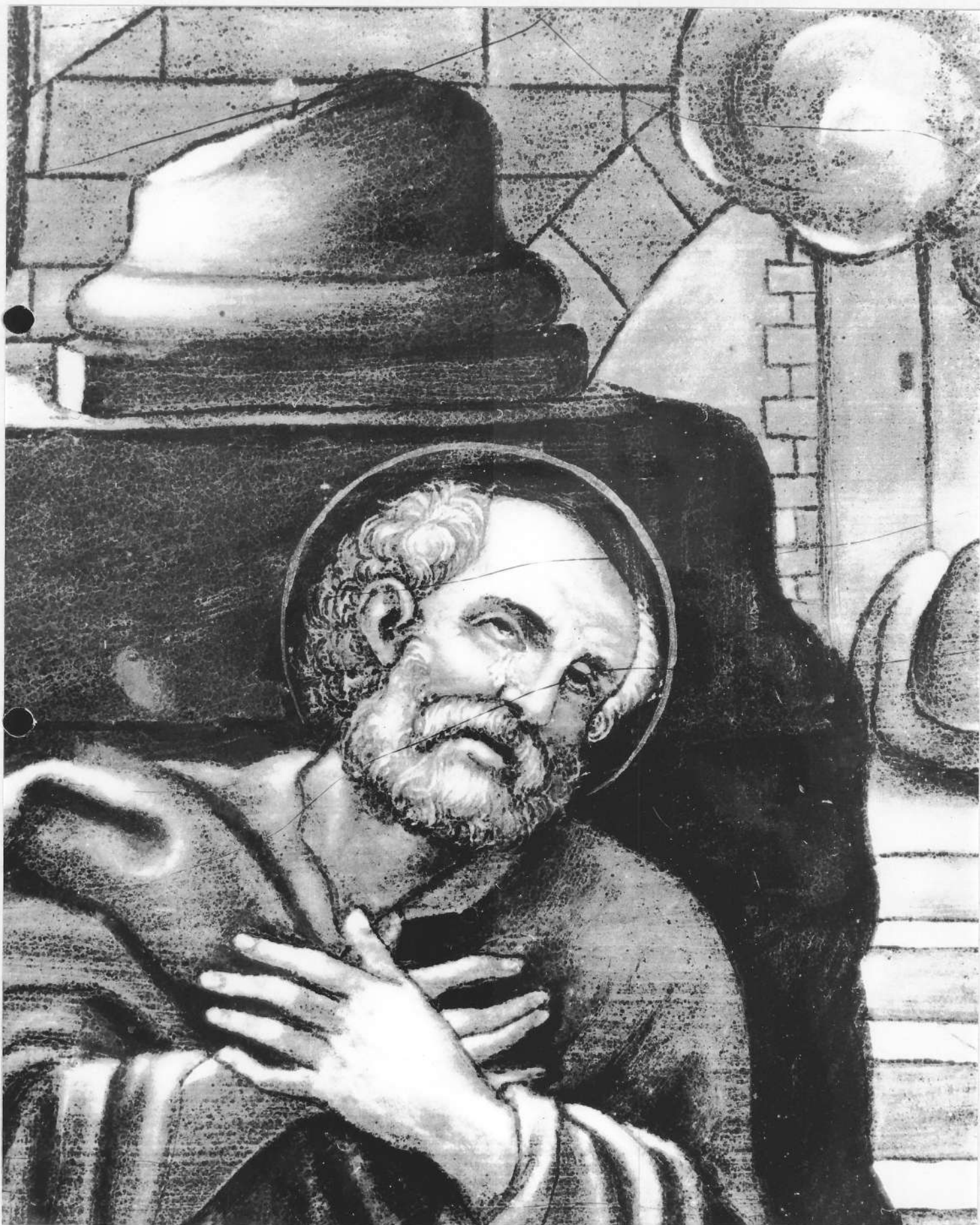
TABLEAU : repentir de Saint Pierre détail du tableau