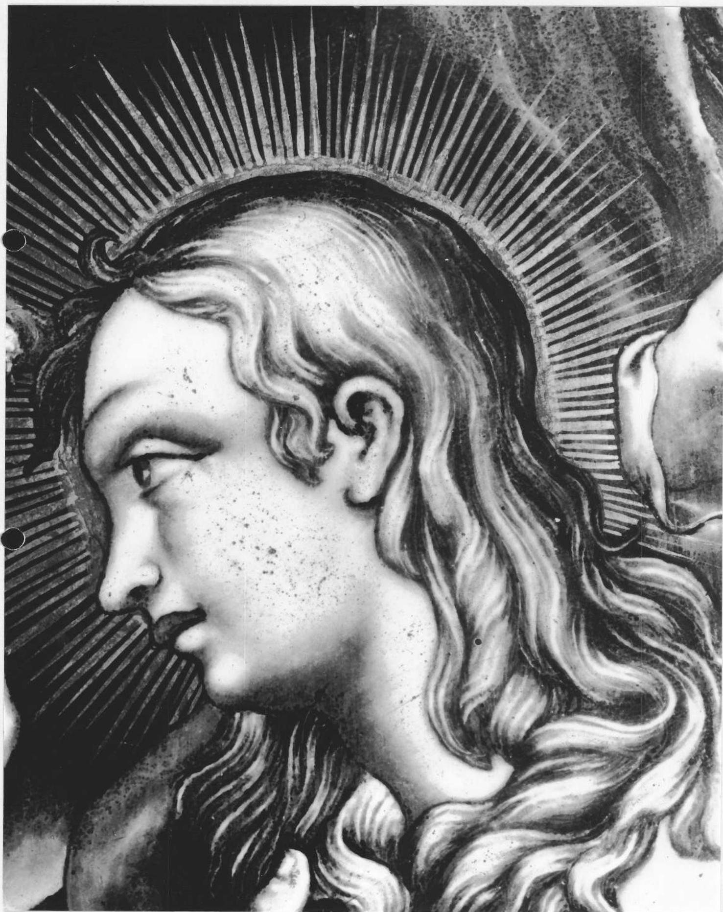
TABLEAU : Sainte Madeleine détail de la tête