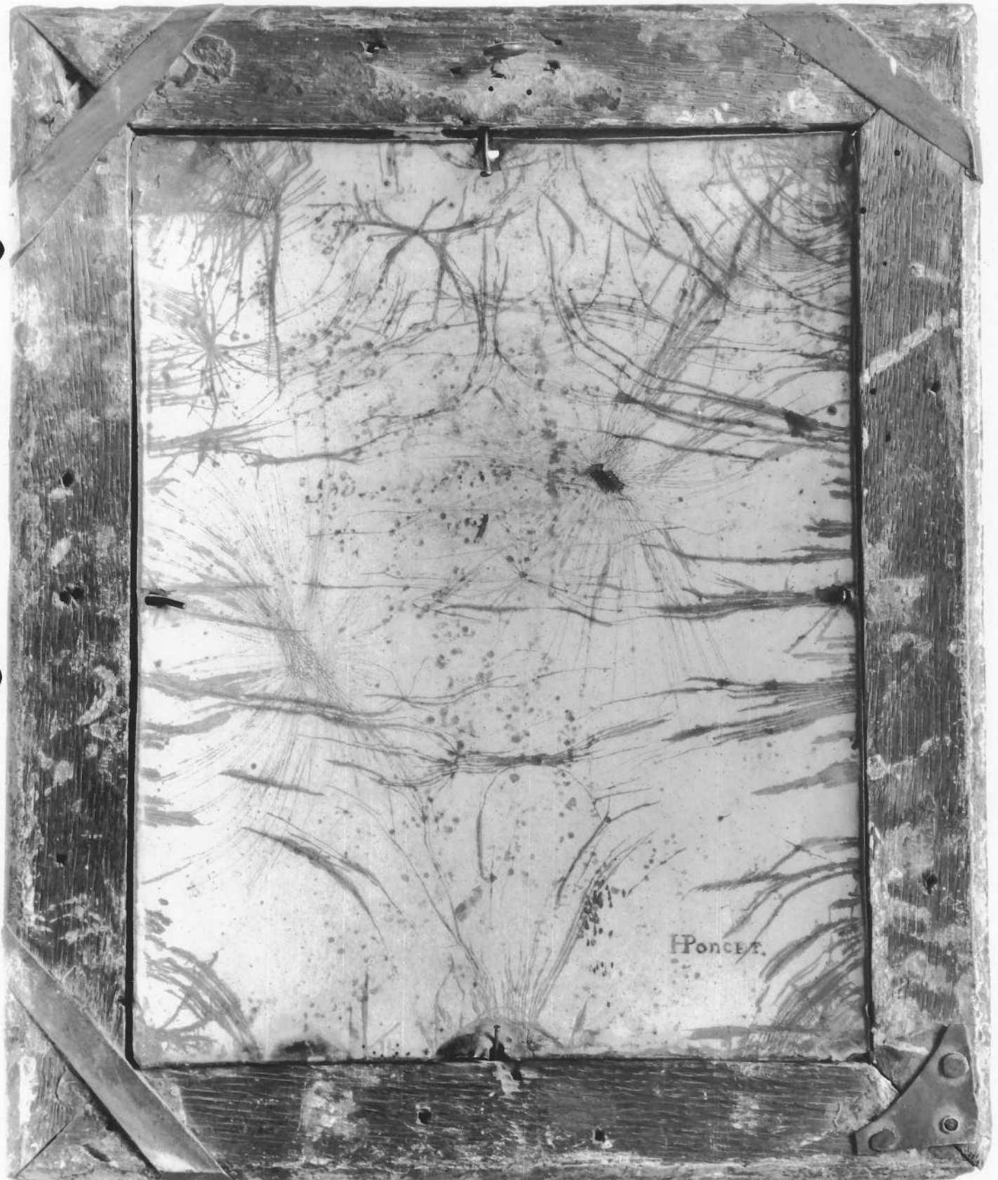
TABLEAU : repentir de Saint Pierre revers