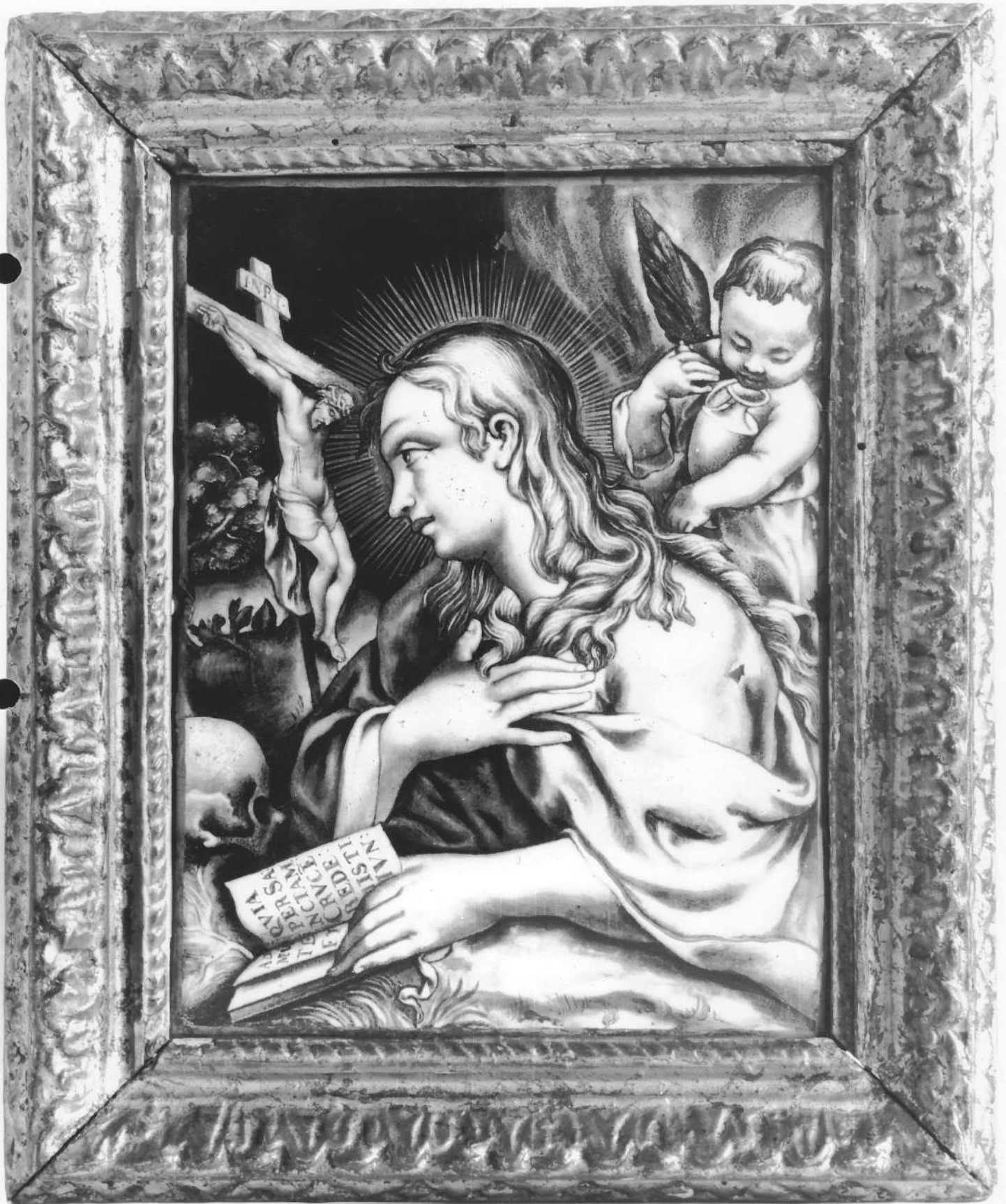
TABLEAU : Sainte Madeleine