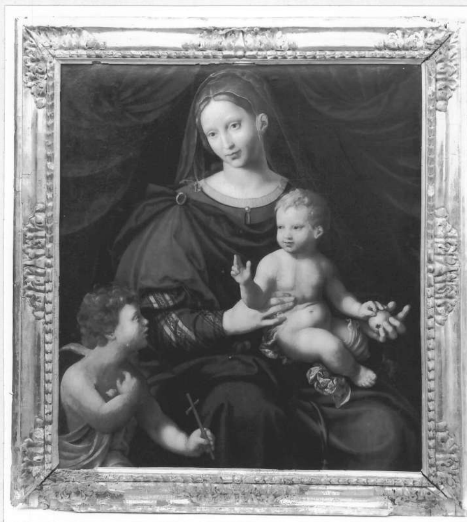
TABLEAU : Vierge à l'Enfant et Saint Jean-Baptiste