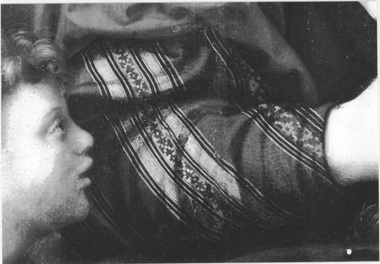
TABLEAU : Vierge à l'Enfant et Saint Jean-Baptiste détail du vêtement de la Vierge