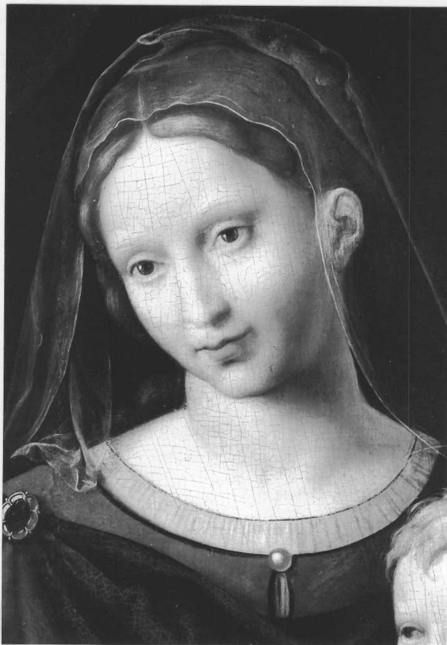
TABLEAU : Vierge à l'Enfant et Saint Jean-Baptiste détail : tête de la Vierge