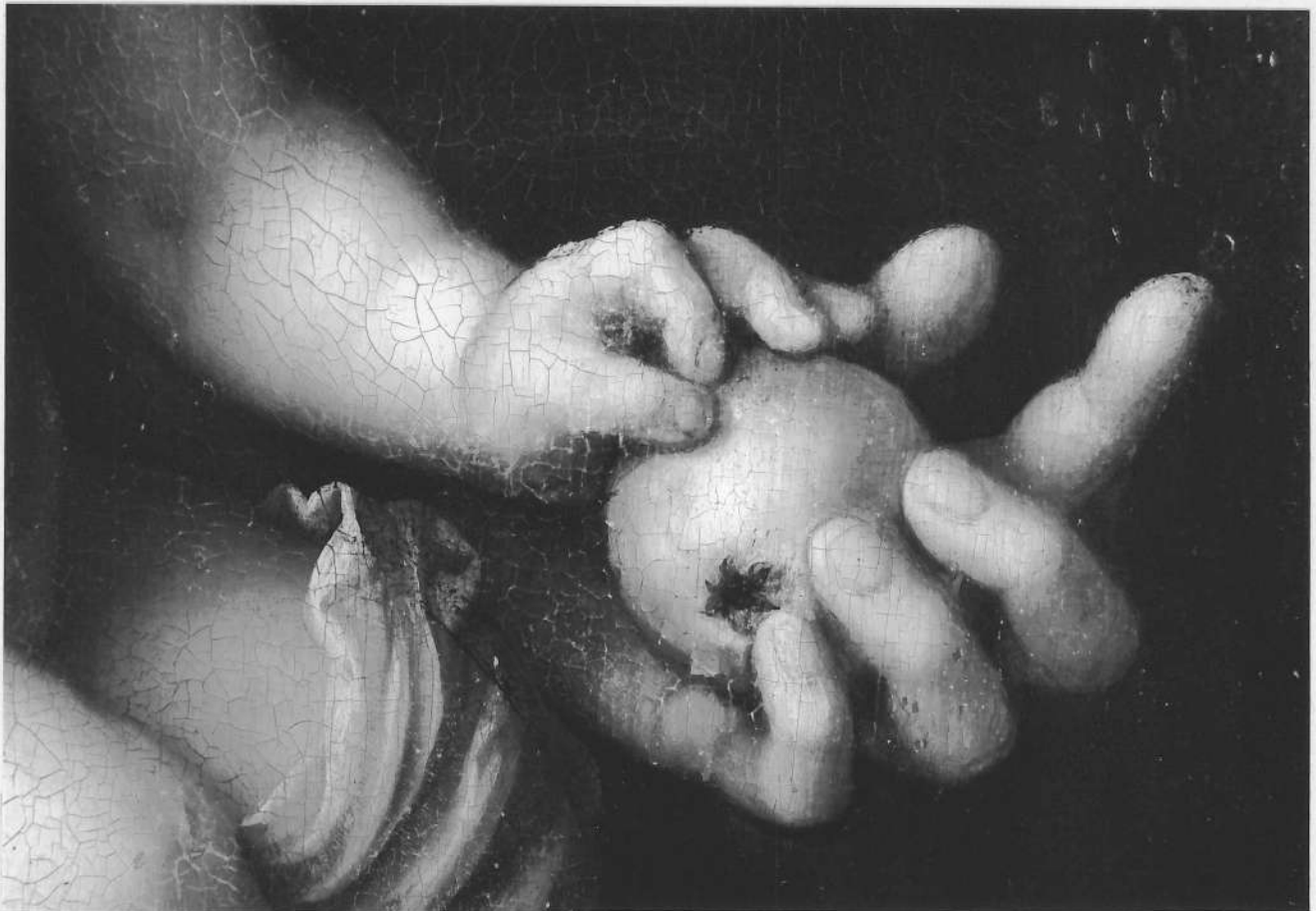
TABLEAU : Vierge à l'Enfant et Saint Jean-Baptiste détail : mains de la Vierge et de l'Enfant