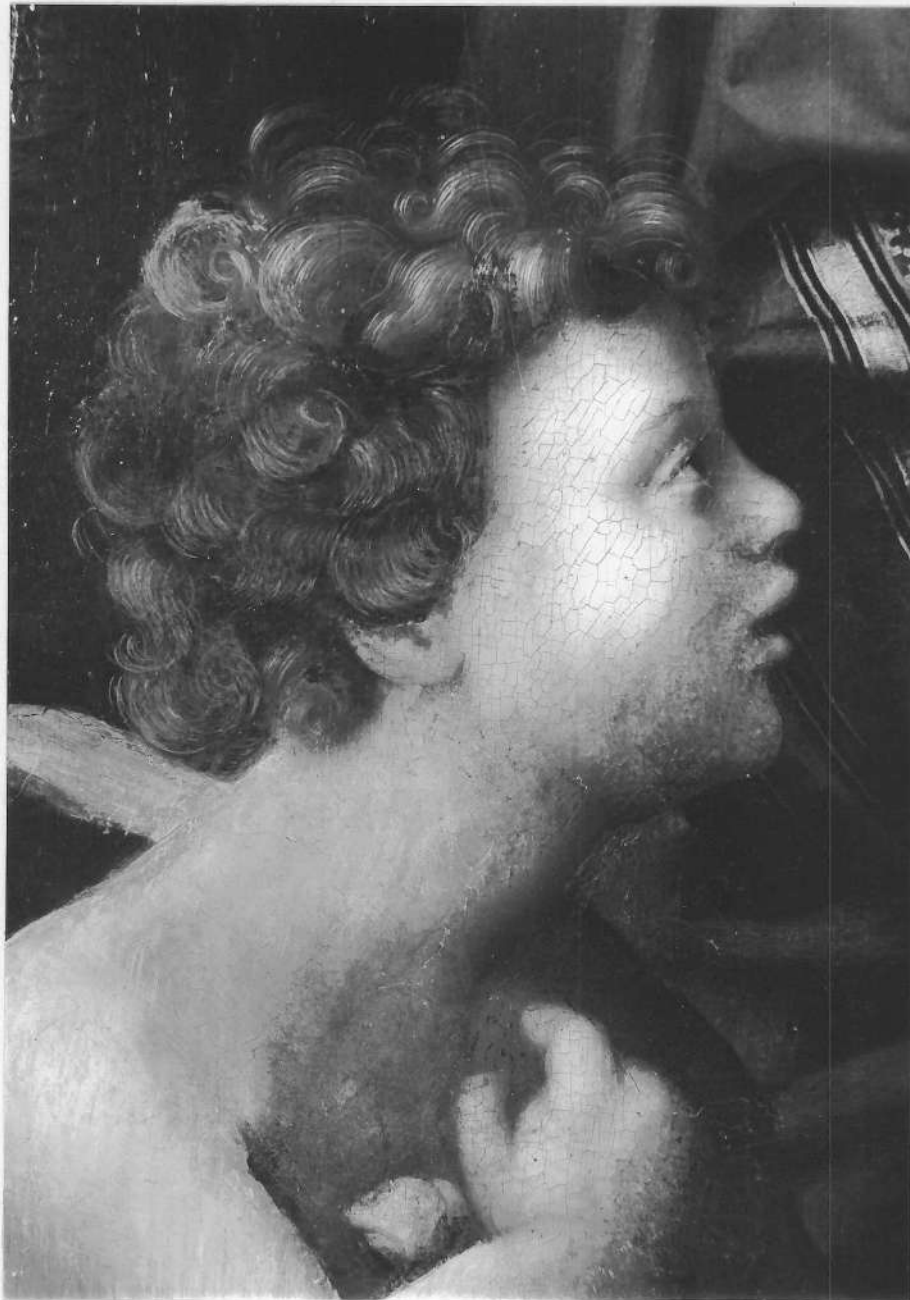
TABLEAU : Vierge à l'Enfant et Saint Jean-Baptiste détail : tête de saint Jean-Baptiste