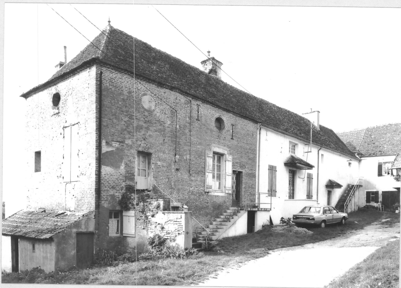
Fig. 1: Le bâtiment d'habitation, vue de trois-quarts gauche.