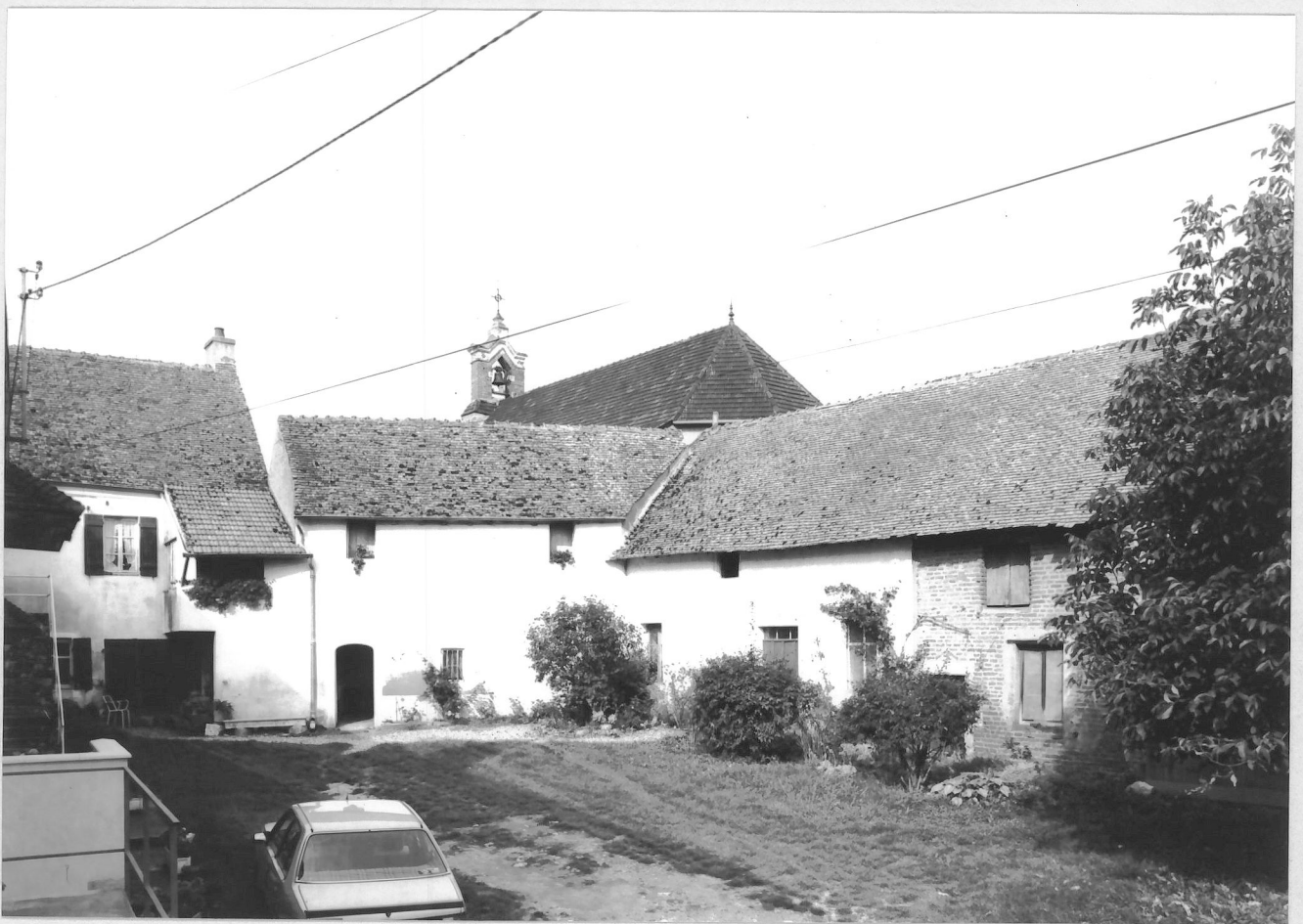
Fig. 2: Les bâtiments situés à l'arrière et à droite de la cour.