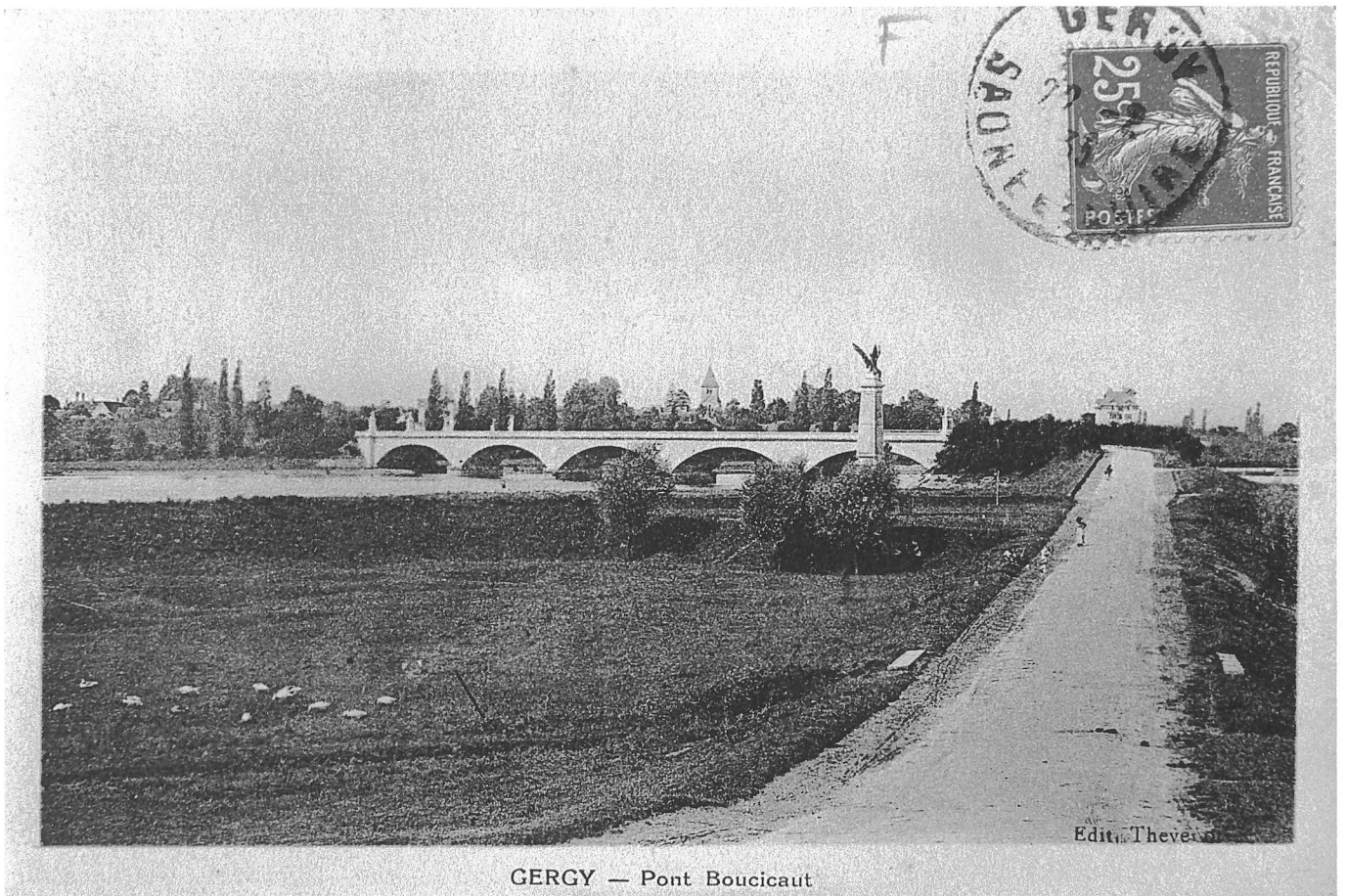
GERMY — Pont Boucaut