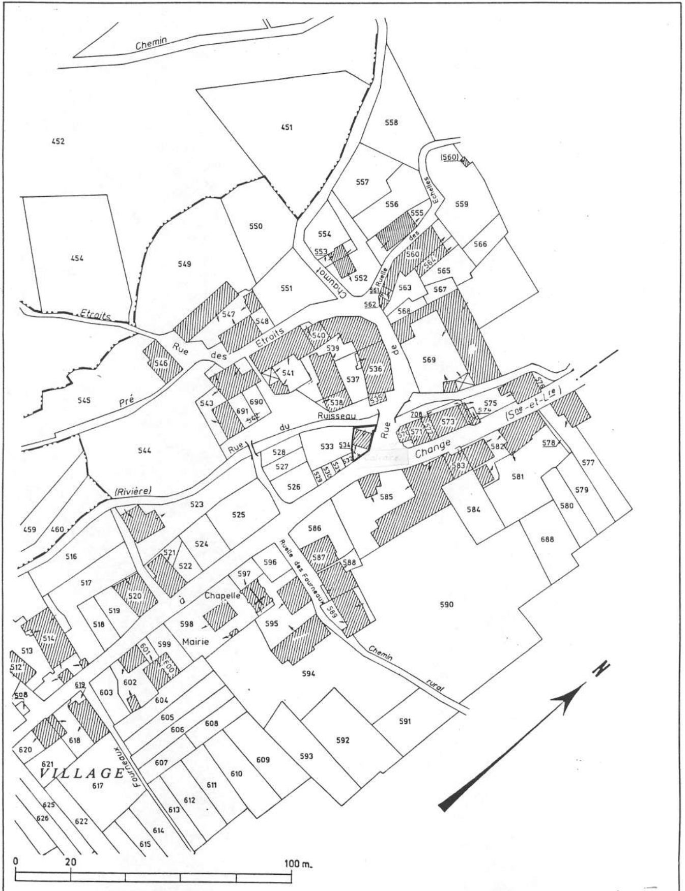
Pl. I - Plan de situation et plan-masse Extrait du plan cadastral au 1:1000e, section C2 de 1988.