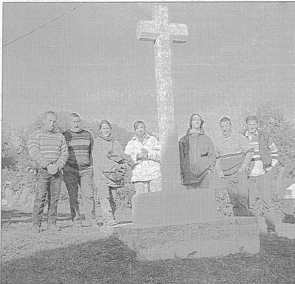
Le nouveau calvaire et l'équipe ayant réalisé le travail