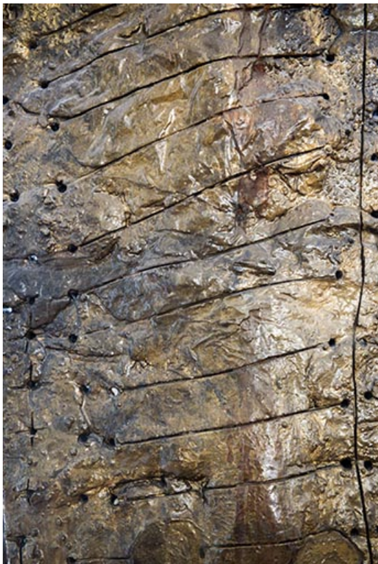
Détail de surface d'un totem.