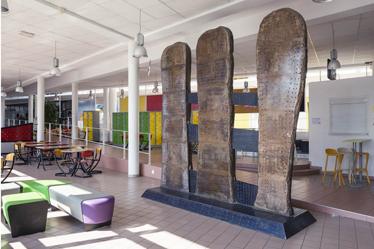
Les trois totems dans leur contexte.