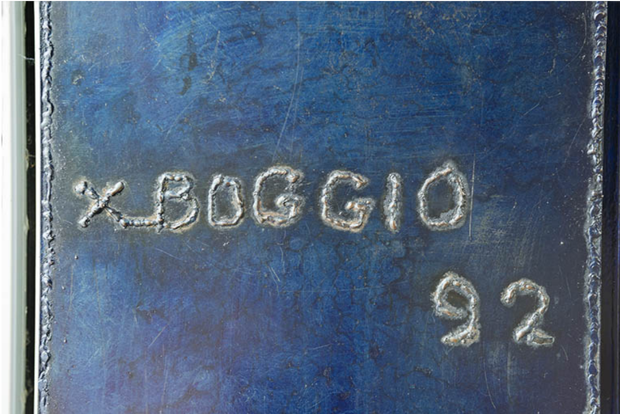
Signature et date sur la sculpture le long de la rue.