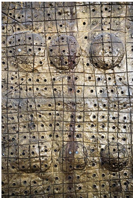
Détail de surface d'un totem.