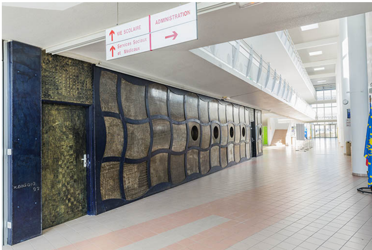
Vue d'ensemble de la sculpture le long de la rue.