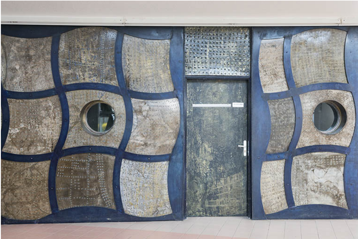
Détail de la sculpture sur le mur de la rue.