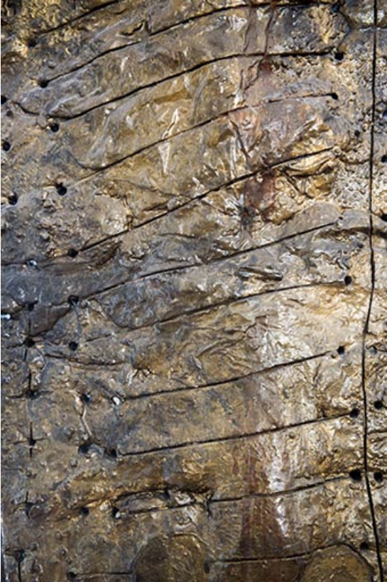
Détail de surface d'un totem.