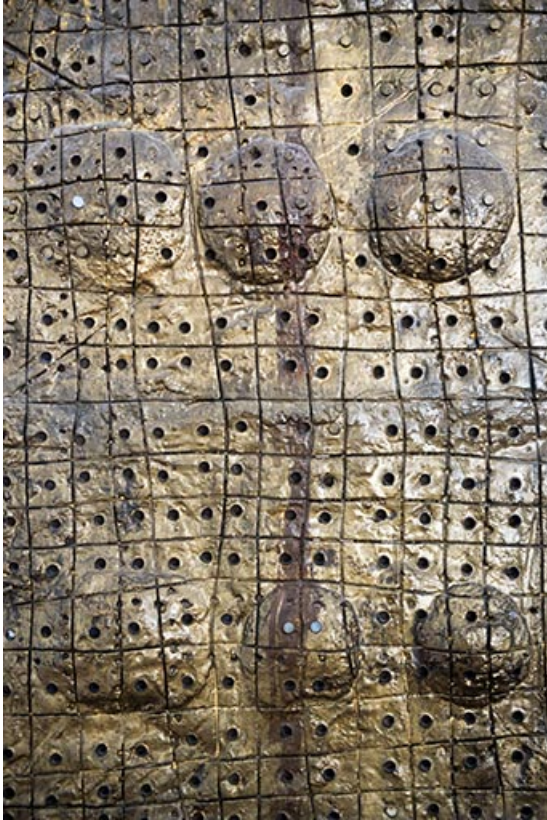
Détail de surface d'un totem.