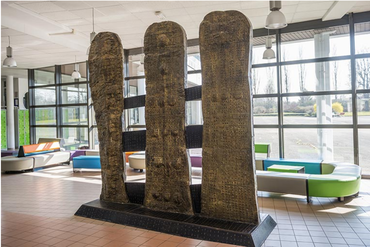
Face postérieure des trois totems.