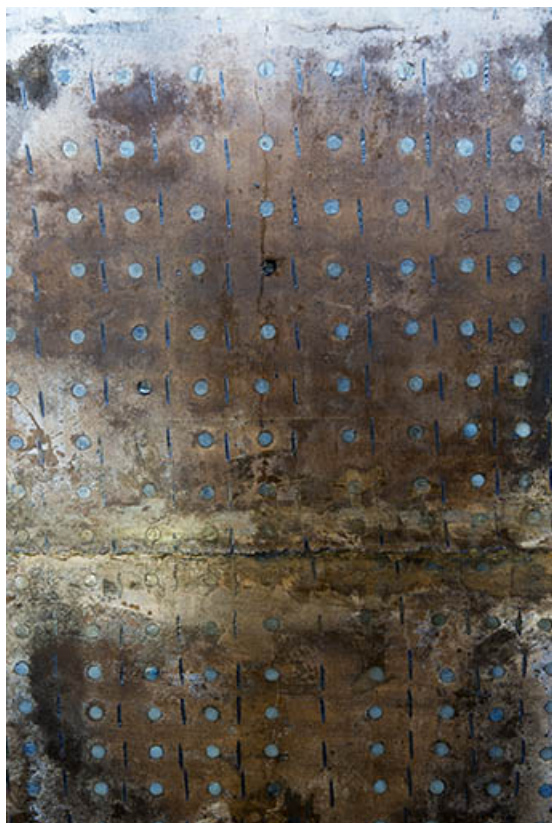
Détail de surface d'un totem.