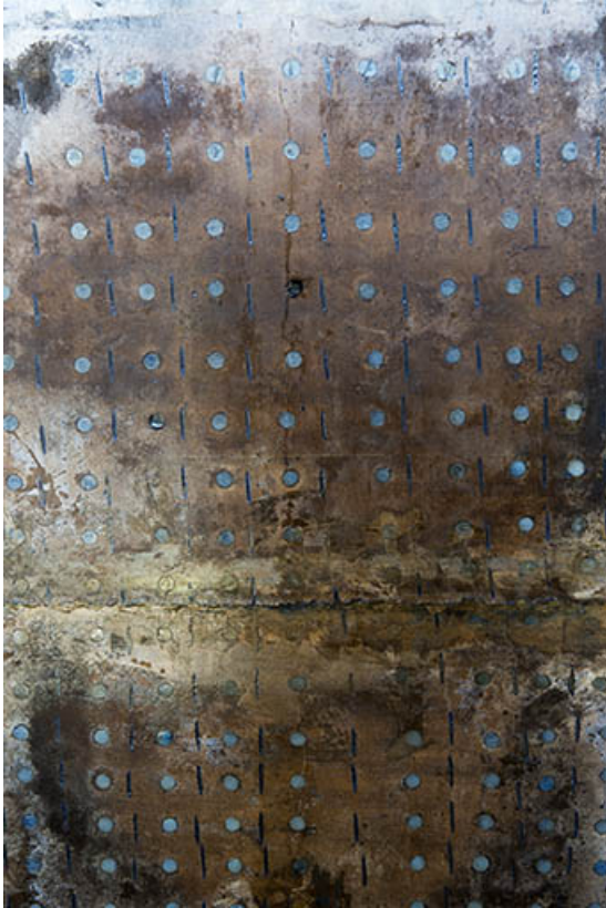
Détail de surface d'un totem.