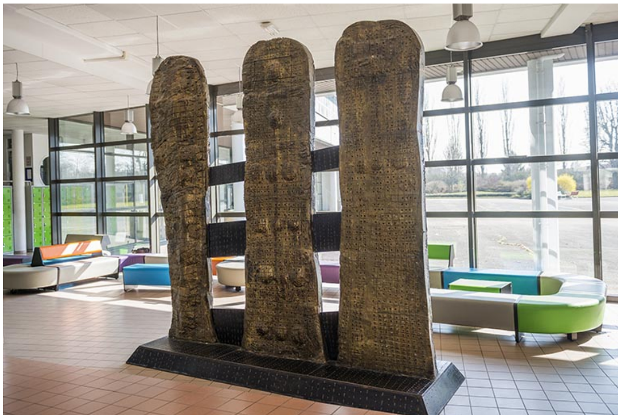
Face postérieure des trois totems.