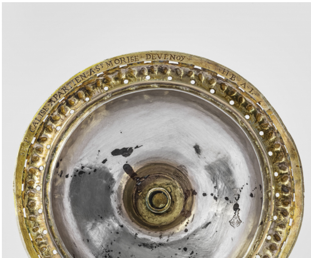
Détail sous le pied : inscription et poinçons.