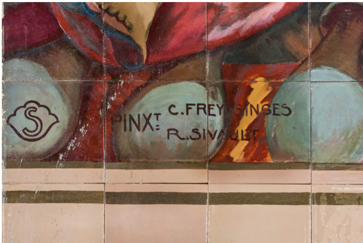
Marque de la Manufacture de Sèvres et signature des peintres C. Freyssinges et R. Sivault (angle inférieur gauche). 89, Auxerre, 56 rue Joubert