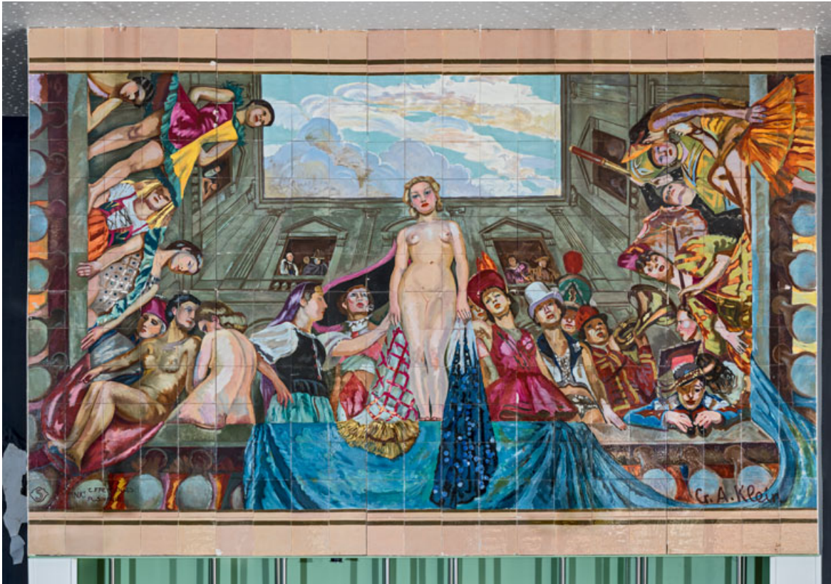
Foyer du public : la Vue, panneau en céramique d'après un dessin de Klein. 89, Auxerre, 56 rue Joubert