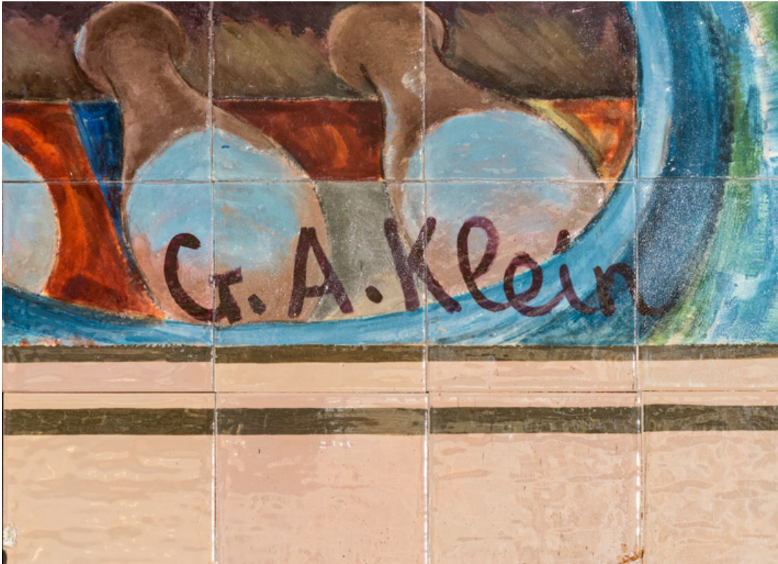
Signature de Georges-André Klein (angle inférieur droit). 89, Auxerre, 56 rue Joubert