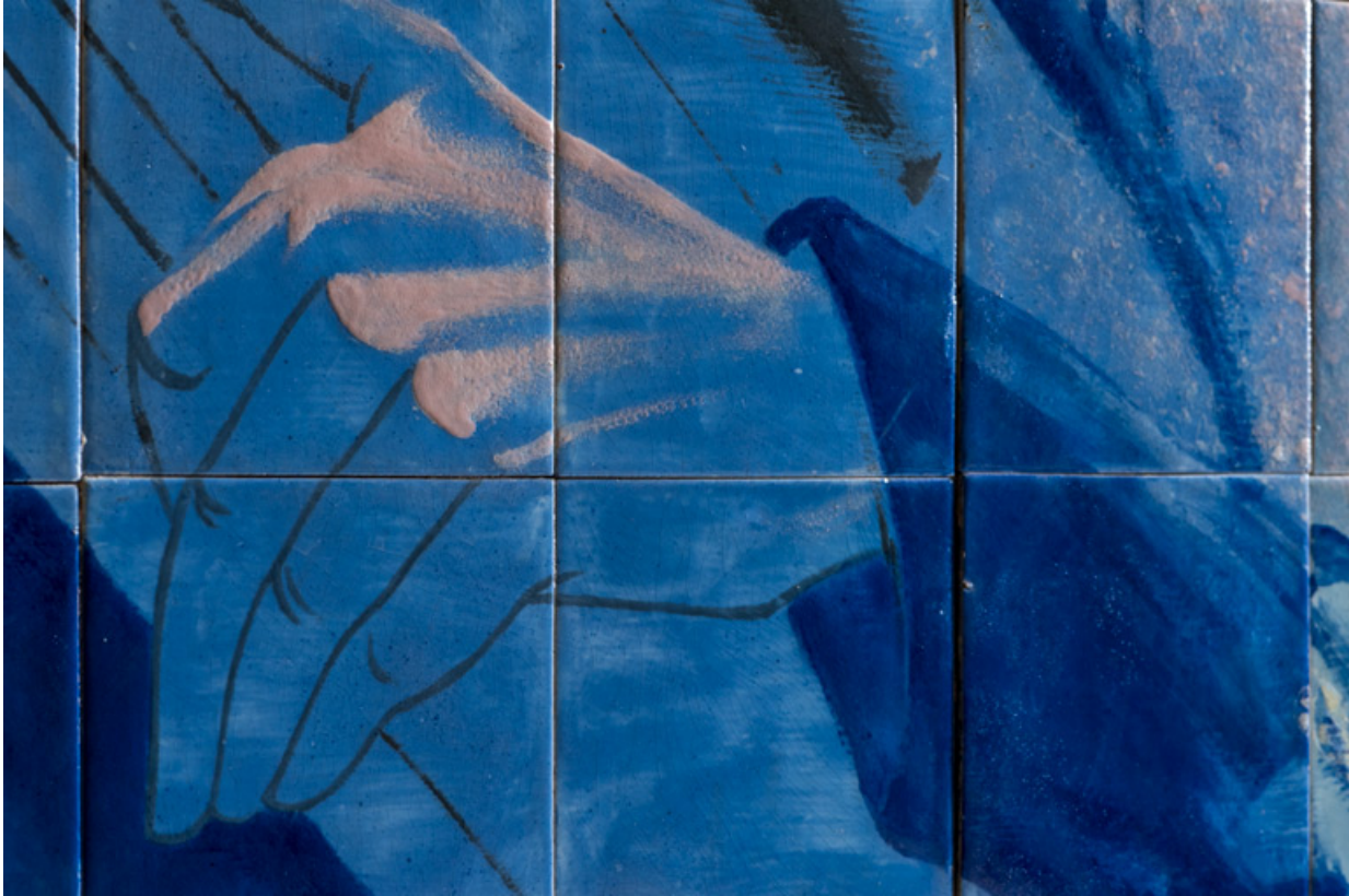
Partie gauche : main du joueur de tuba.