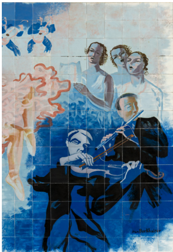
Partie droite : chanteuses et musiciens.