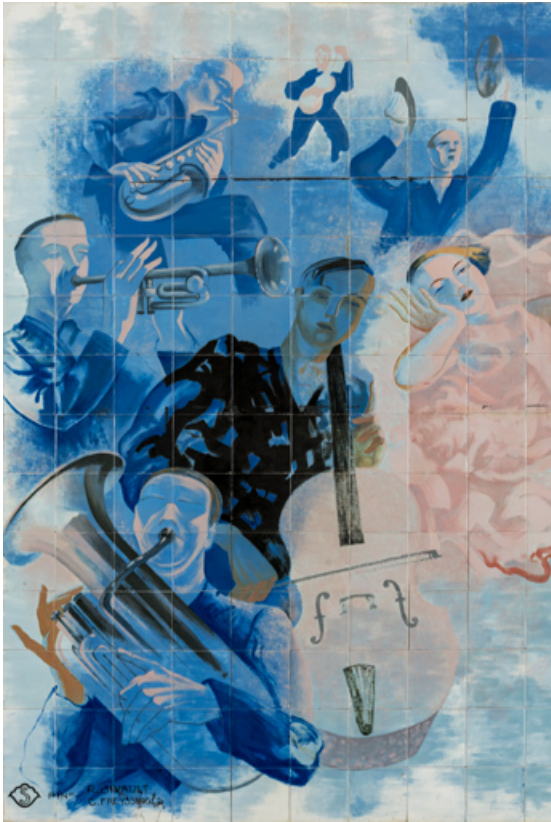
Partie gauche : musiciens.