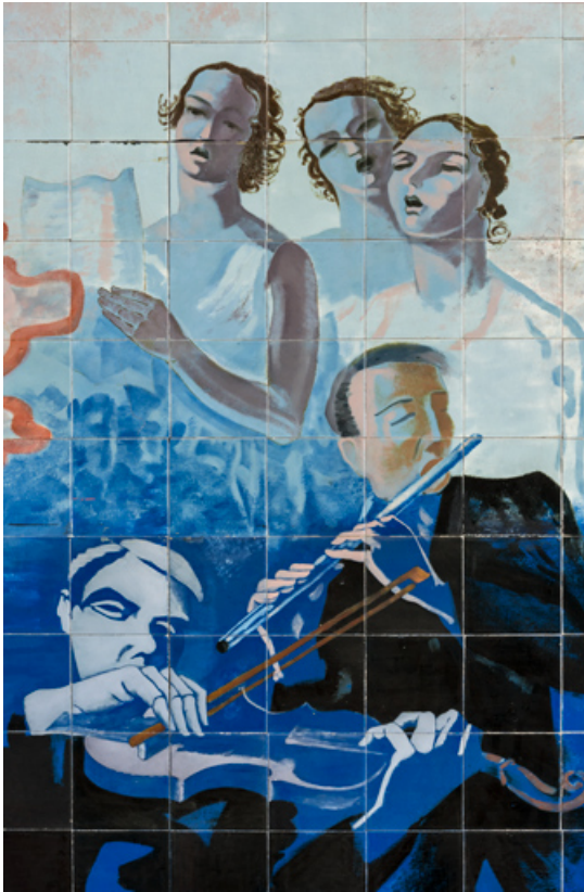
Partie droite : chanteuses et musiciens (cadrage serré). 89, Auxerre, 56 rue Joubert