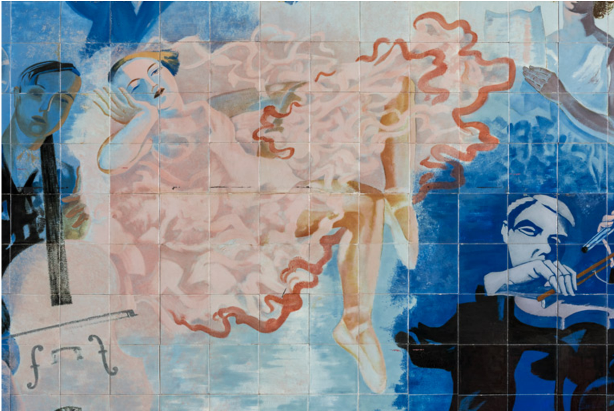
Partie centrale : danseuse.