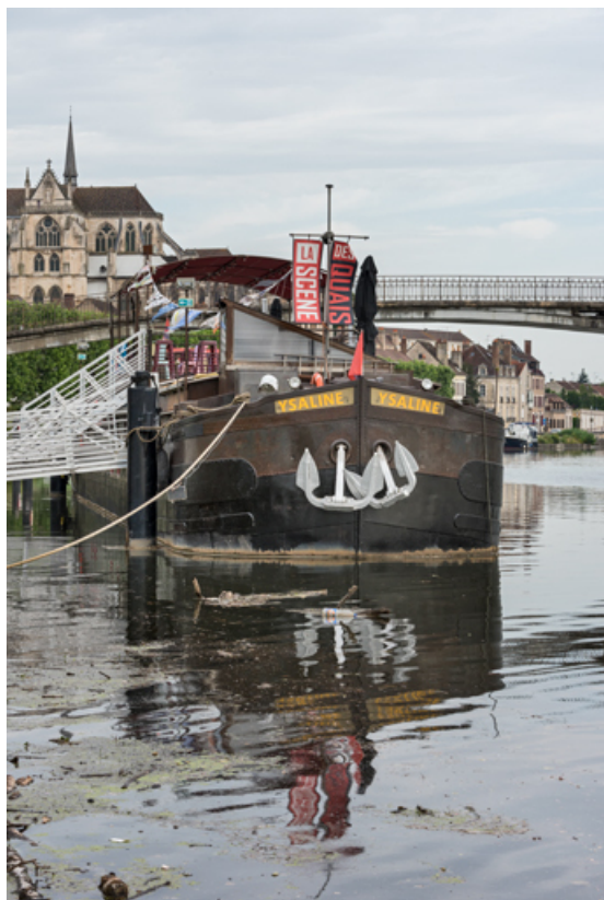
Vue d'ensemble de la proue.