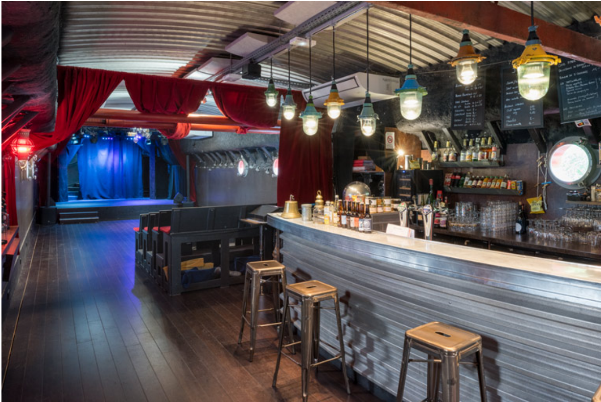
Bar et salle de spectacle.