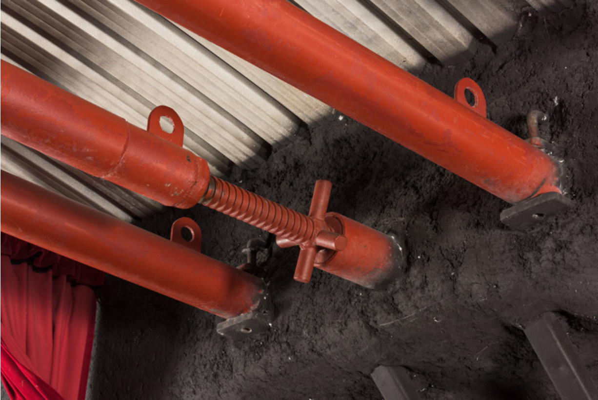
Salle : extrémité des overgands.