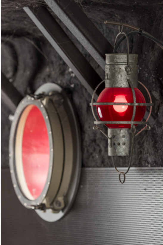
Bar : hublot et lanterne rouge.