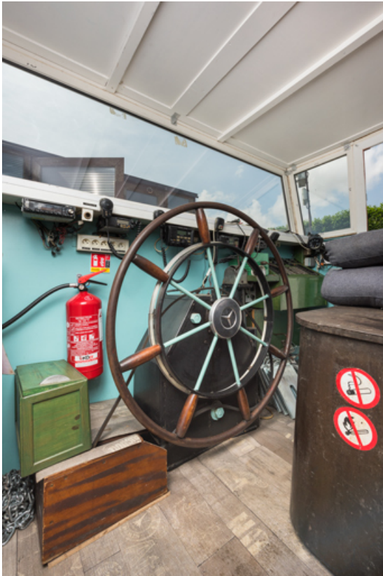
Timonerie : macaron (barre).