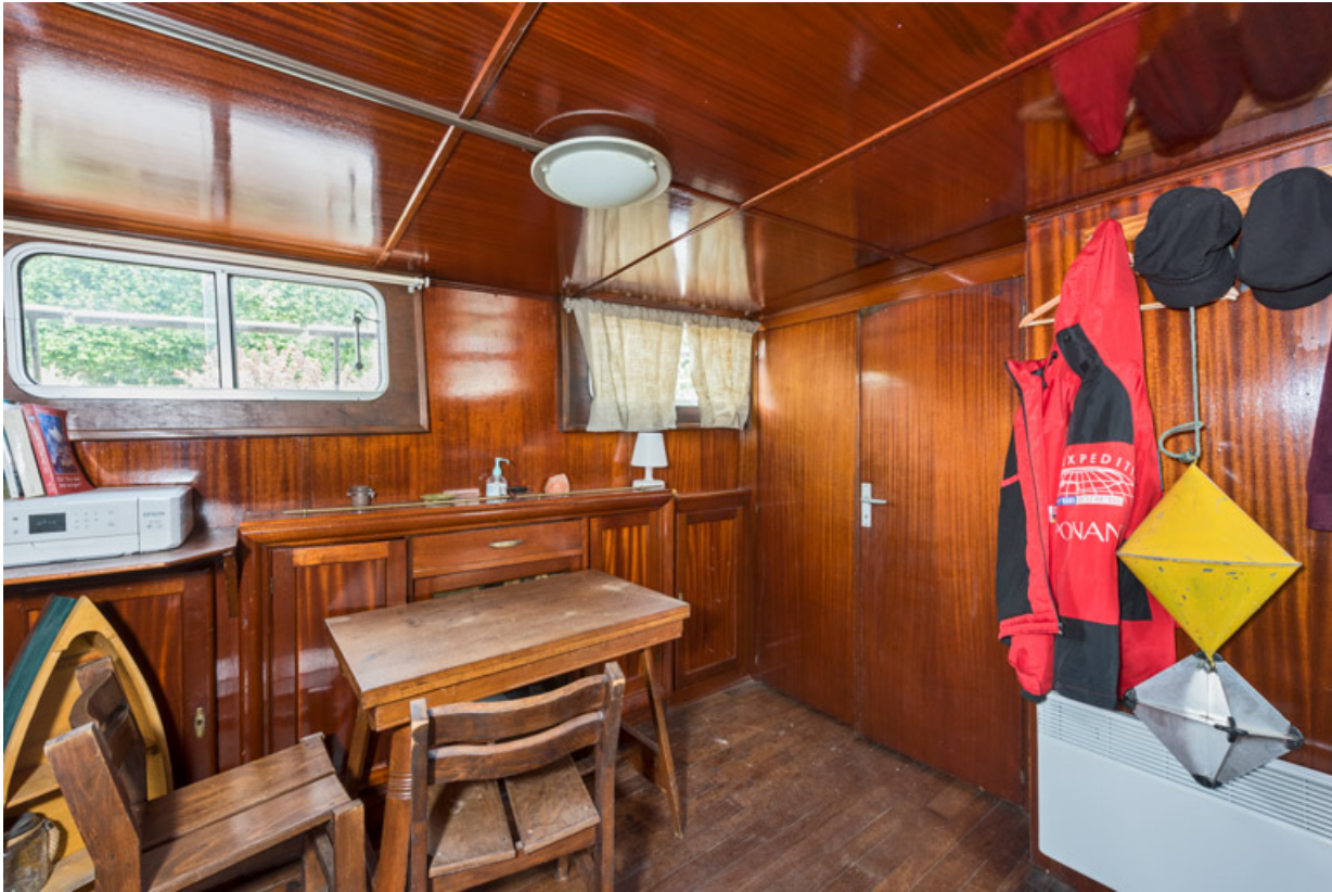
Cabine : salle de séjour et chambre (portes fermées).