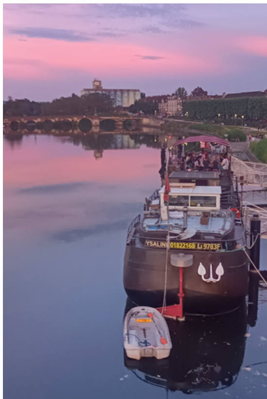
Vue d'ensemble de la poupe.