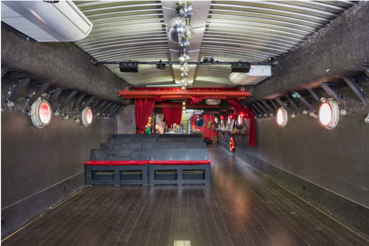
Péniche Ysaline, actuellement salle de spectacle la Scène des Quais (quai de la République) : la salle. 89, Auxerre