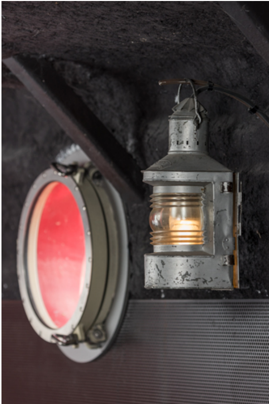
Bar : hublot et lanterne blanche.