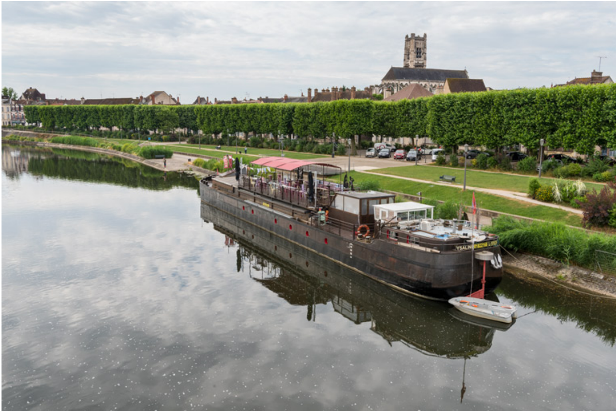
Péniche Ysaline, actuellement salle de spectacle la Scène des Quais (quai de la République). 89, Auxerre