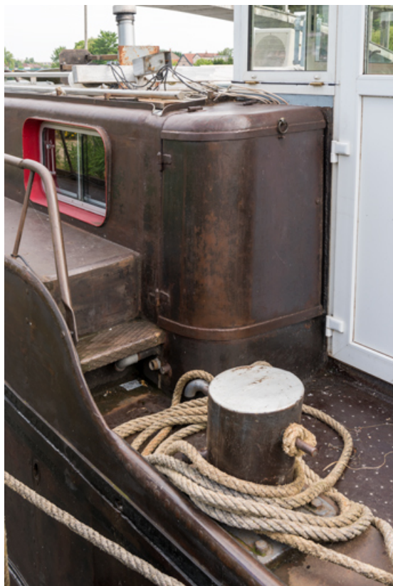
Accès au compartiment moteur, fermé.