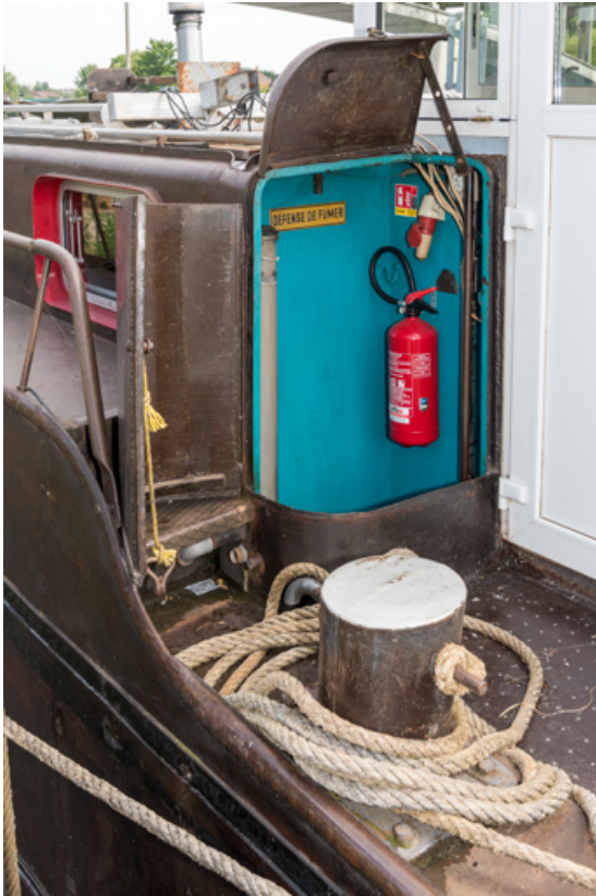
Accès au compartiment moteur, ouvert.