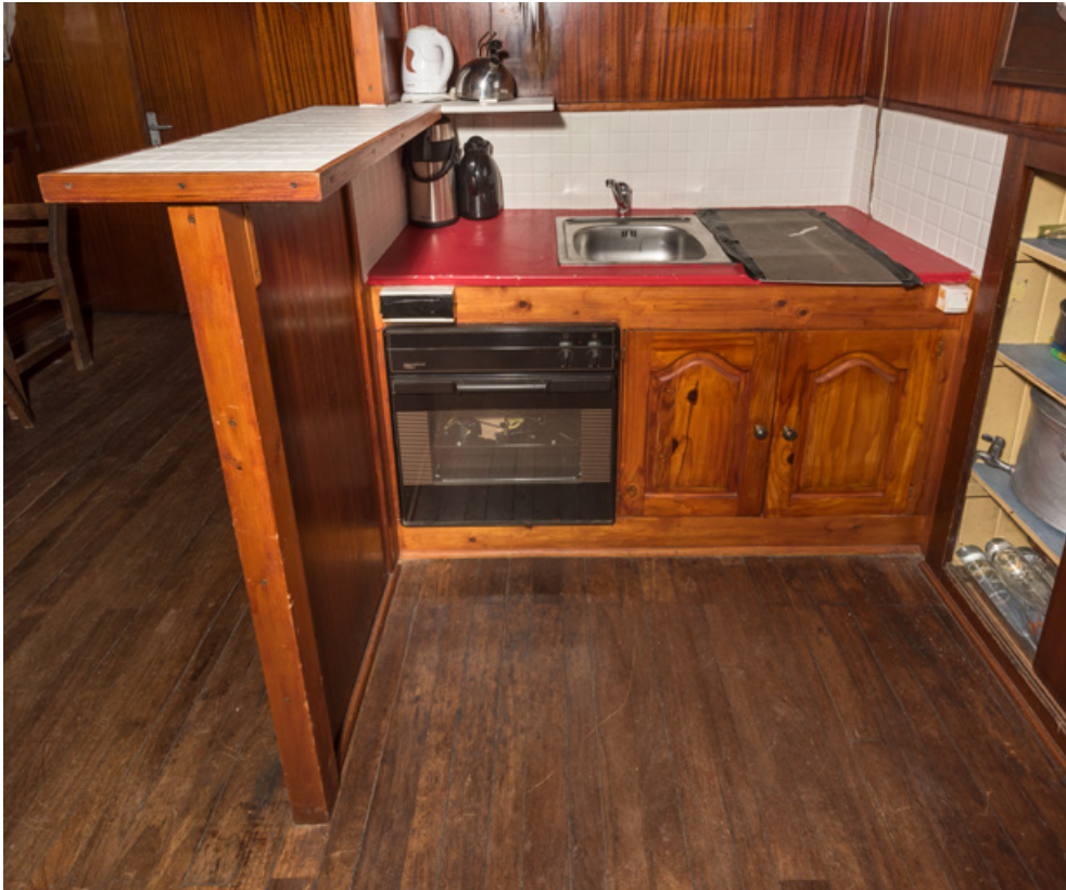
Cabine : cuisine, depuis la timonerie.