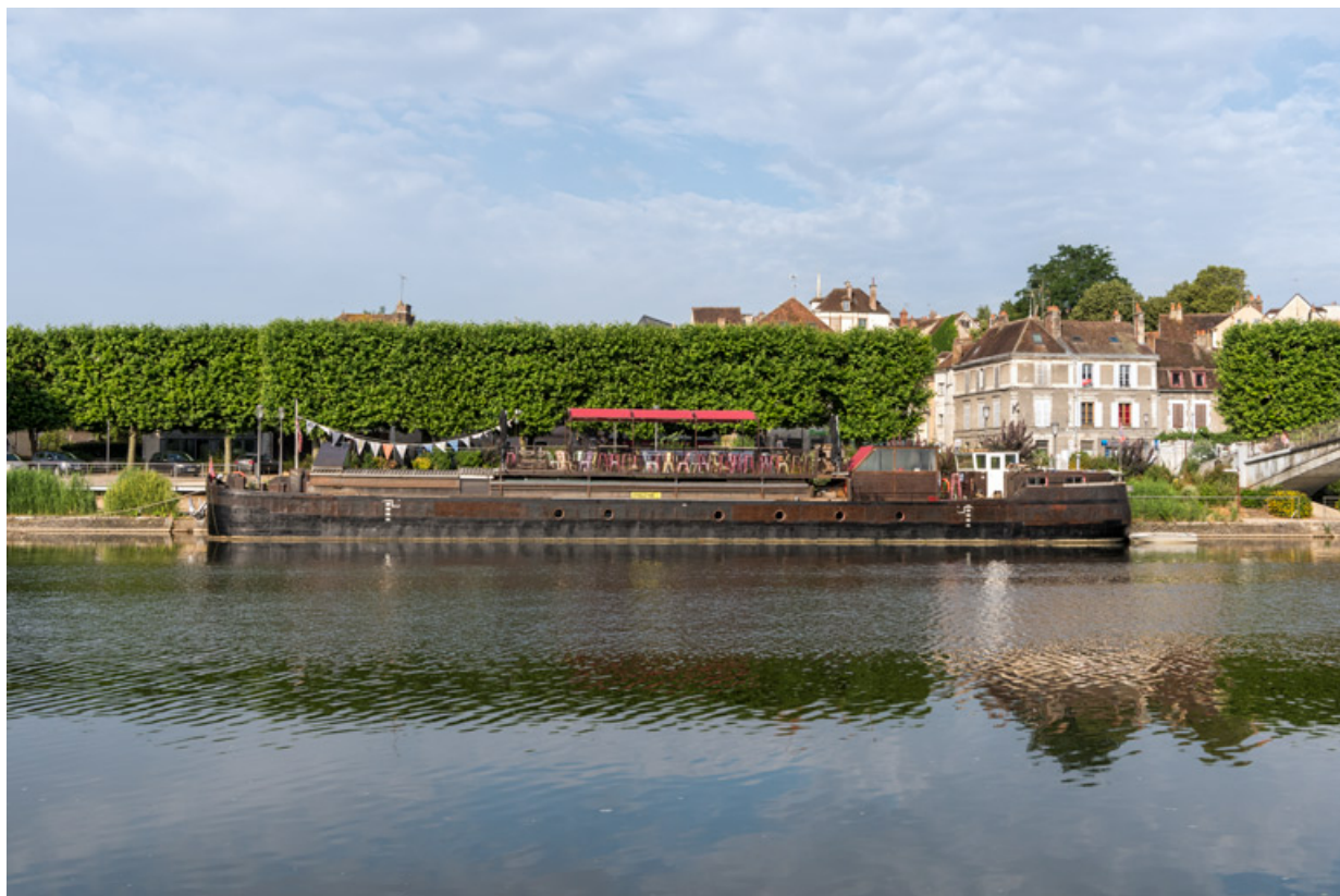
Vue d'ensemble du côté babord.