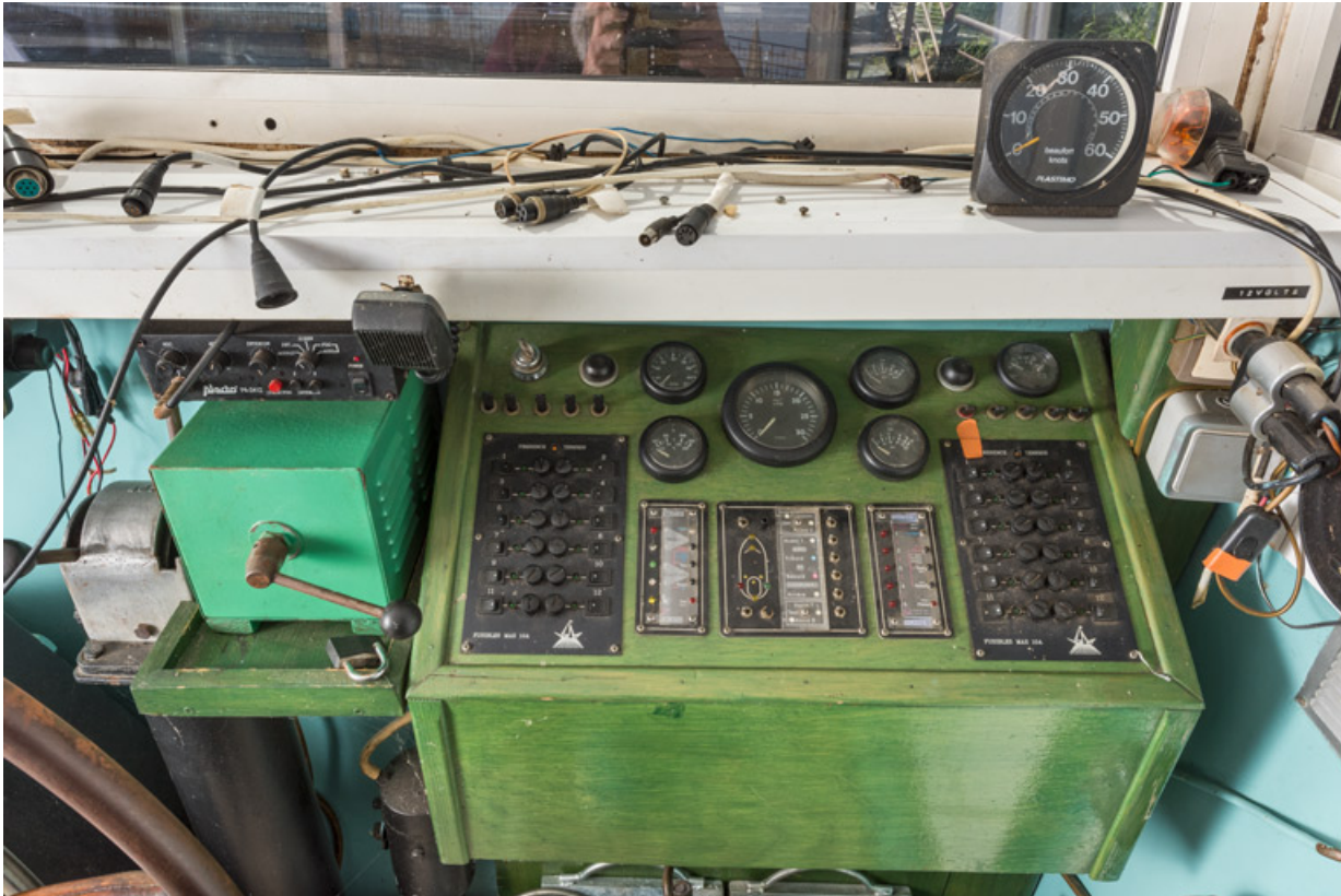
Timonerie : commandes et cadrans.