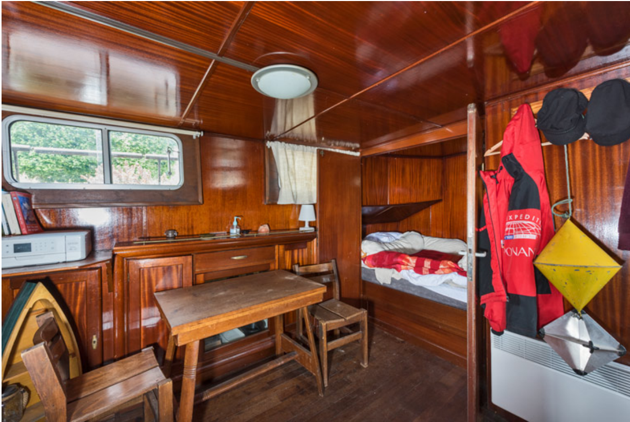
Cabine : salle de séjour et chambre (portes ouvertes).