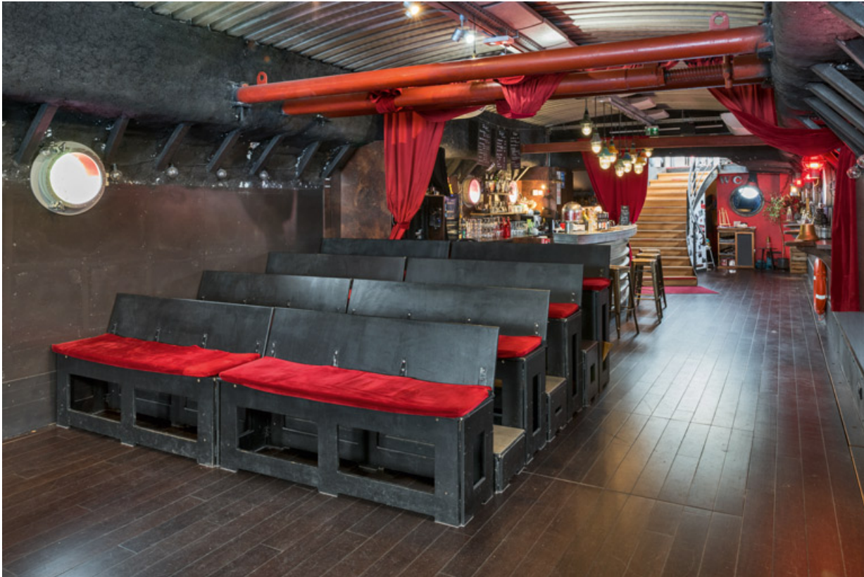
Salle : les sièges.