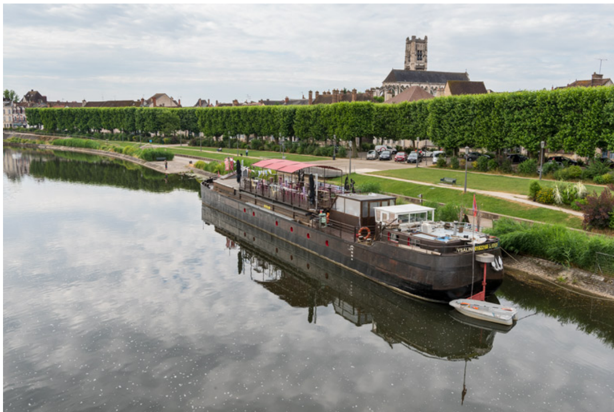
Péniche Ysaline, actuellement salle de spectacle la Scène des Quais (quai de la République).