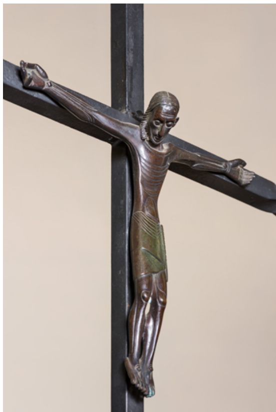
Christ sur la croix. Vue d'ensemble, de trois quarts.

89, Migennes, 3 avenue Marcelin Berthelot