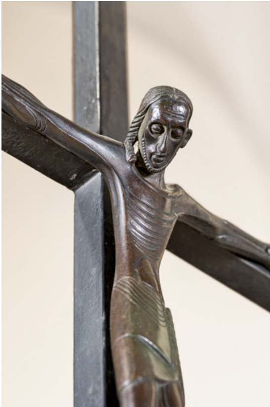
Christ sur la croix. Détail, de trois quarts.

89, Migennes, 3 avenue Marcelin Berthelot