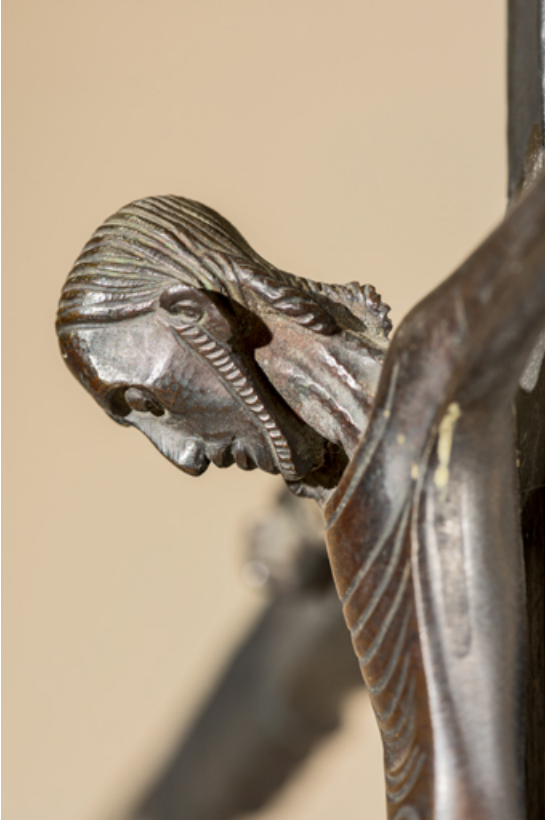
Visage du Christ. Vue latérale.

89, Migennes, 3 avenue Marcelin Berthelot