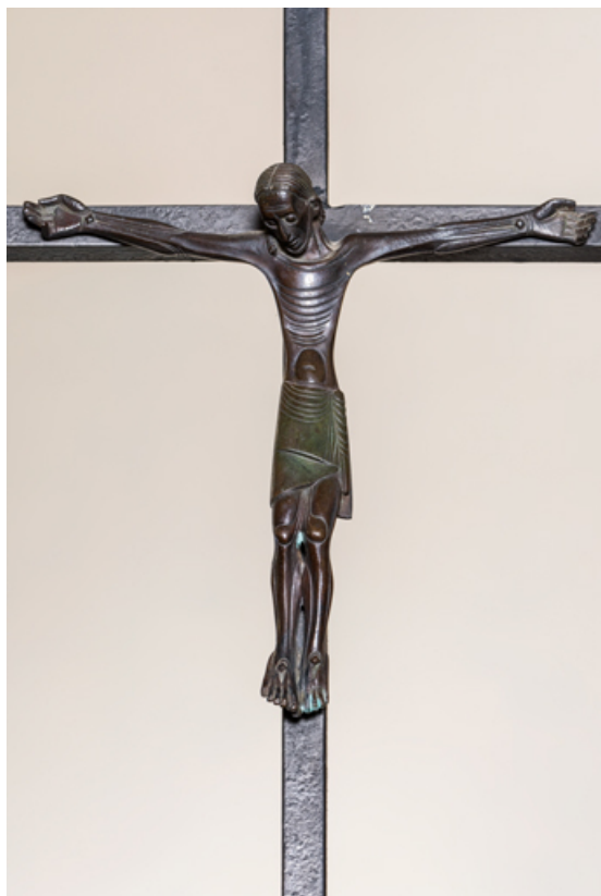
Christ sur la croix. Vue d'ensemble.

89, Migennes, 3 avenue Marcelin Berthelot