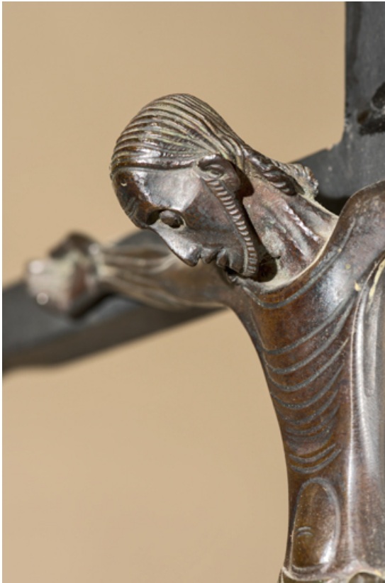
Détail du visage et du buste. Vue de trois quarts.

89, Migennes, 3 avenue Marcelin Berthelot