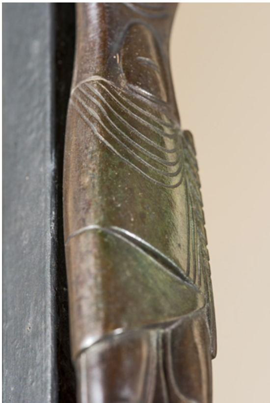
Détail du périzonium.

89, Migennes, 3 avenue Marcelin Berthelot