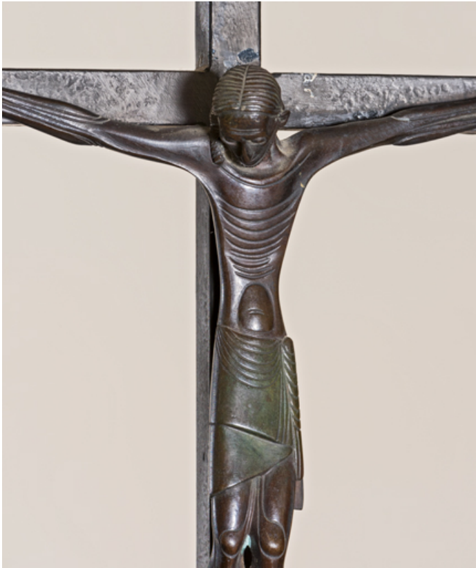
Christ sur la croix. Détail.

89, Migennes, 3 avenue Marcelin Berthelot