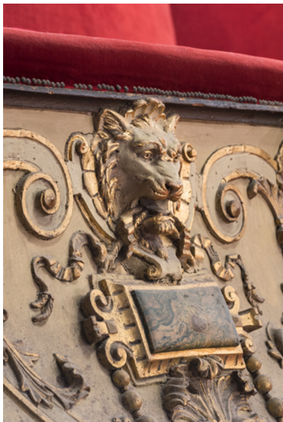
Garde-corps du 1er balcon : mufle de lion ou de loup.