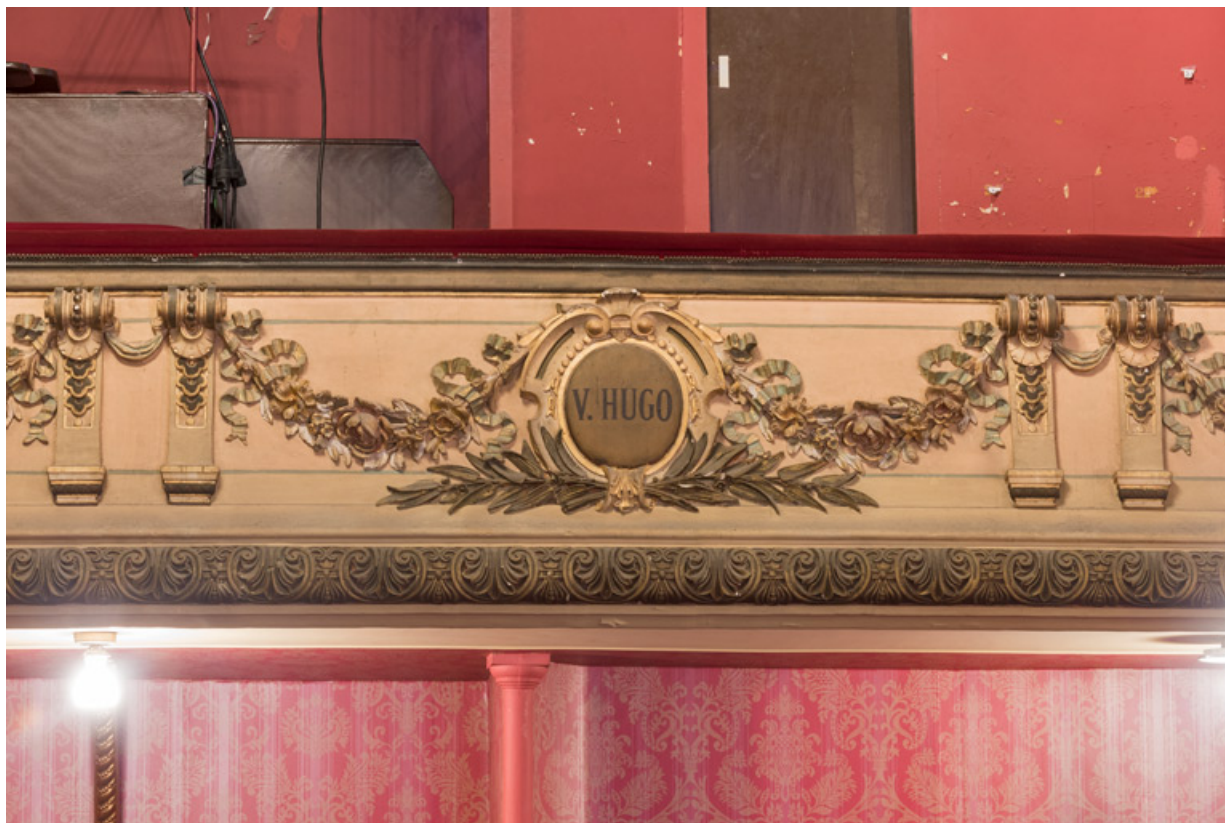
Garde-corps du 2e balcon, avec inscription V. Hugo.