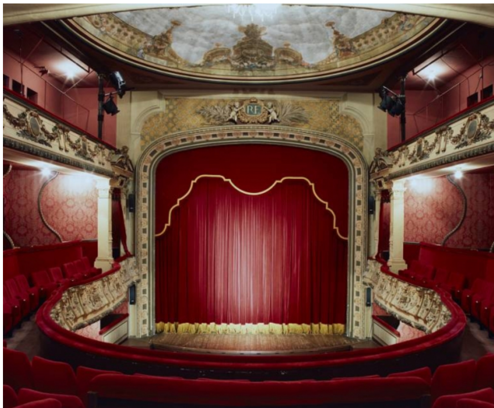
Vue d'ensemble de la scène, depuis la salle au 1er balcon (en 1996). 89, Sens, 1-2 boulevard des Garibaldi