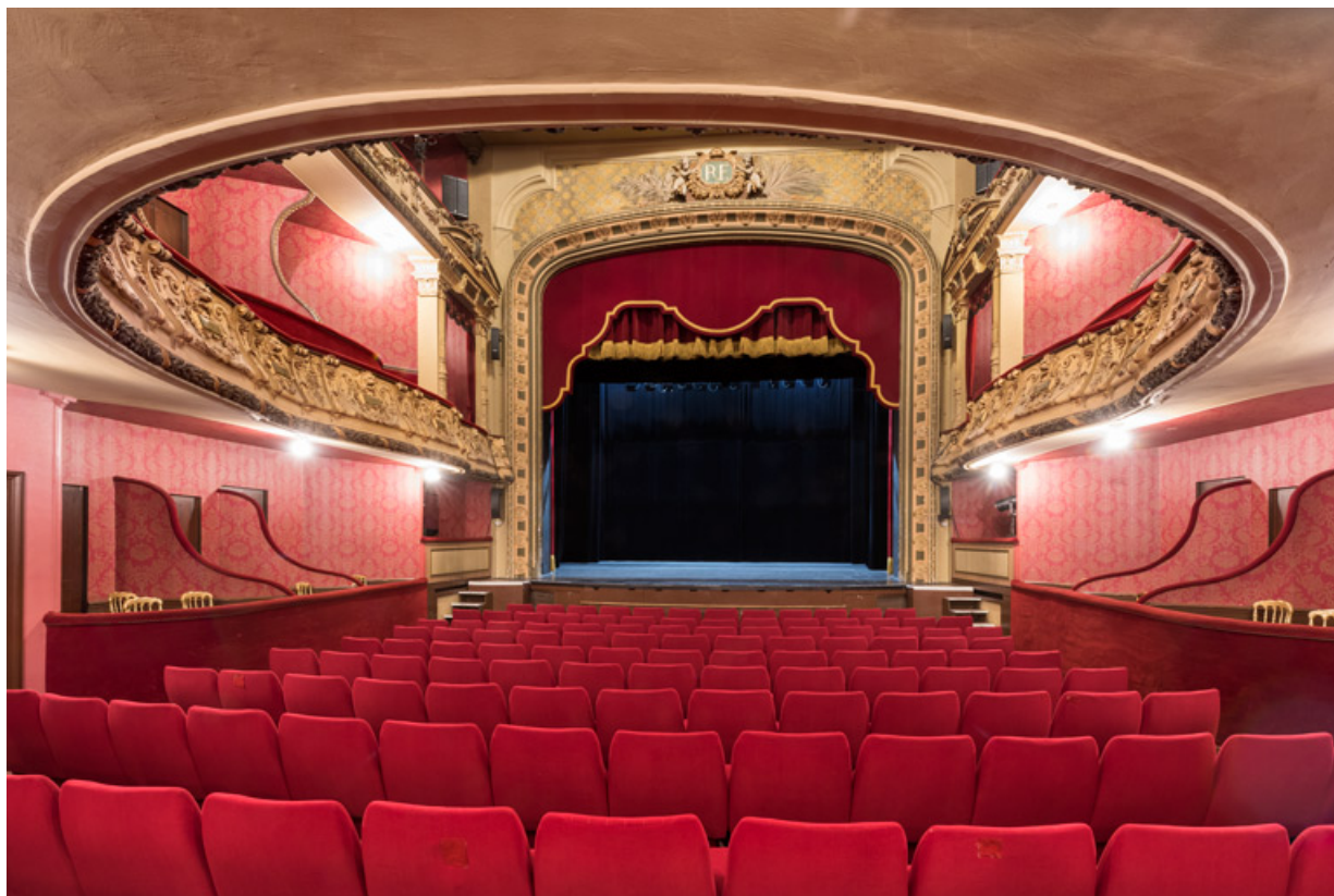
Vue d'ensemble de la scène, depuis la salle à l'orchestre.