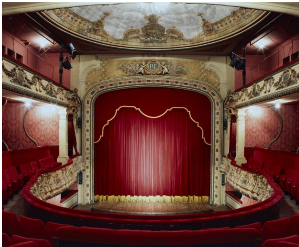
Vue d'ensemble de la scène, depuis la salle au 1er balcon (en 1996).