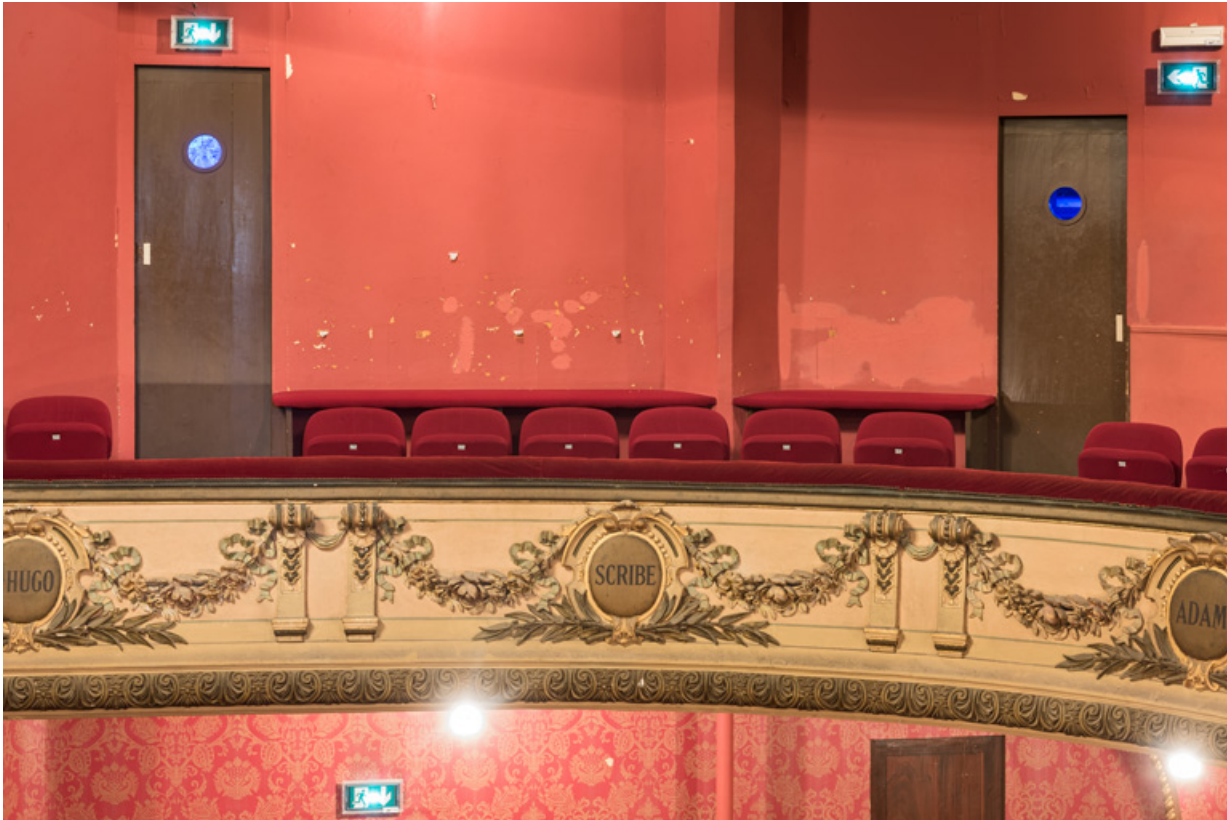
Garde-corps du 2e balcon, avec inscription Scribe.