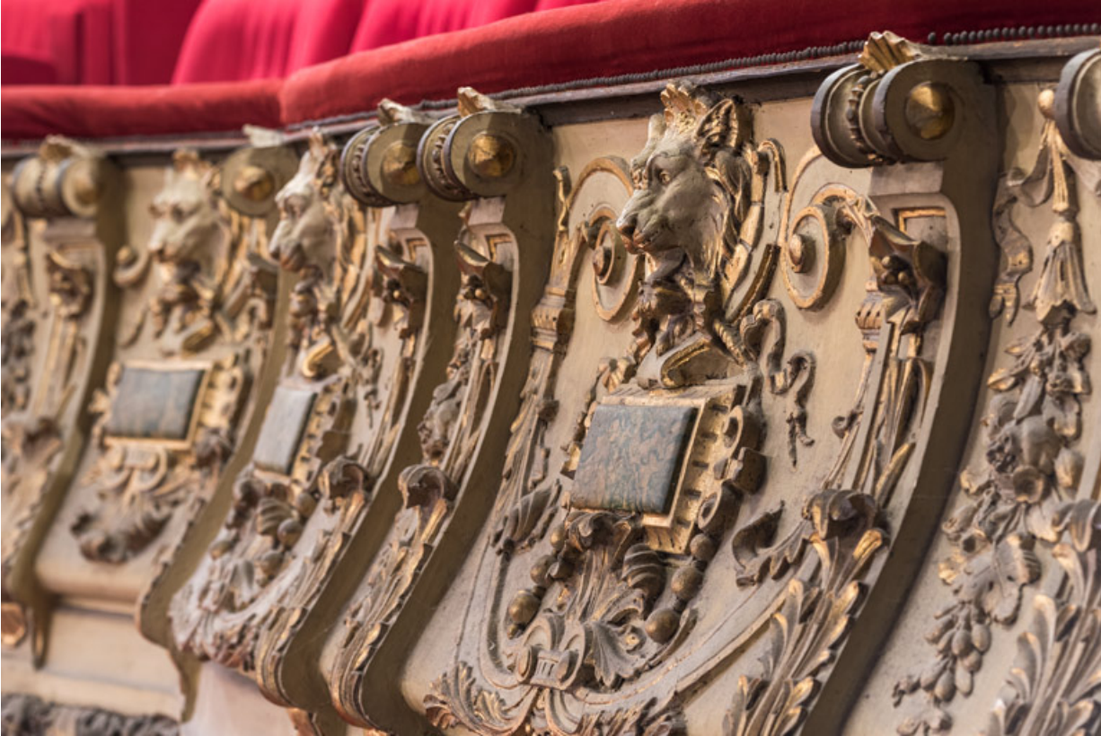
Garde-corps du 1er balcon, vue en enfilade.