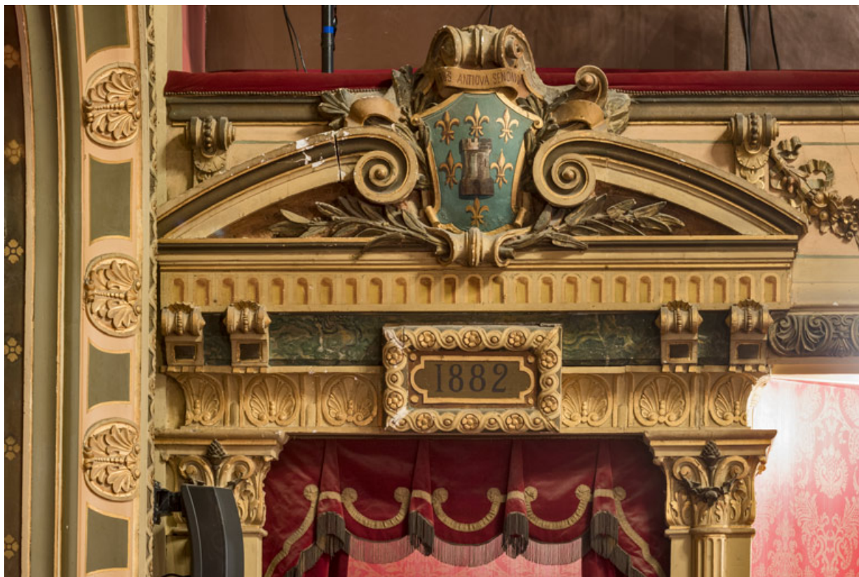
Loges d'avant-scène, côté cour : couronnement.