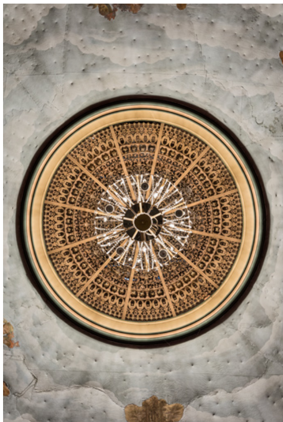
Grille métallique de l'oculus surmontant le lustre.