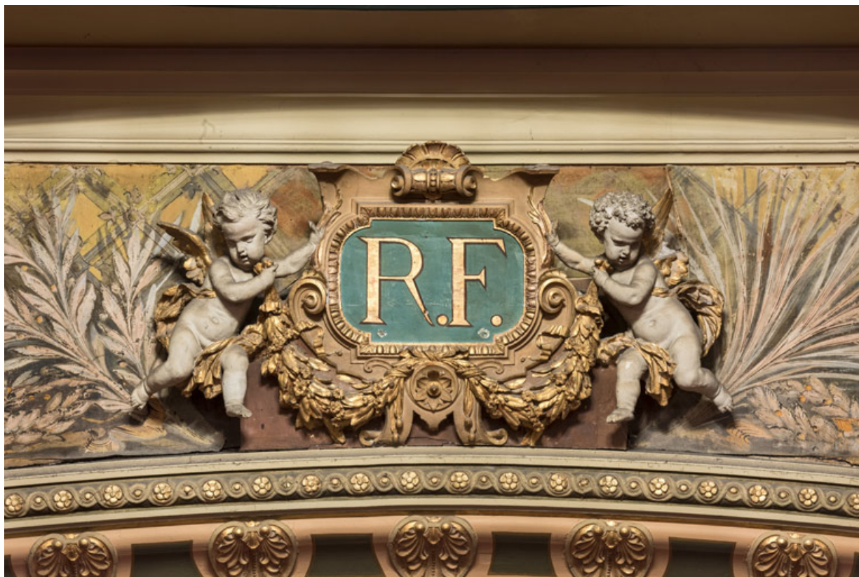
Décor surmontant le cadre de scène.