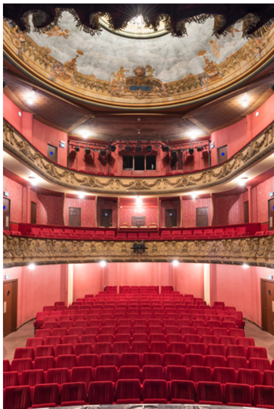
Vue d'ensemble de la salle, depuis la scène.