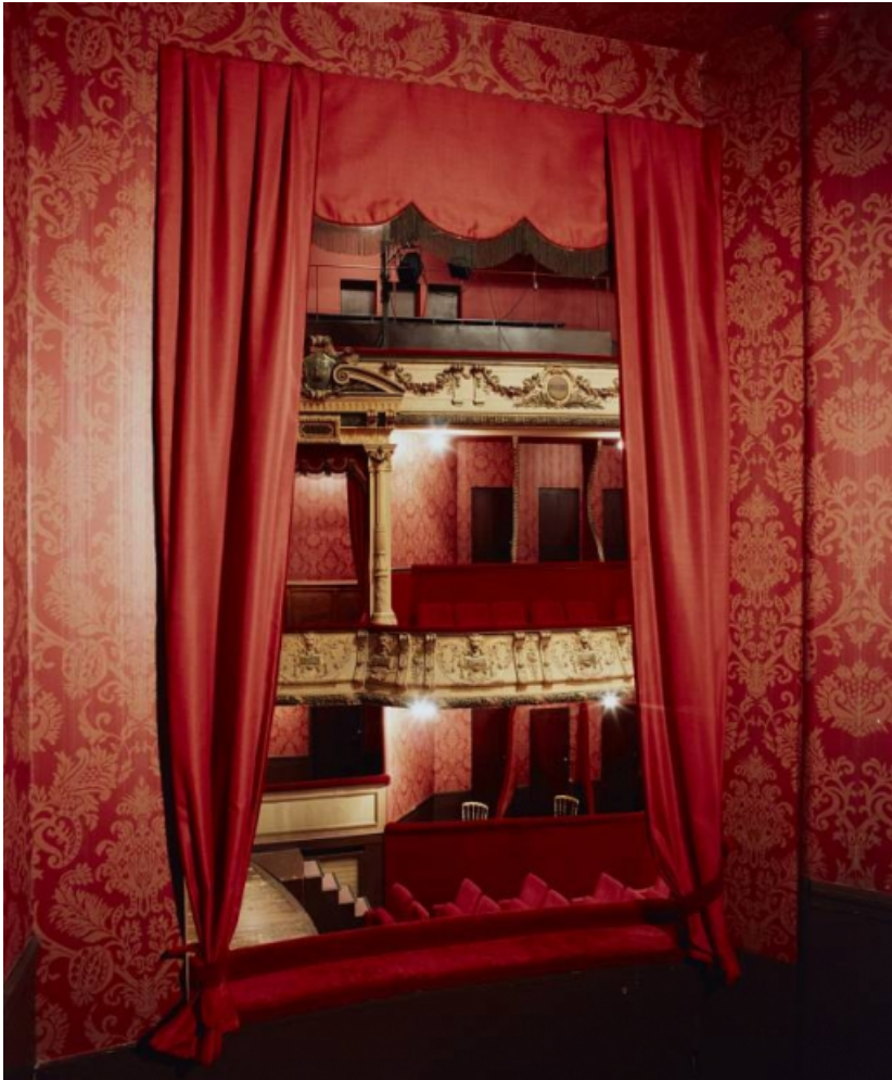
Loges d'avant-scène côté cour, depuis celle côté jardin (en 1996). 89, Sens, 1-2 boulevard des Garibaldi