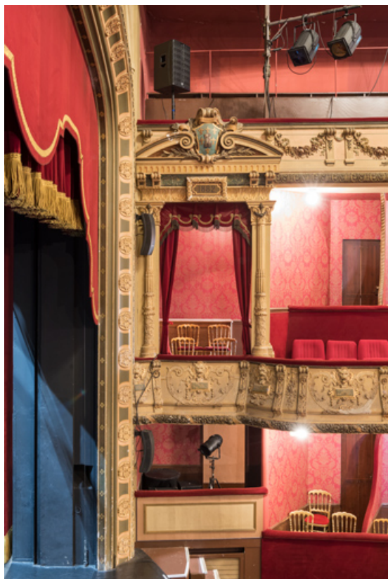
Loges d'avant-scène, côté cour.