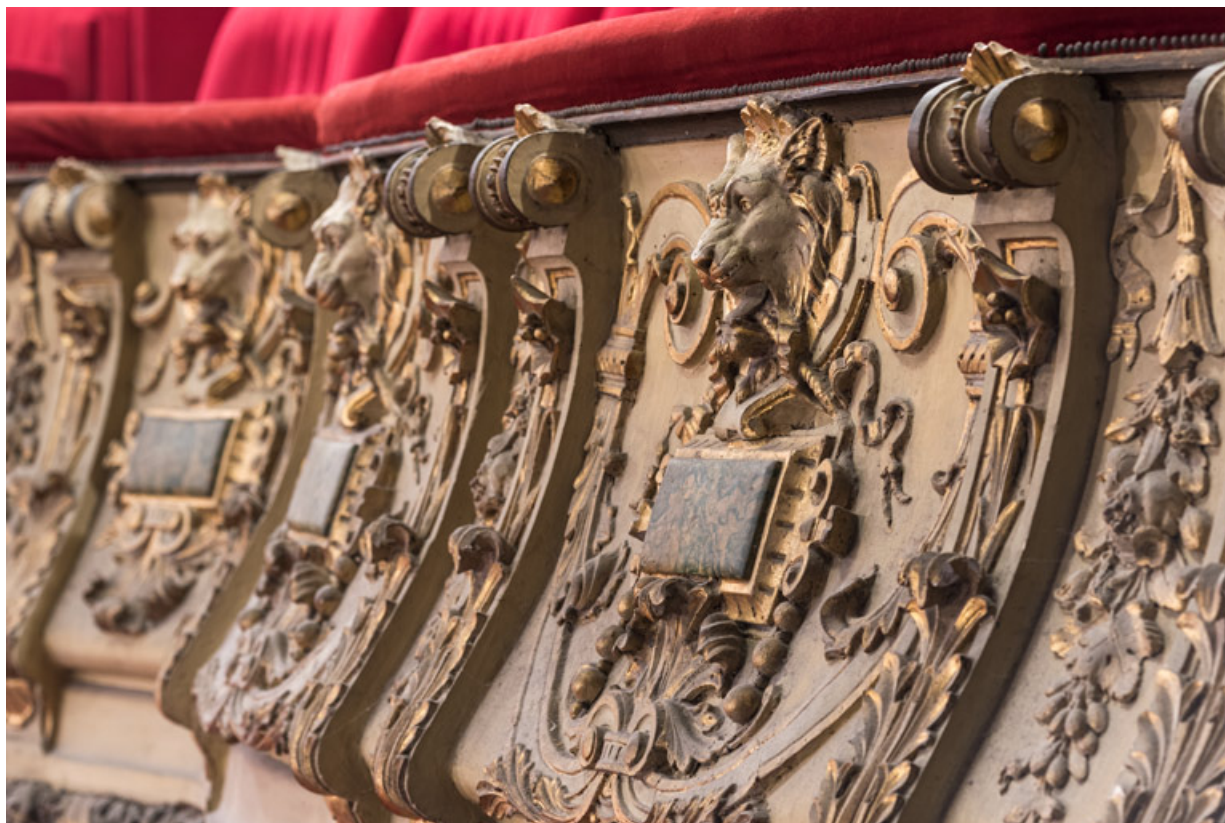
Garde-corps du 1er balcon, vue en enfilade.