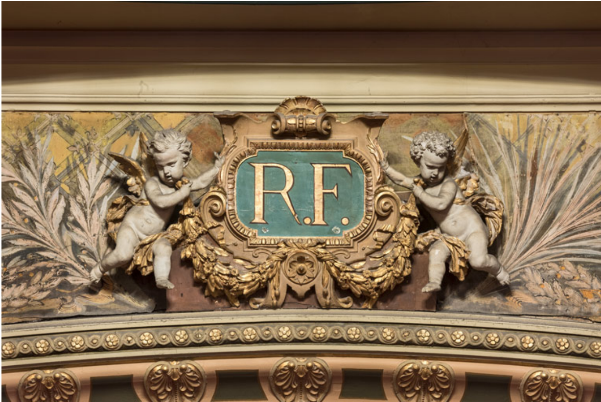
Décor surmontant le cadre de scène.