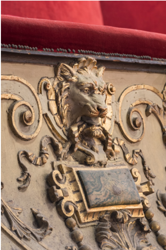
Garde-corps du 1er balcon : mufle de lion ou de loup.