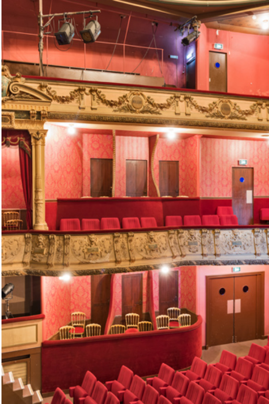
Baignoire et balcons, côté cour.