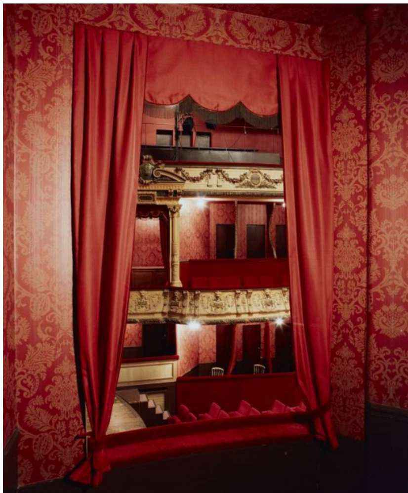
Loges d'avant-scène côté cour, depuis celle côté jardin (en 1996).