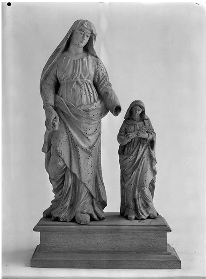
Groupe sculpté : Education de la Vierge, face.