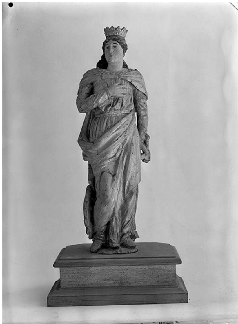
Statuette : sainte Catherine d'Alexandrie, face.