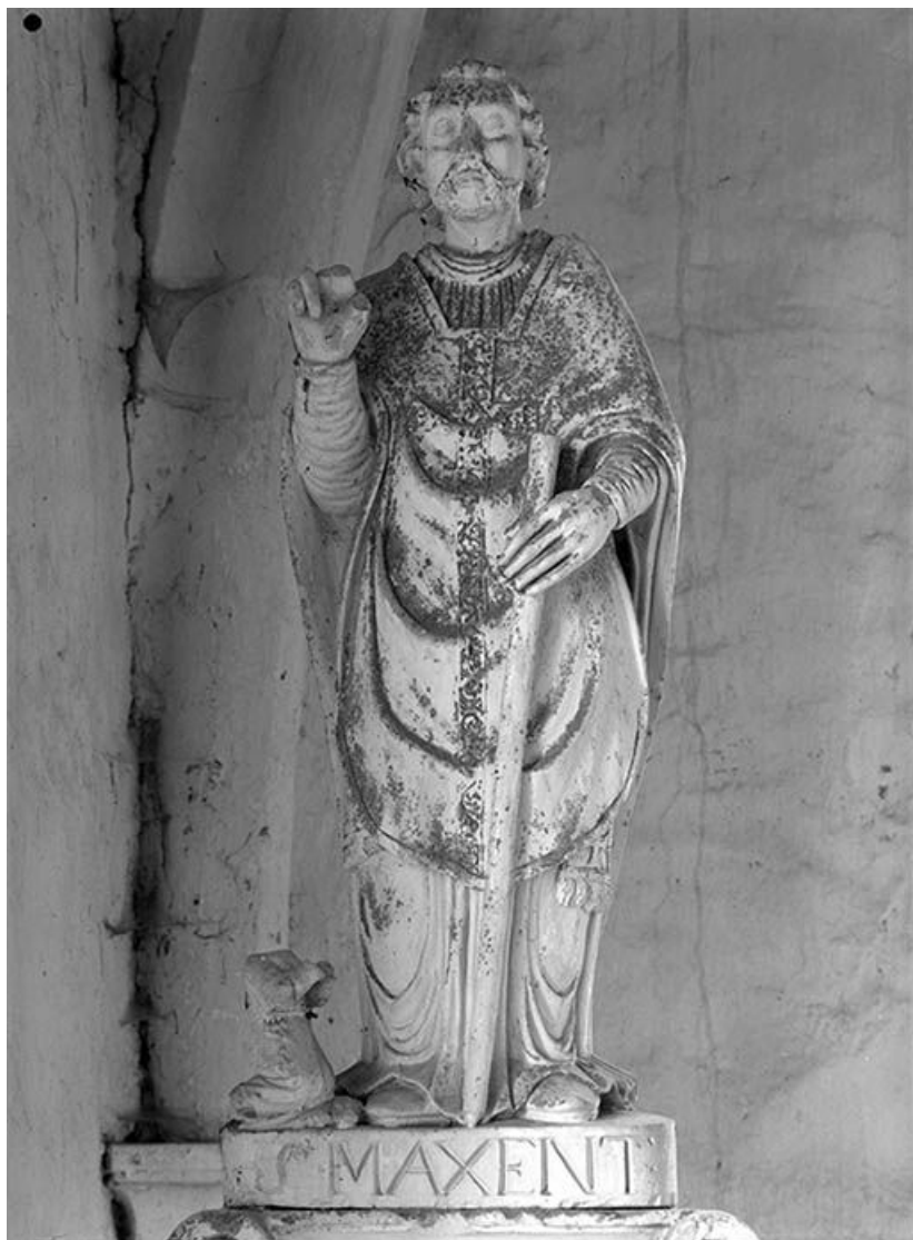
Saint Maixent : face.