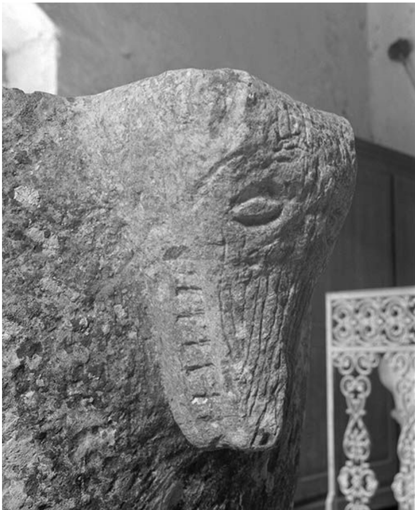
Détail : tête de loup.