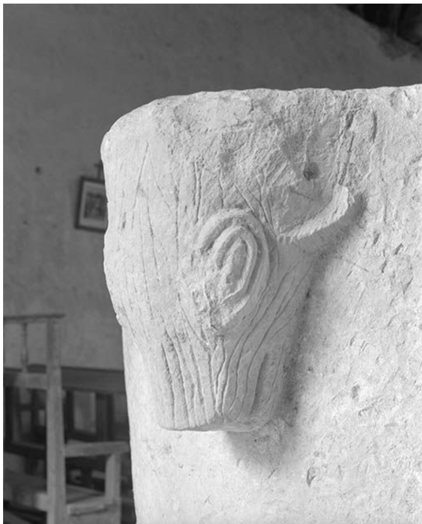
Détail : tête de bélier.