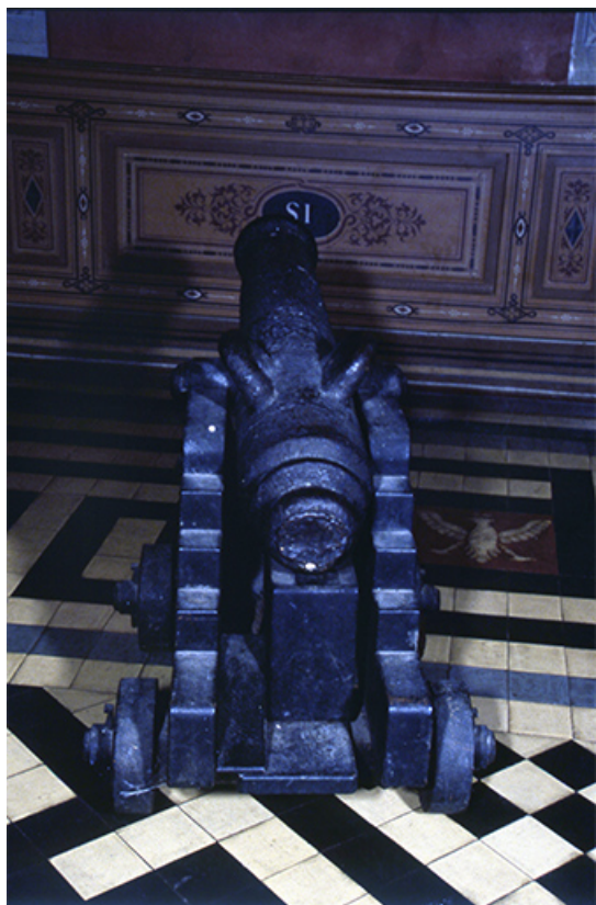
Vue postérieure d'un canon.