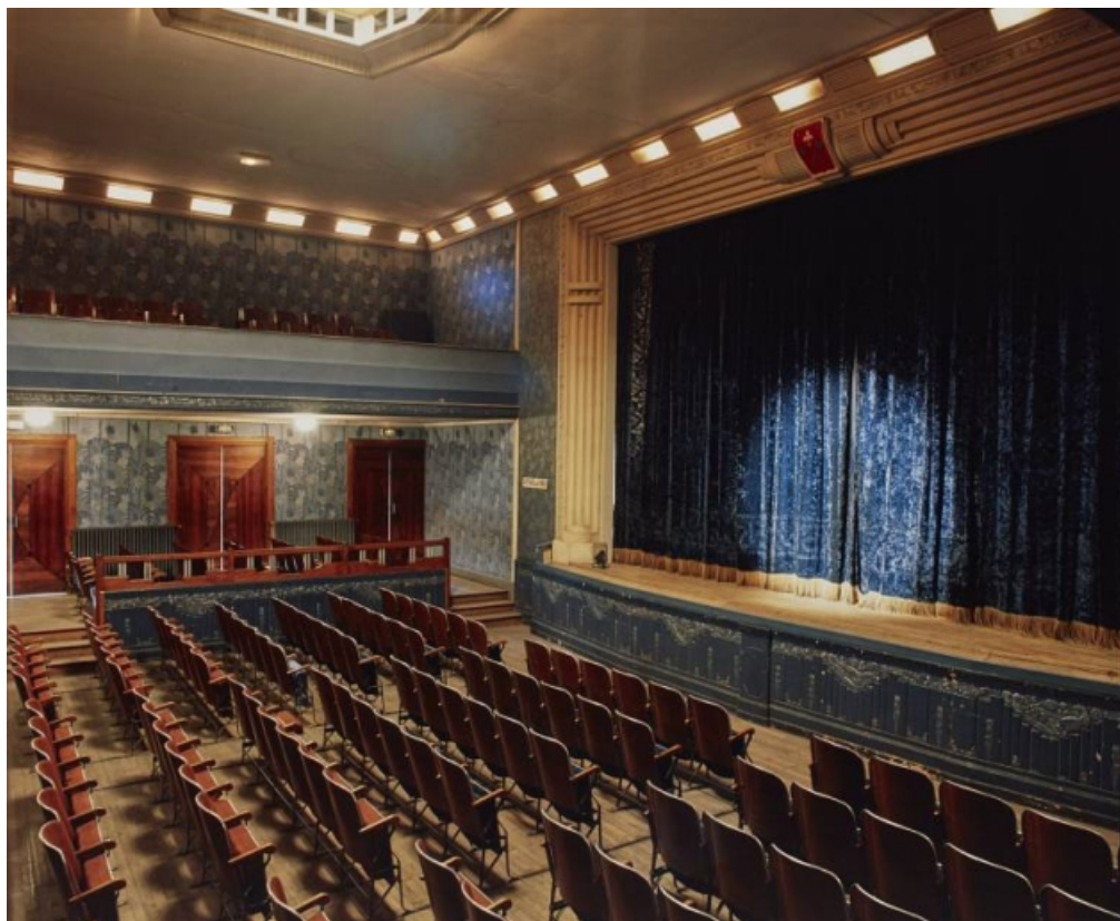
Salle et scène, rideau de scène fermé, en 1996.