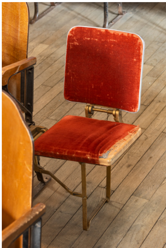
Strapontin (ouvert) dans la galerie côté jardin.