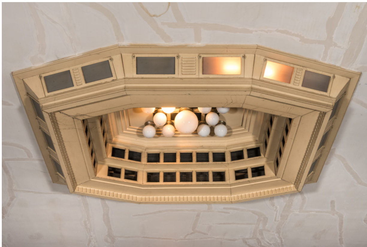
Caisson central lumineux, vu de la scène.