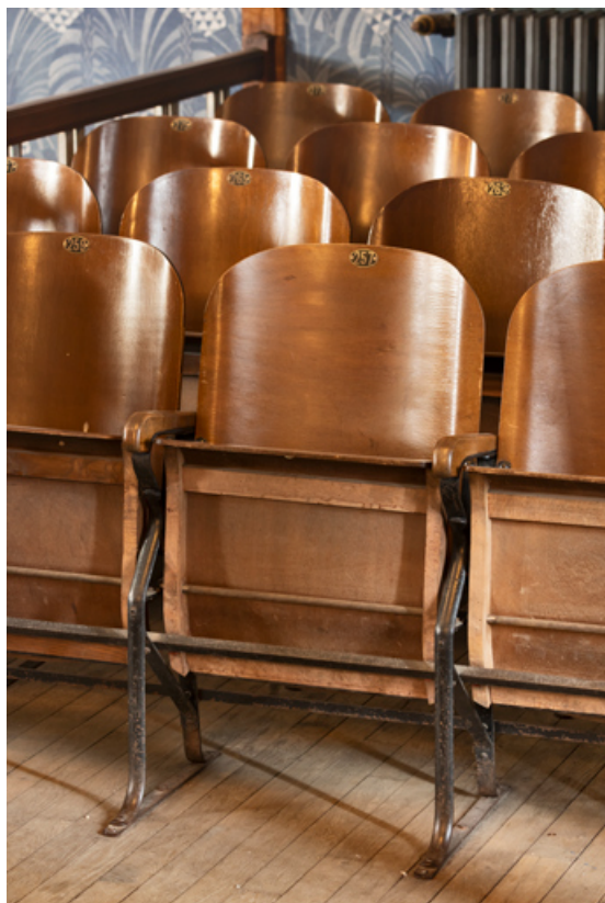
Fauteuils de la galerie côté jardin.