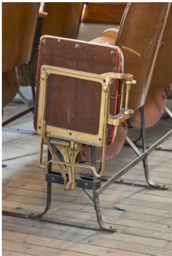
Strapontin (fermé) dans la galerie côté jardin. 71, Louhans, 88 Grande Rue