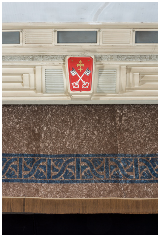
Cadre de scène : armoiries de Louhans.