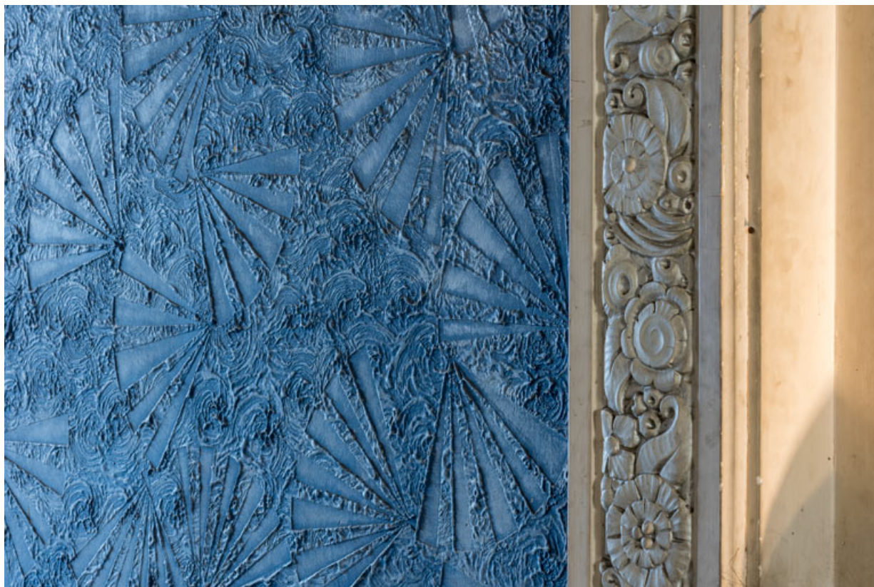
Décor en stuc du cadre de scène (côté jardin).