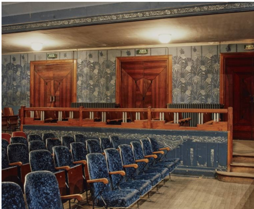
Salle en 1996 : galerie côté jardin et portes.