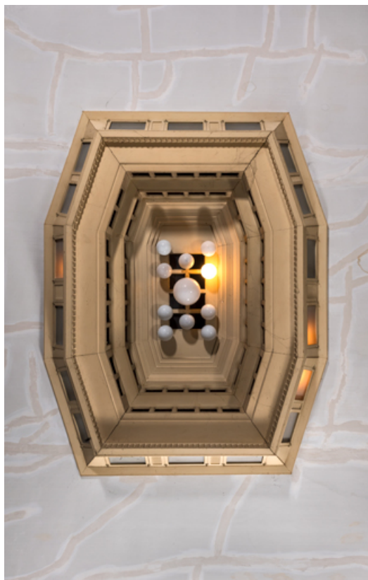
Caisson central lumineux.