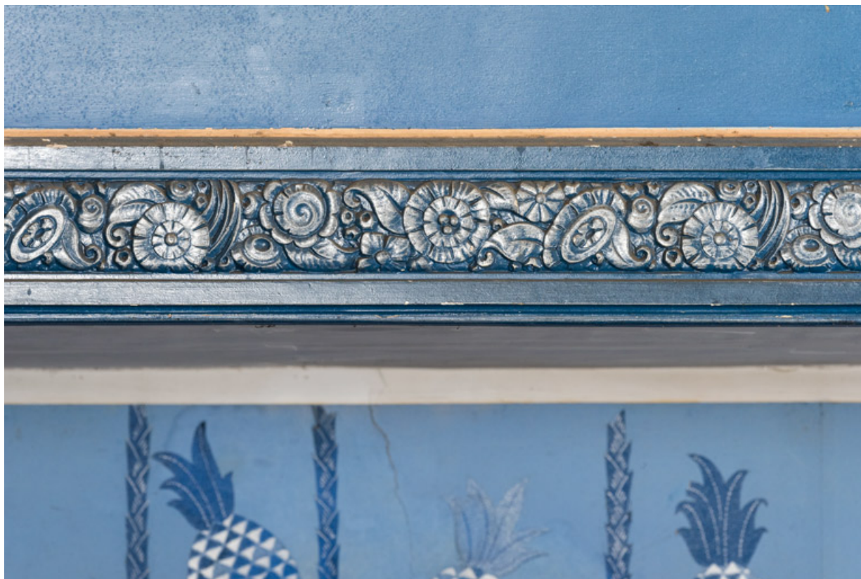
Décor en stuc sur le garde-corps du balcon.