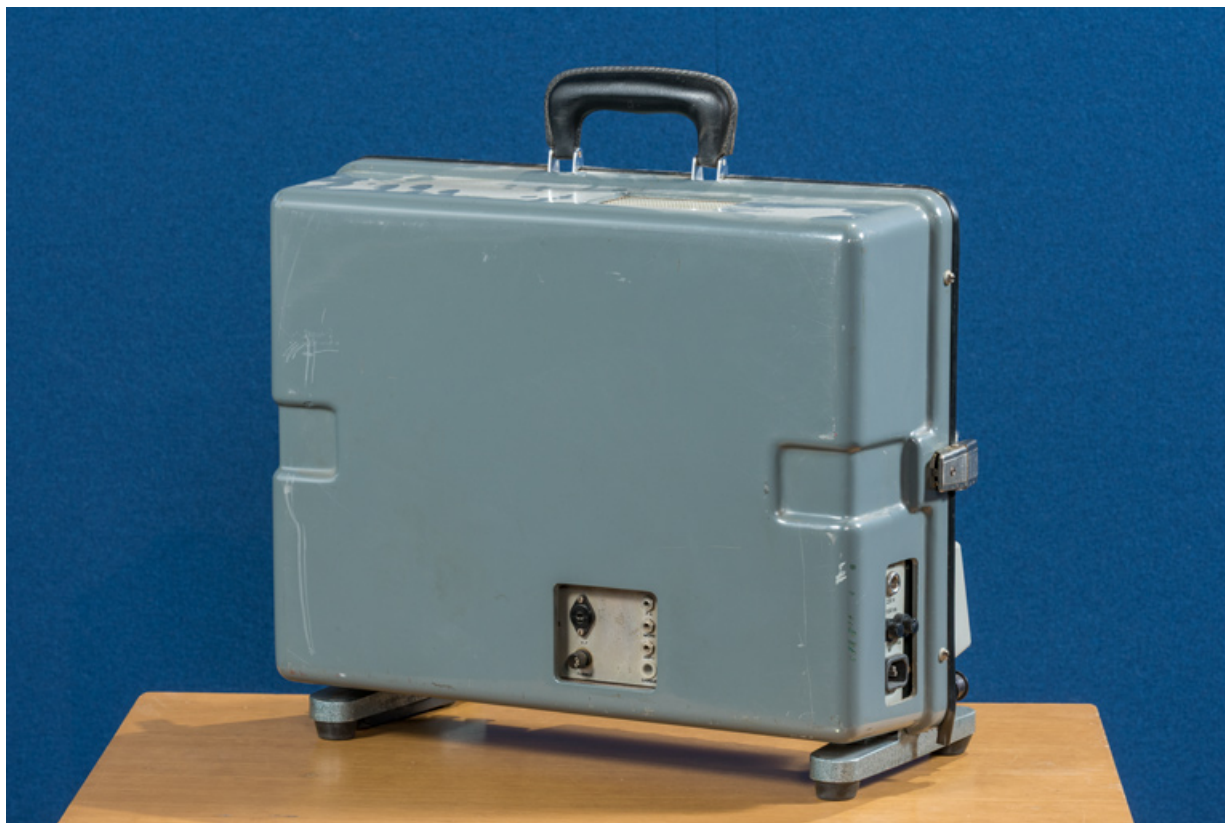
Caisse de transport : face arrière avec connectique.