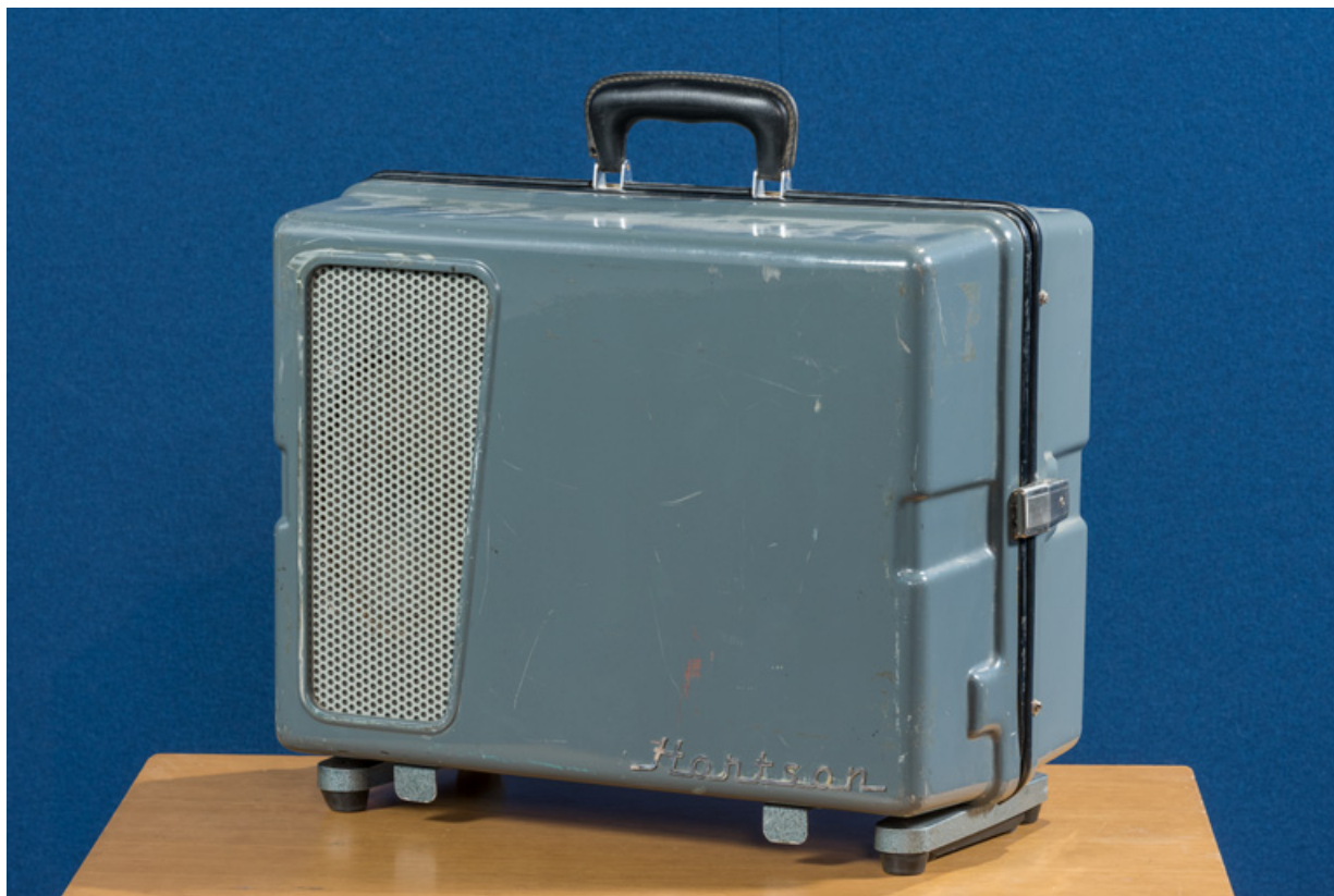
Vue d'ensemble, caisse de transport fermée.