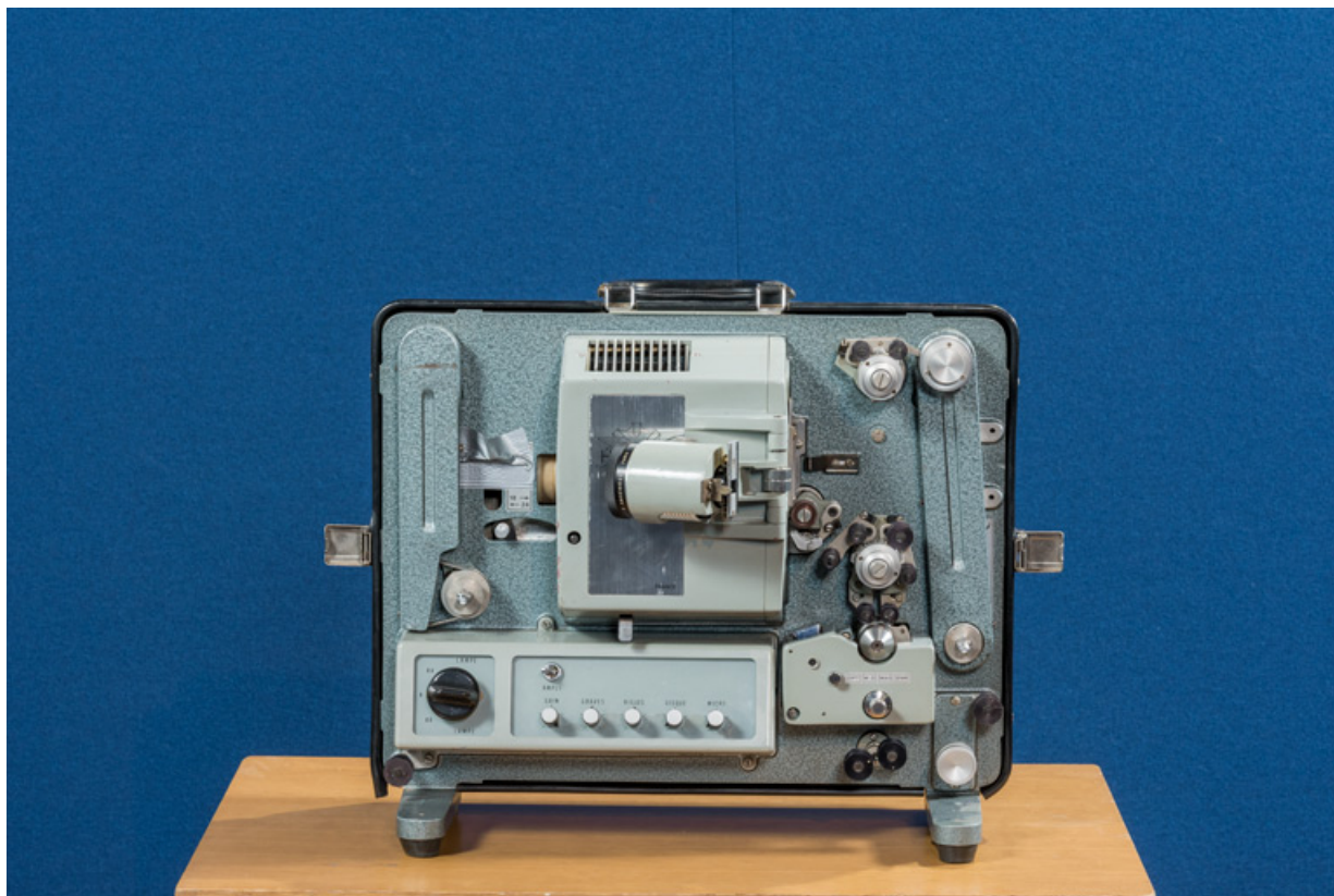
Face avant, objectif replié en position de transport.