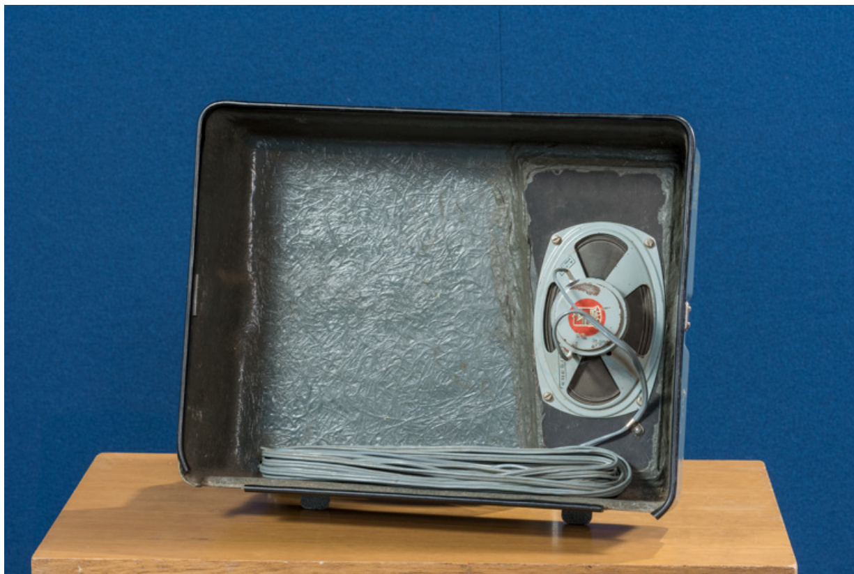
Couvercle de la caisse de transport, avec haut-parleur.