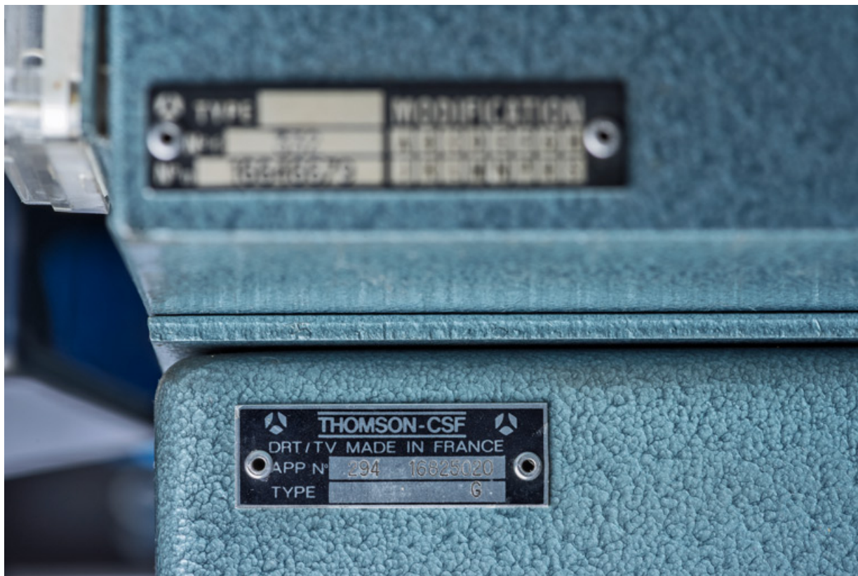
Plaque rivée à l'arrière du meuble (en haut à gauche).