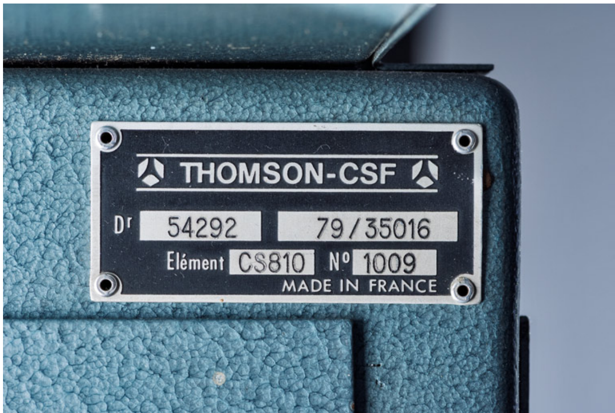
Plaque rivée à l'arrière du meuble (en haut à droite).