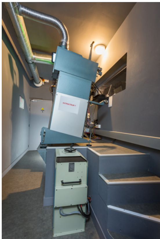
Vue d'ensemble, face droite.