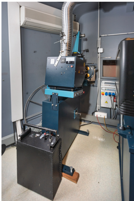
Vue d'ensemble, depuis l'arrière.