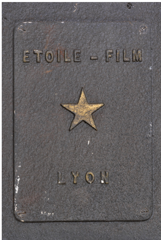
1er projecteur : nom du constructeur et logotype sur le couvercle vissée sur le pied. 71, La Clayette, 2A rue Faisant