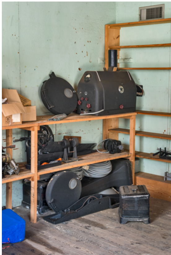
2e projecteur (démonté).