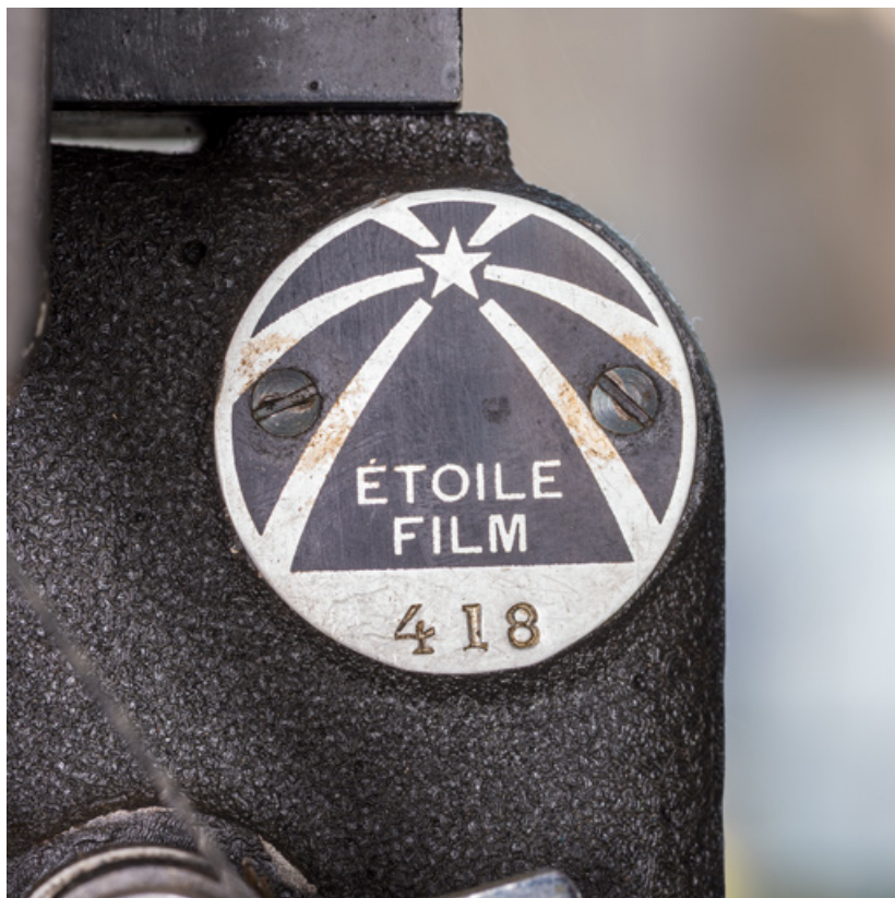
1er projecteur : plaque vissée sur le chrono.