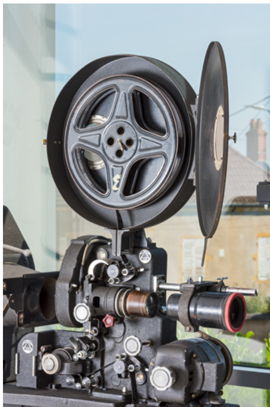
1er projecteur : porte-bobine ouvert et chrono (avec optique et moteur électrique). 71, La Clayette, 2A rue Faisant