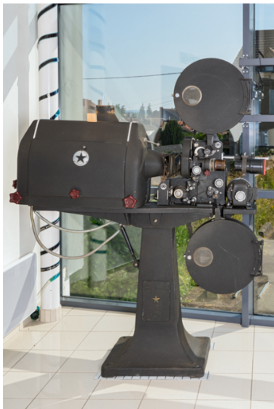
1er projecteur : face latérale gauche.