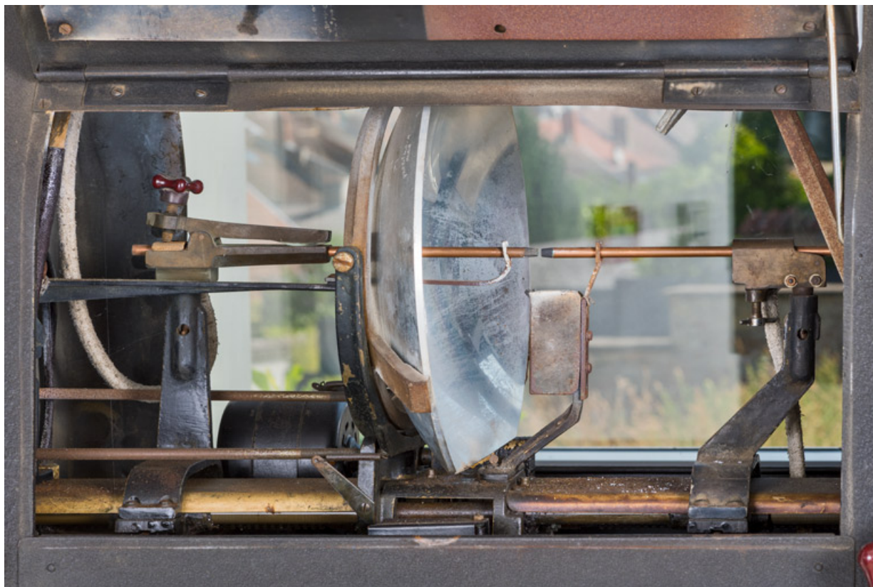
1er projecteur : lanterne ouverte, montrant miroir et électrodes.