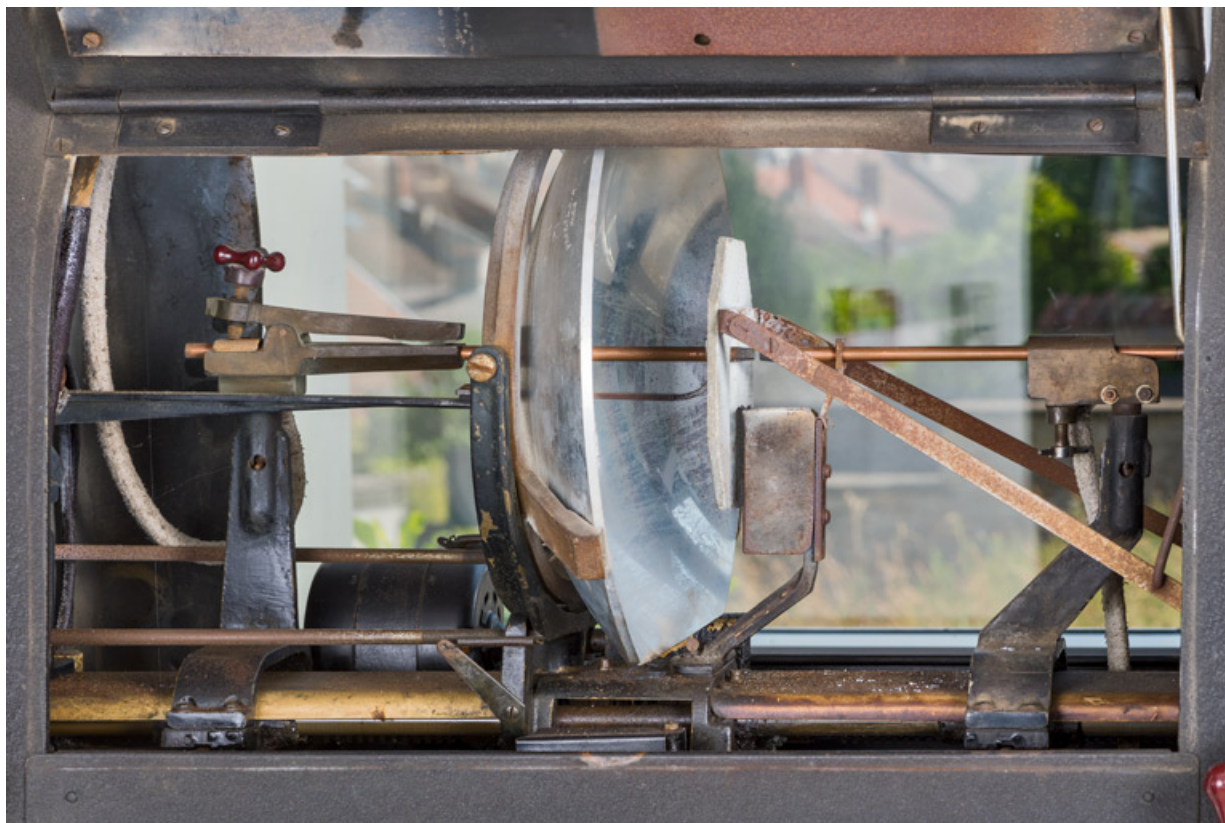
1er projecteur : lanterne ouverte, montrant miroir et électrodes, cache baissé. 71, La Clayette, 2A rue Faisant