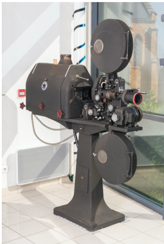
1er projecteur : vue d'ensemble.