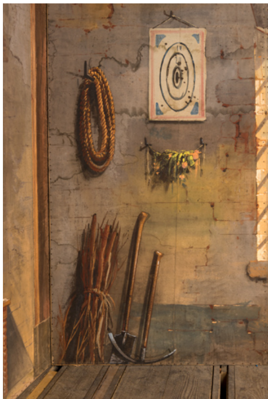
Intérieur rustique : fagot, pelle et pioche, rouleau de corde, cible et bouquet (côté cour). 71, Palinges, lieudit : Digoine