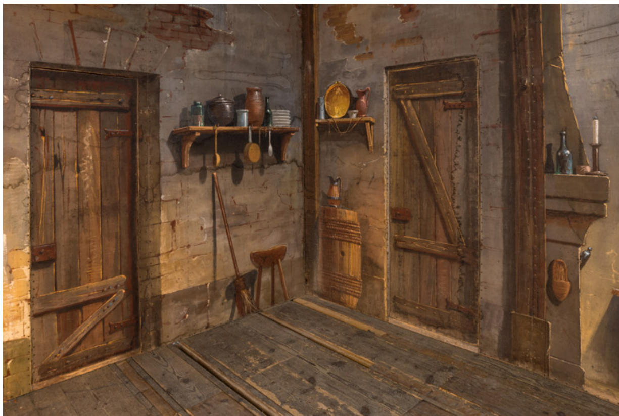
Intérieur rustique : portes dans l'angle côté jardin.