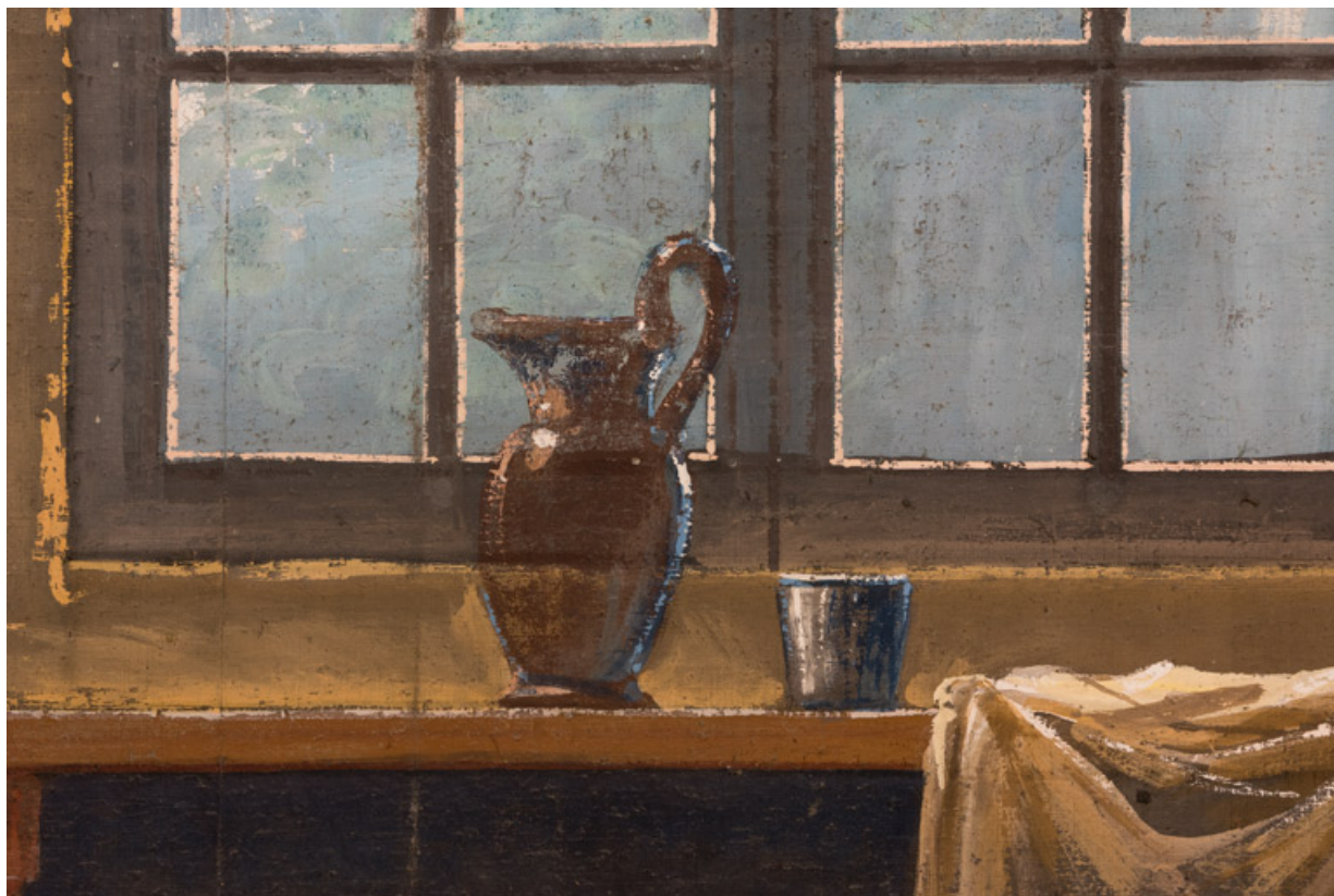
Intérieur rustique : pichet et timbale (au lointain).