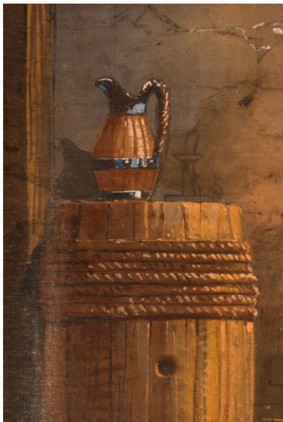
Intérieur rustique : pichet sur un tonneau (au lointain). 71, Palignes, lieudit : Digoine