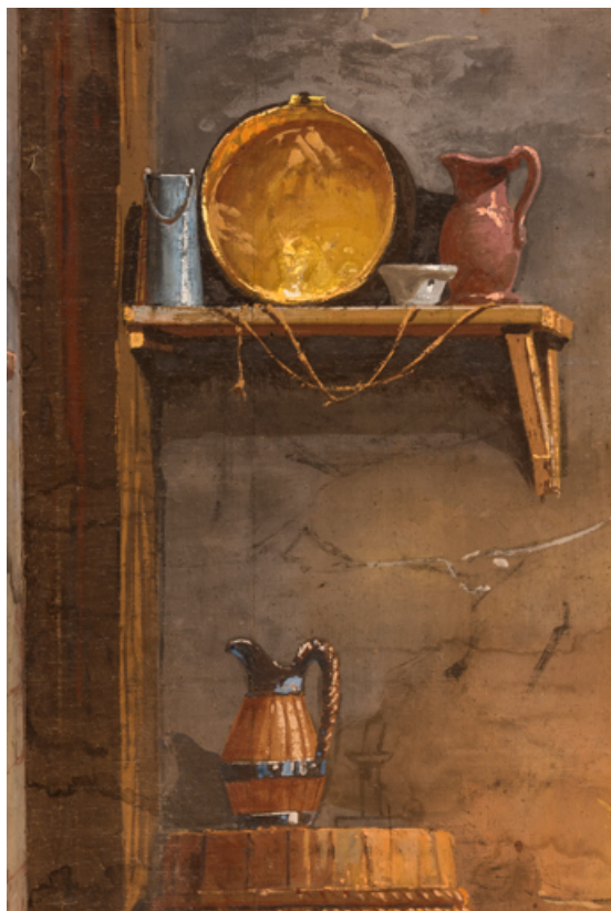
Intérieur rustique : pichets et bassine (au lointain). 71, Palignes, lieudit : Digoine