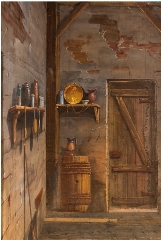
Intérieur rustique : angle côté jardin.