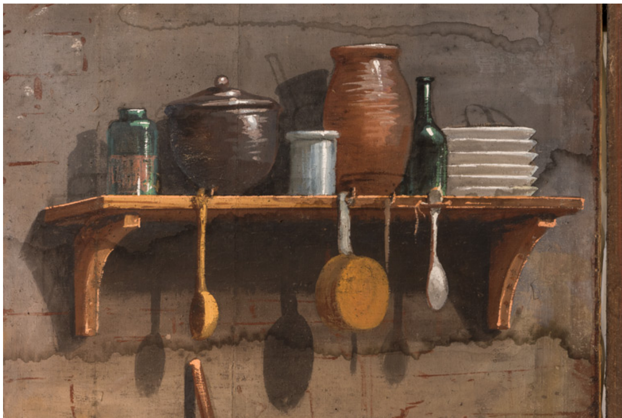
Intérieur rustique : instruments de cuisine et récipients (côté jardin).