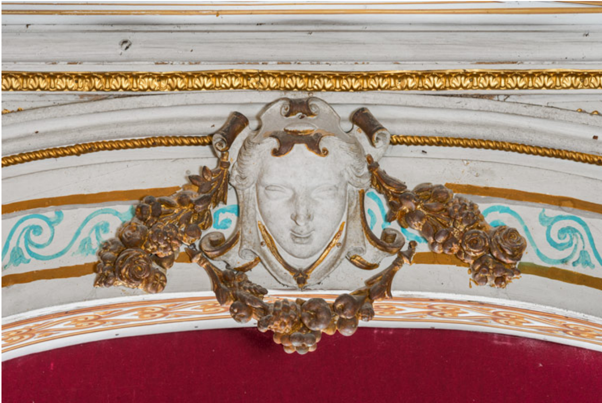
Masque féminin (loge d'avant-scène, balcon côté cour).