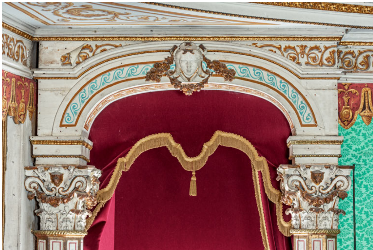
Loge d'avant-scène côté cour, au balcon : décor de la partie supérieure de la baie. 71, Palignes, lieudit : Digoine