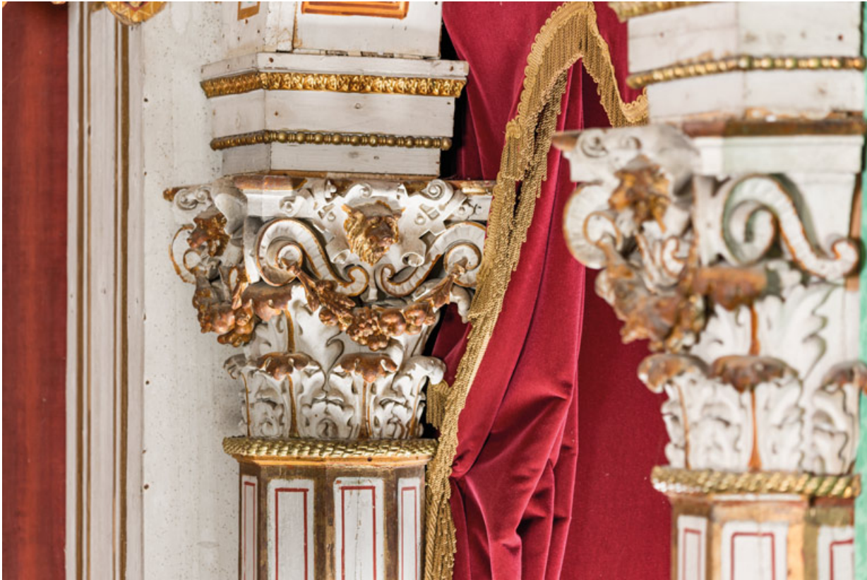
Chapiteaux corinthiens, vus en enfilade (loge d'avant-scène, balcon côté cour). 71, Palignes, lieudit : Digoine