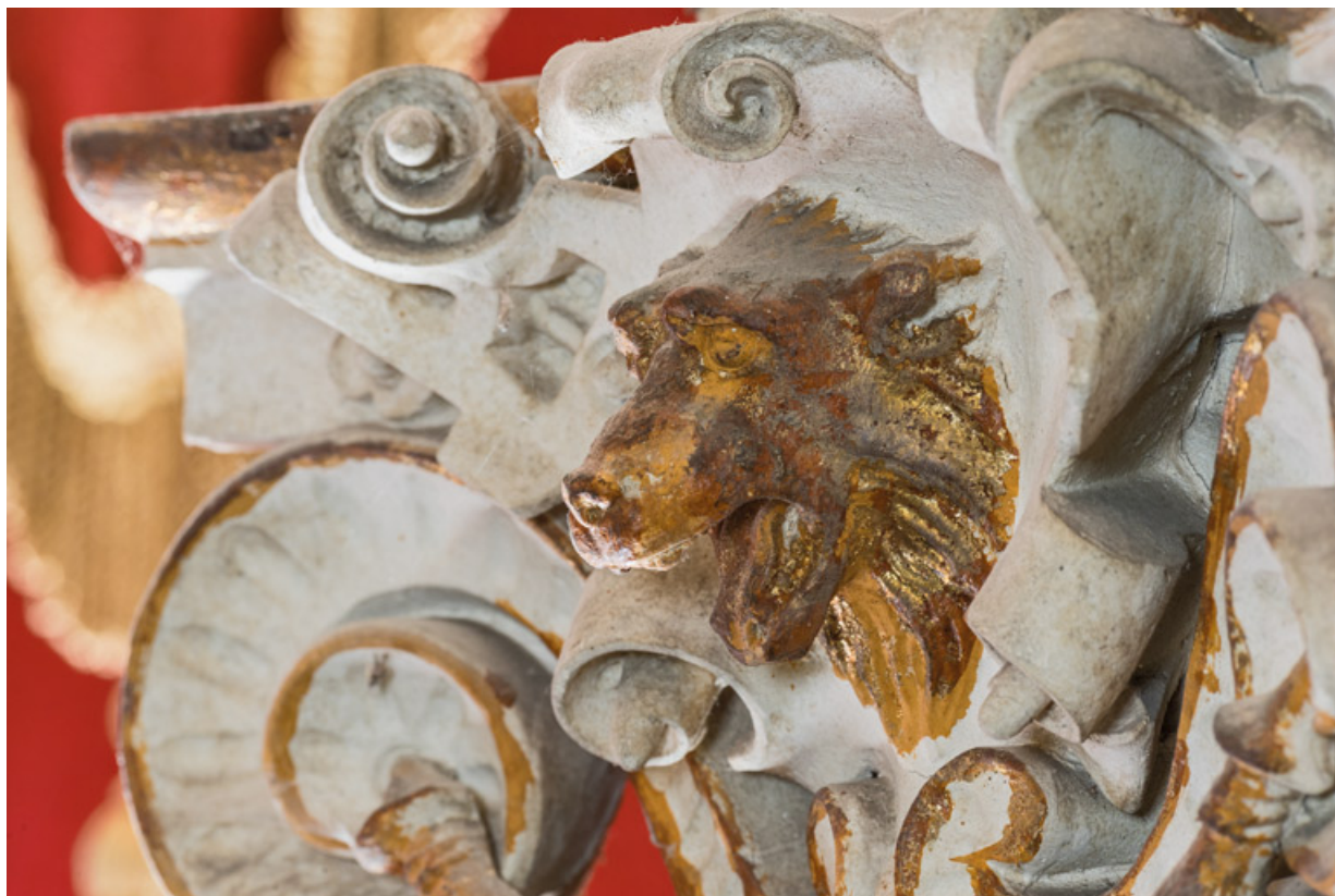
Chapiteau corinthisant : tête d'ours ou de loup.