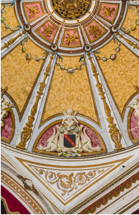
Plafond : un secteur du décor peint.