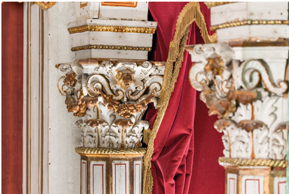
Chapiteaux corinthiens, vus en enfilade (loge d'avant-scène, balcon côté cour). 71, Palignes, lieudit : Digoine