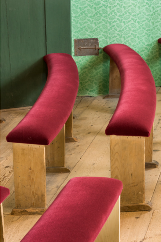
Banquettes, vues de profil.