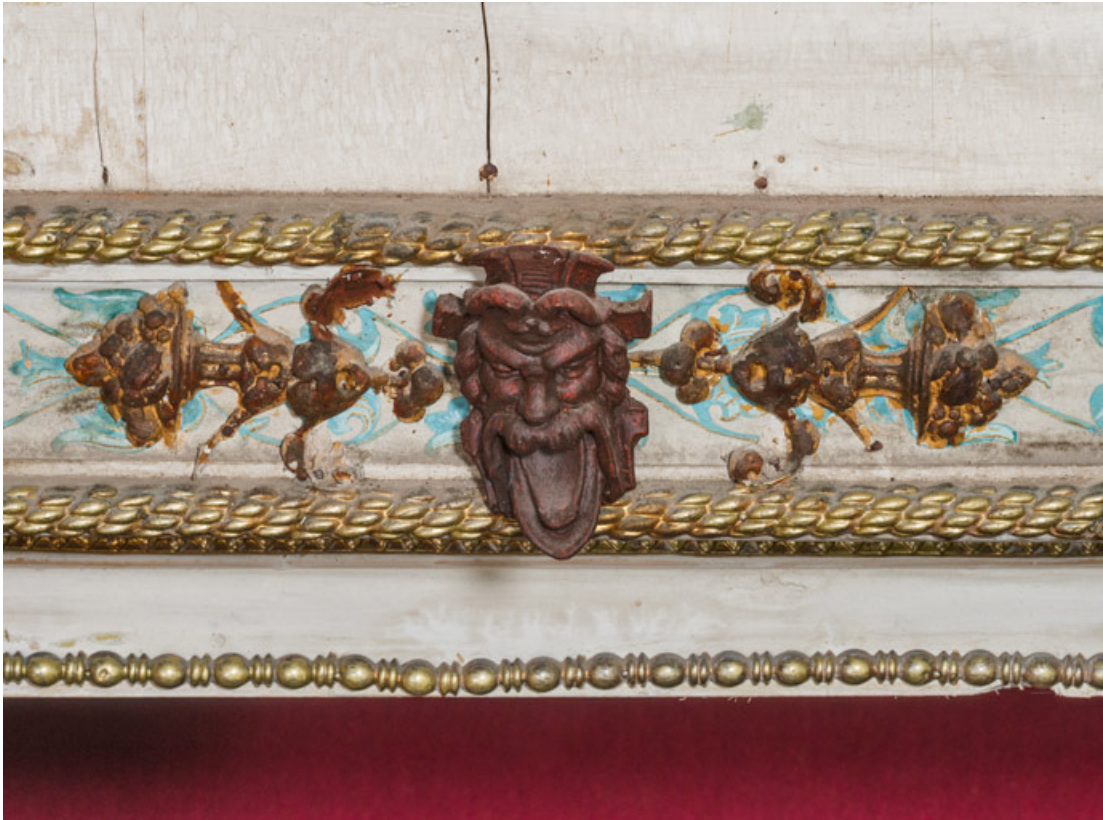
Masque masculin (loge d'avant-scène, parterre côté cour).