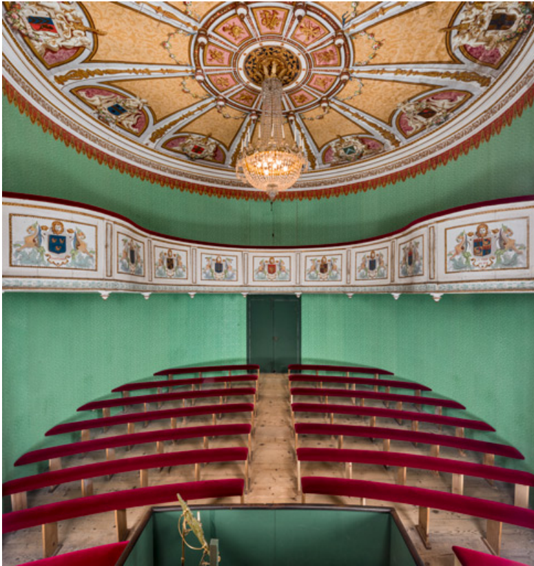
Salle, vue (rapprochée) depuis la scène.