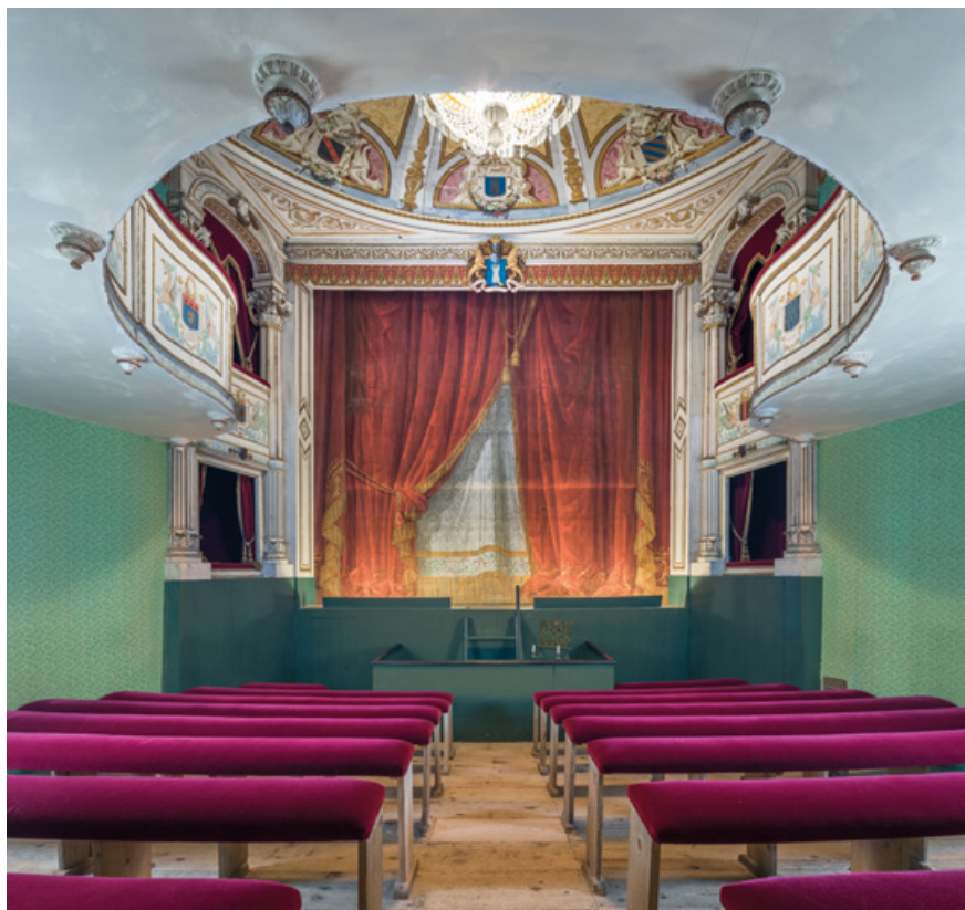
Salle, vue vers la scène.