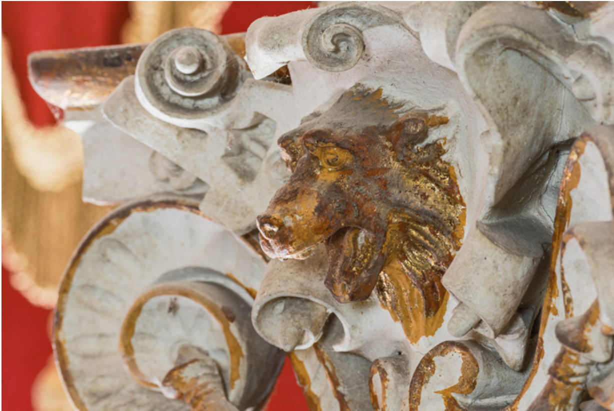
Chapiteau corinthisant : tête d'ours ou de loup.