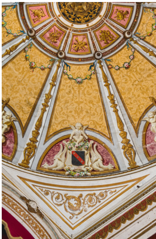
Plafond : un secteur du décor peint.