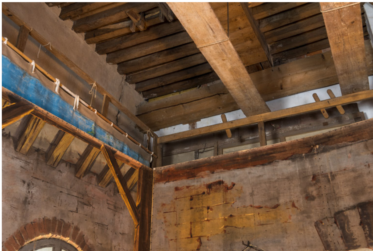
Machinerie : gril et palettes pour la fixation des fils.