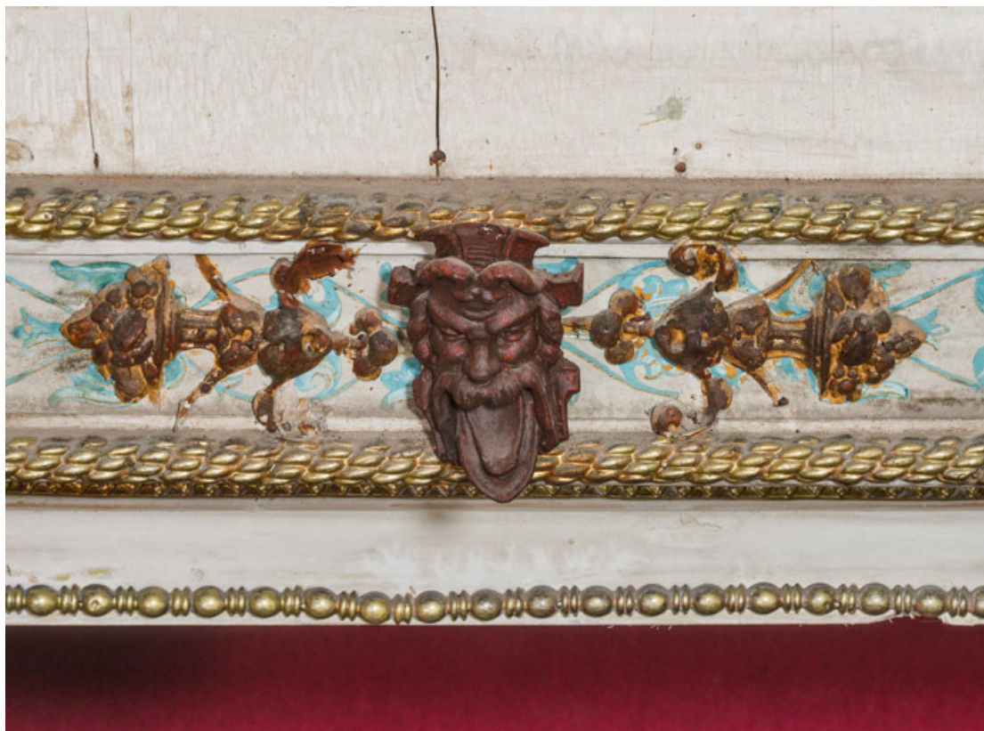
Masque masculin (loge d'avant-scène, parterre côté cour).