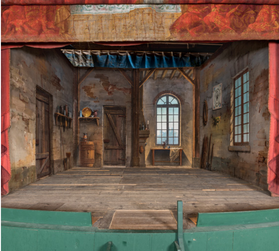
Intérieur rustique en place sur la scène.