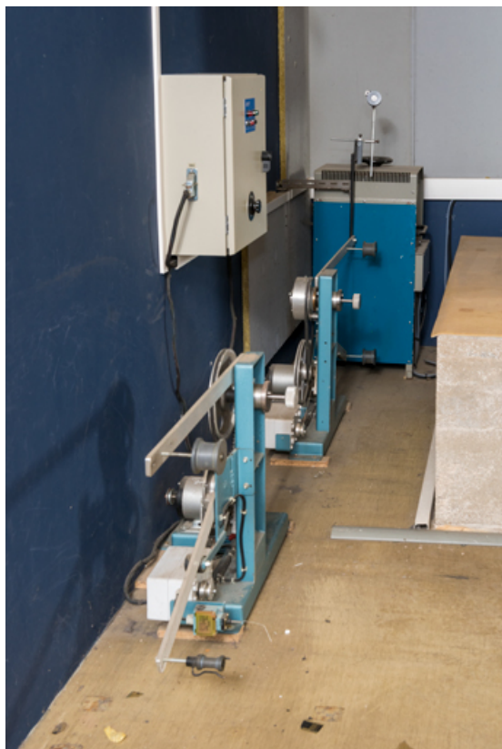
Enrouleur-dérouleur en ligne IDEF, en avant du redresseur IREM.