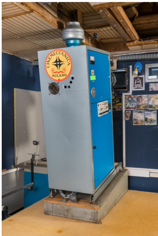
Vue d'ensemble, de trois quarts arrière.