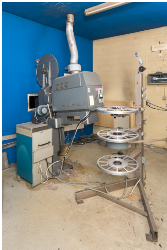
Redresseur Irem N3-X75/95DM, projecteur Cinemeccanica Victoria 8 r et enrouleur-dérouleur de film ST200. 71, Montceau-les-Mines, 13 rue Ferrer