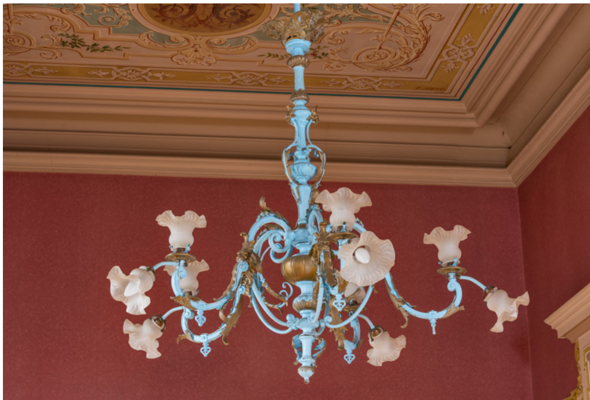
Grand foyer du public (salon d'honneur) : lustre.