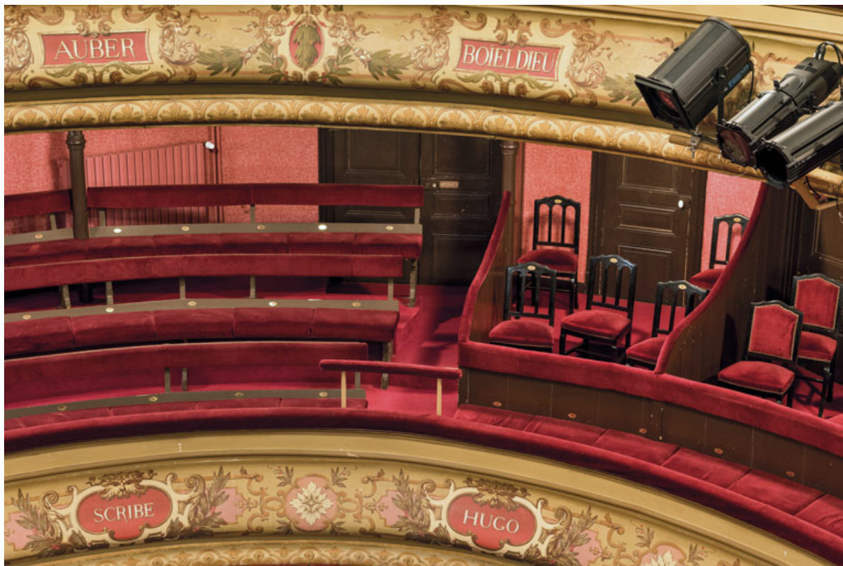
Salle : banquettes et chaises au premier balcon.