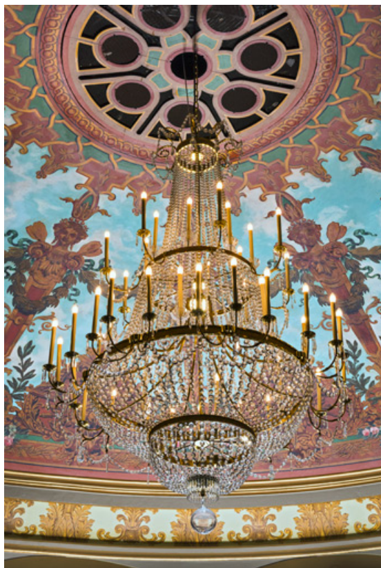
Salle : grand lustre.