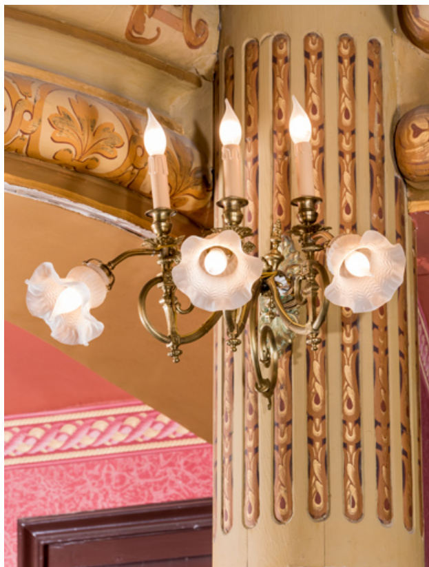
Salle : luminaire d'applique (cadrage vertical). 71, Autun place du Champ de Mars