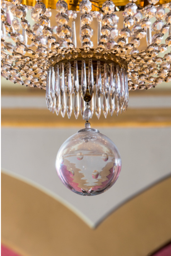
Salle : pendeloques du grand lustre.