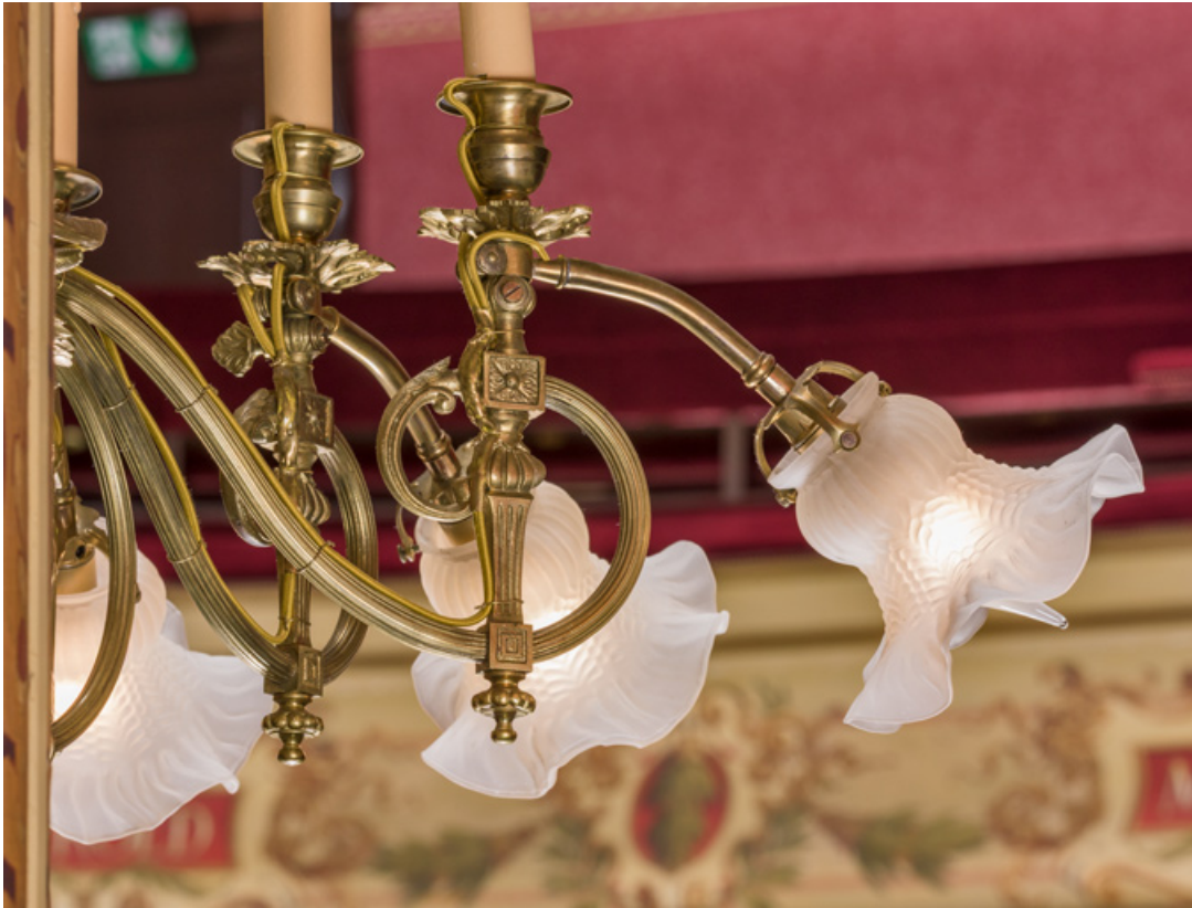
Salle : luminaire d'applique (détail).