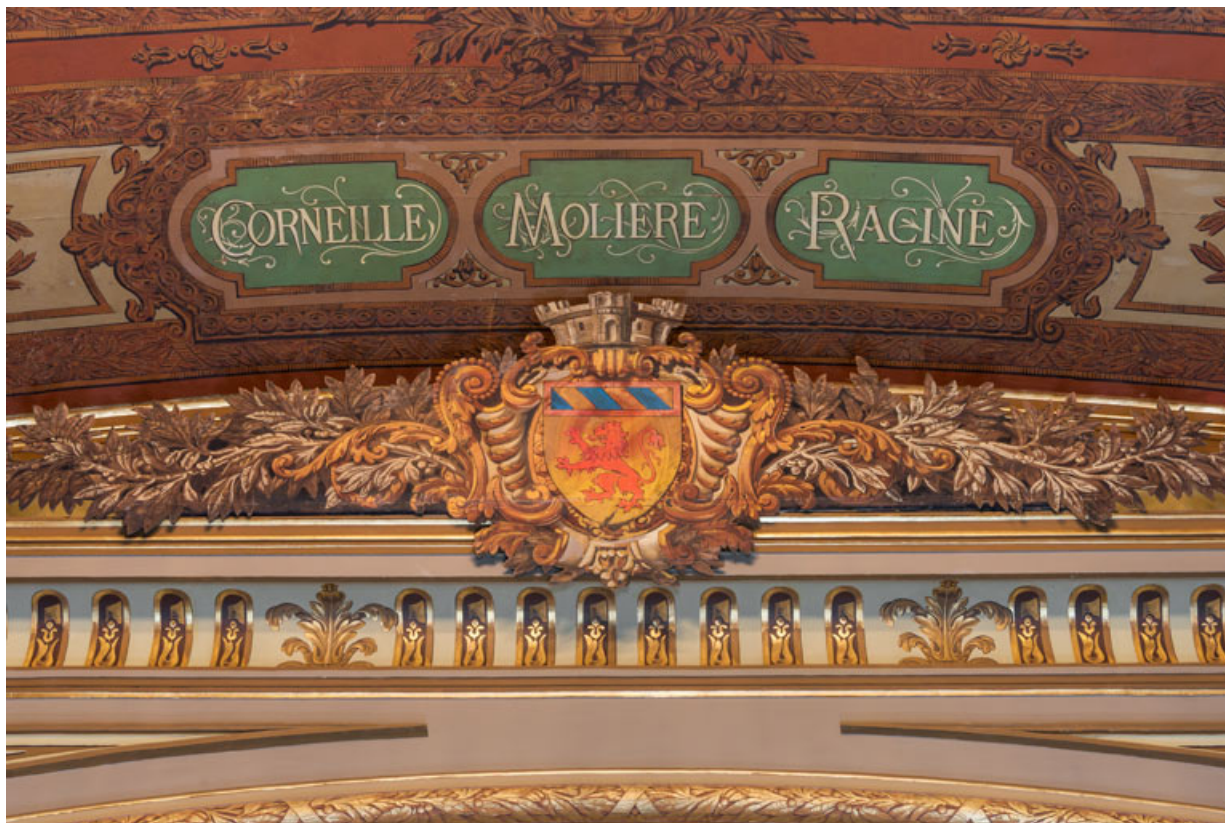
Salle : armoiries au sommet du cadre de scène. 71, Autun place du Champ de Mars