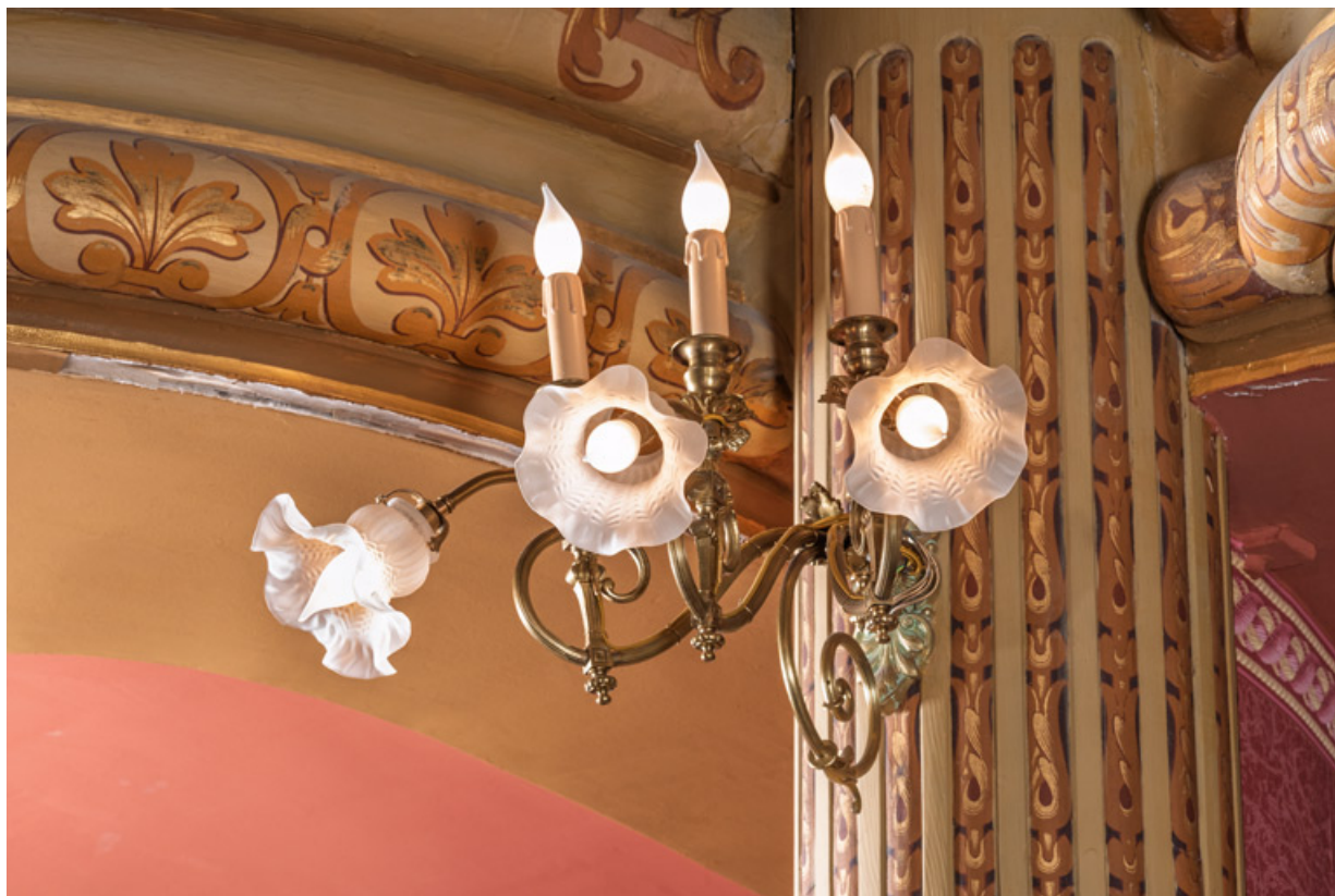
Salle : luminaire d'applique (cadrage horizontal). 71, Autun place du Champ de Mars