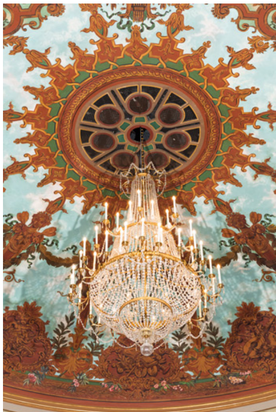
Salle : grand lustre.