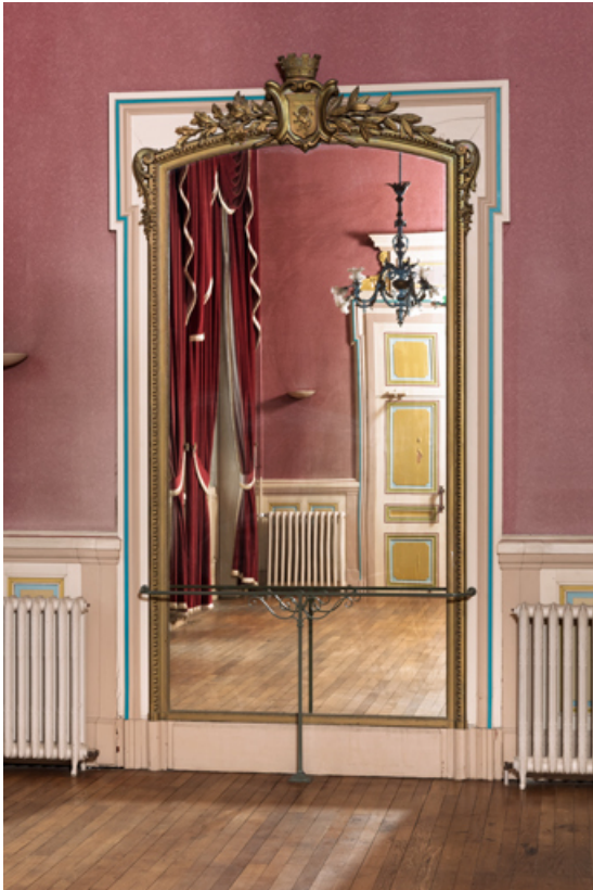
Grand foyer du public (salon d'honneur) : miroir.