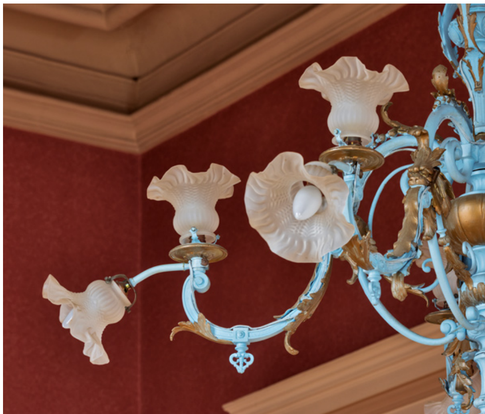
Grand foyer du public (salon d'honneur) : lustre (détail).