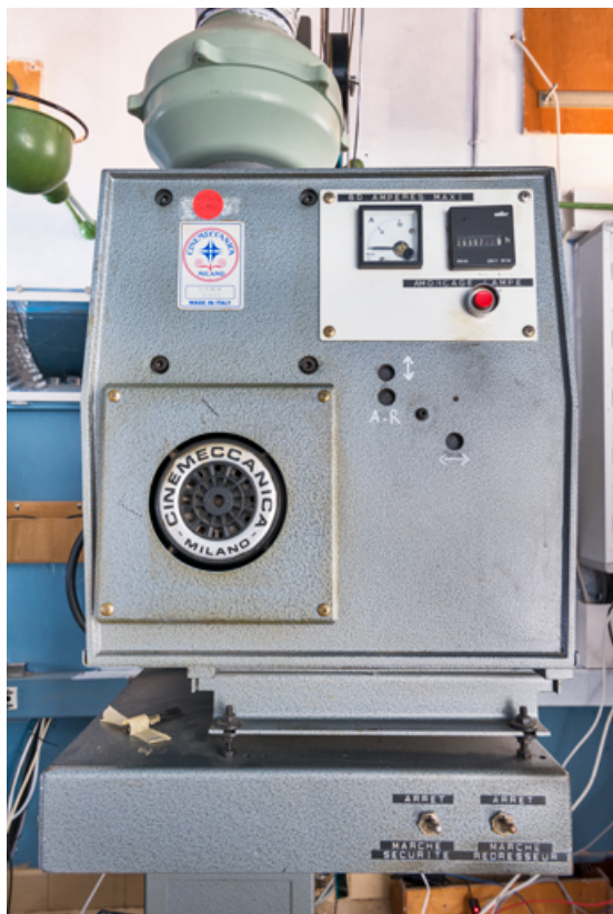
Face arrière de la lanterne.