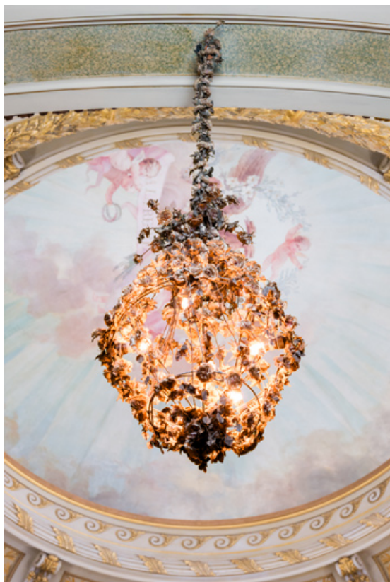
Un lustre, vu en contre-plongée.