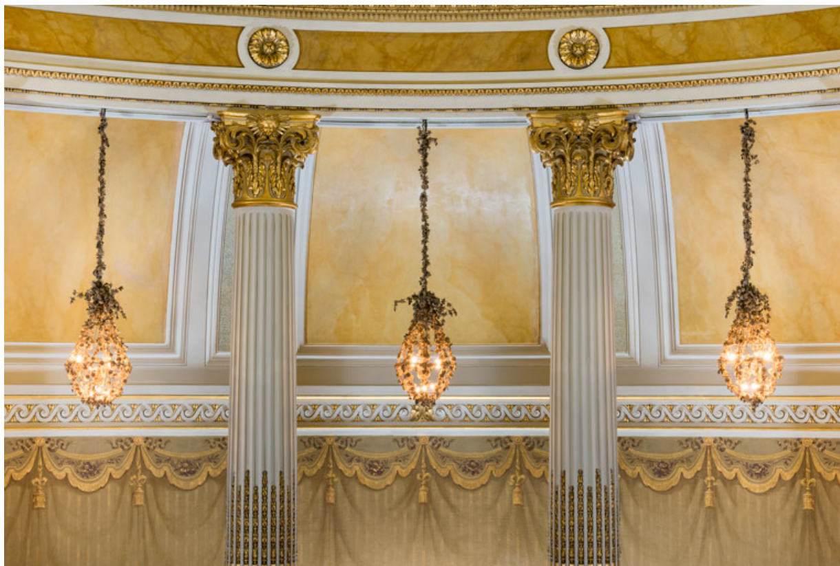
Vue d'ensemble de trois lustres.