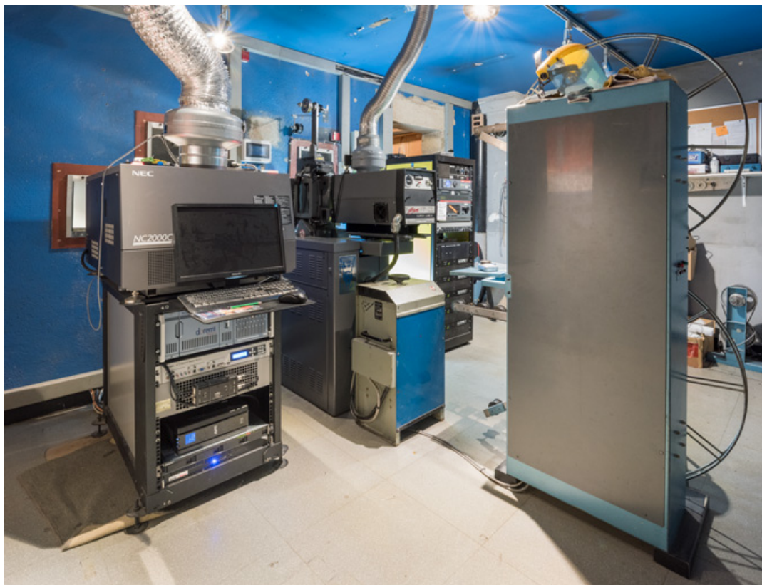
Vue d'ensemble de la cabine depuis le fond. Projecteur numérique Nec à gauche, projecteur argentique Simplex et redresseur Prévost au centre, enrouleur-dérouleur vertical Idef à droite.