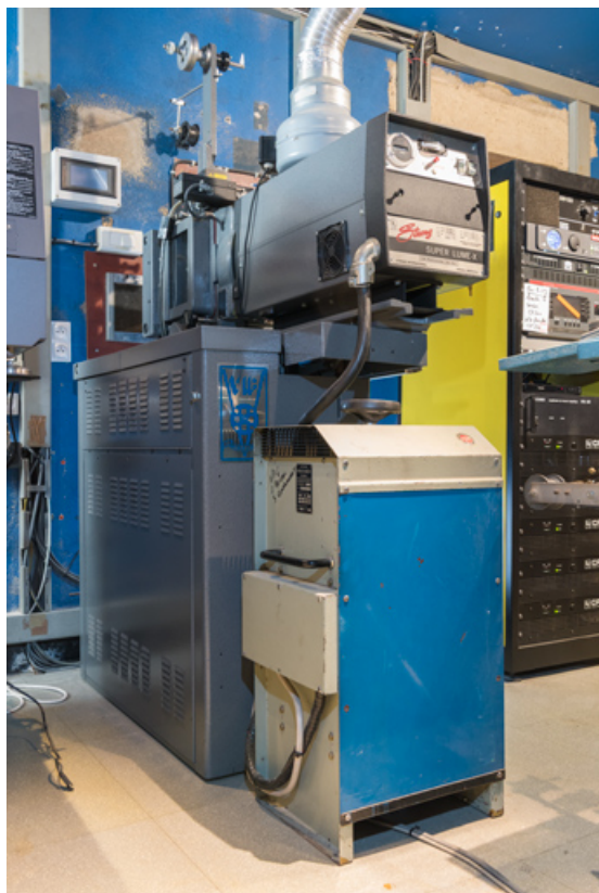
Projecteur Simplex et redresseur Prevostr, de trois quarts arrière gauche. 71, Tournus, 37 rue de la République