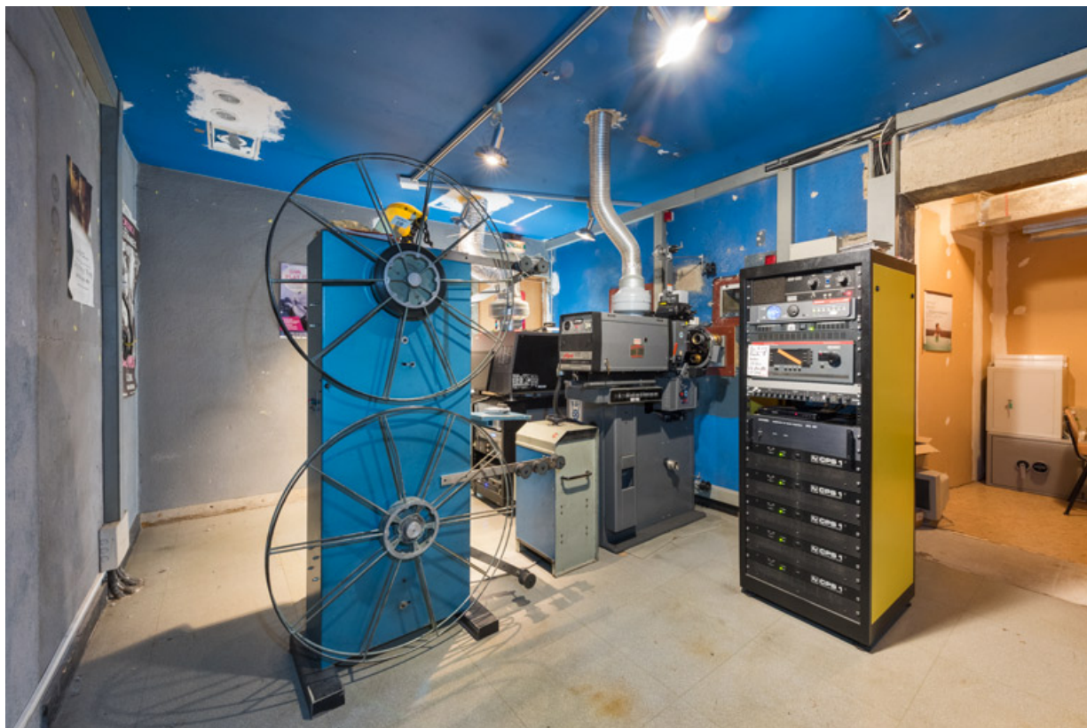
Vue d'ensemble de la cabine depuis l'entrée. Au centre l'enrouleur-dérouleur vertical Idef, le redresseur Prevost et le projecteur Simplex.