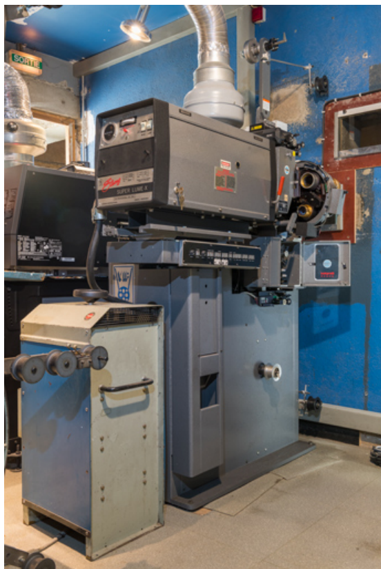
Projecteur Simplex et redresseur Prevost, de trois quarts arrière droit. 71, Tournus, 37 rue de la République