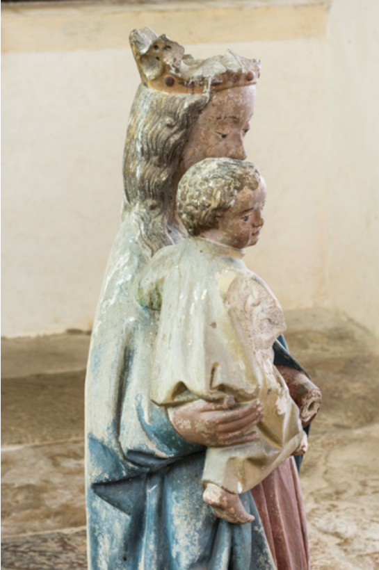
Détail : partie supérieure.

71, Sennecey-le-Grand rue de l' Église Saint-Julien