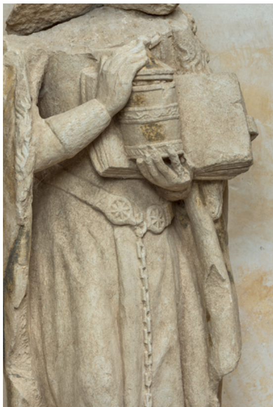
Détail : vase à onguents et livre.

71, Laives montée de Lenoux, lieudit : Lenoux