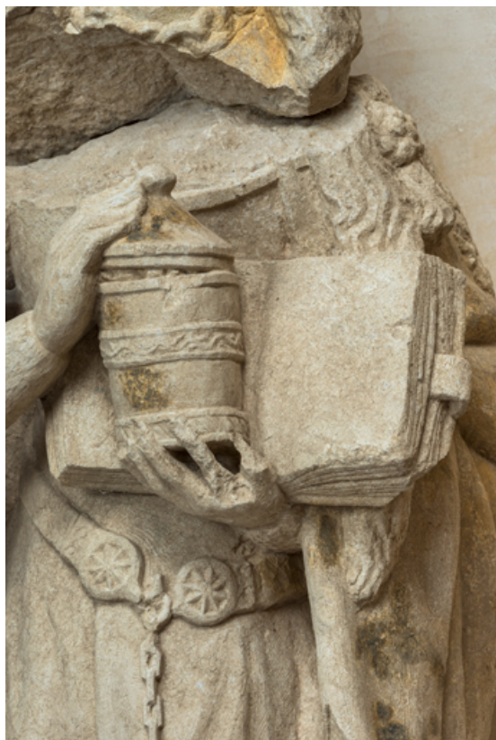
Détail : vase à onguents et livre.

71, Laives montée de Lenoux, lieudit : Lenoux