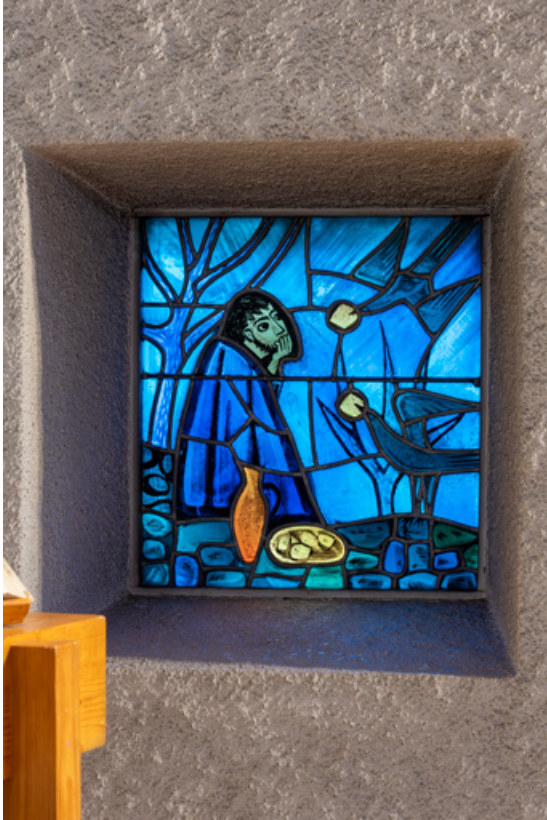
Vue de la verrière en vitrail de gauche (baie 0, droite). 71, Mâcon, 32 rue Saint-Antoine