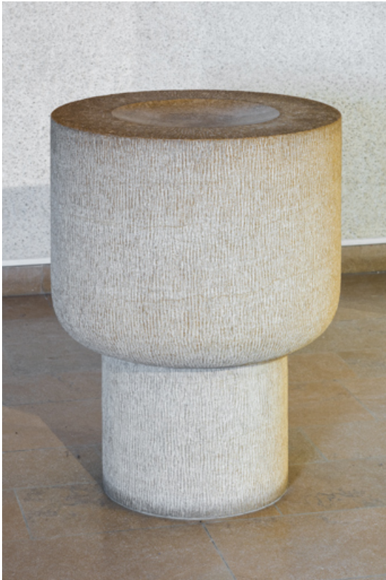
Vue des fontes baptismaux.